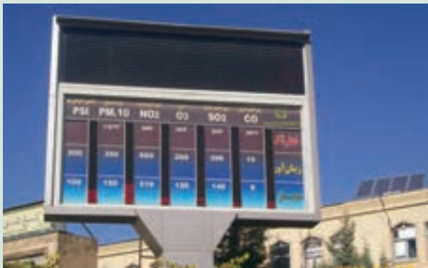
شکل ۶۲-۱- ایستگاه پایش کیفیت هوا- صدف (ترافیکی)- بلوار وکیل آباد- جمعه ۱۳۸۹/۹/۲۶

آلاینده هایی که در هوای شهر از طریق سوخت خودروها و سایر موارد تولید می شوند بیشتر شامل: منواکسید کربن CO، دی اکسید نیتروژن NO 2 ، دی اکسید گوگرد SO 2 ، ازن O 3 و ذرات معلق (Dust) است. اداره کل حفاظت محیط زیست در سطح شهر از طریق ۱۲ ایستگاه پایش کیفیت هوا اقدام به جمع آوری اطلاعات از گازها و ذرات معلق در هوای شهر می نماید. شکل ۶۲-۱ برخی از این آلاینده ها را نشان می دهد.