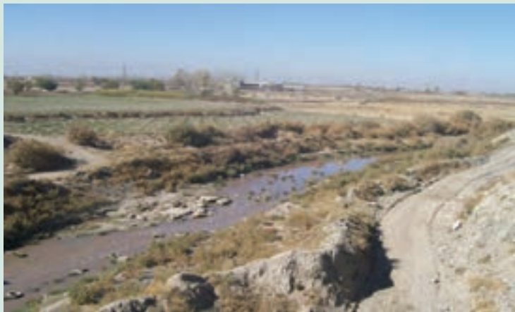
شکل ۶۳-۱- بخشی از مسیر کشف رود در حاشیه شهر مشهد

رودخانه کشف رود که در گذشته مظهر پاکی و به دریا معروف بود، اکنون با ورود فاضلاب‌های انسانی و صنعتی حاشیه شهر مشهد به این رودخانه، تبدیل به یکی از مهم‌ترین مظاهر آلودگی زیست محیطی منطقه شده است. فاضلاب‌های صنعتی حاصل بخشی از فعالیت‌های شهرک صنعتی، واحدهای آبرکاری، صنایع پوست و چرم، واحدهای قالب‌سویی و فاضلاب‌های خانگی مسیر رودخانه هستند که به‌طور غیر قانونی به بستر آن وارد شده و باعث آلودگی شدید آب شده‌اند. متأسفانه برخی کشاورزان منطقه در حاشیه این رودخانه آلوده برای آبیاری زمین‌های کشاورزی به ویژه صیفی کاری استفاده می‌کنند و محصولات حاصل از این شیوه نادرست آبیاری در نهایت وارد بازار مصرف و به خصوص شهر مشهد می‌شود.