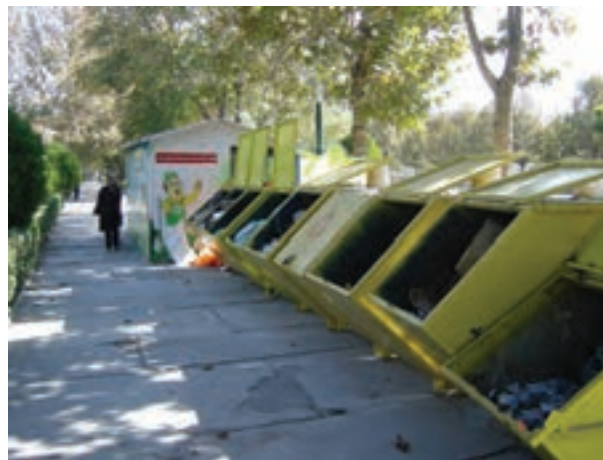
شکل ۶۴-۱- ایستگاه‌های ثابت جمع‌آوری زباله مشهد

بازیافت زباله باعث کاهش آلودگی‌های زیست محیطی، حفظ منابع و ذخایر زیرزمینی، کاهش وابستگی به خارج در زمینه کالا و مواد اولیه و به‌طور کلی جلوگیری از اتلاف منابع و سرمایه‌های ملی می‌شود.