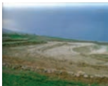
شکل ۱-۶۵- تراس بندی