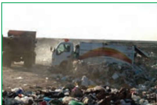
شکل ۸۳-۱- دفع غیربهداشتی زباله ها