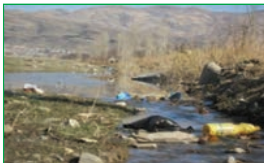
شکل ۸۱-۱- فاضلاب‌های شهری در بستر رودخانه‌ها

و به چرخه آب برمی گردند که باعث آلودگی آب و خاک می شوند. در اثر فعالیت های تولیدی و صنعتی در کارخانجات و واحدهای صنعتی استان نیز فاضلاب صنعتی تولید می شوند و در نتیجه مقدار قابل توجهی از مواد شیمیایی خطرناک را وارد آب های سطحی و زیرزمینی می کنند.