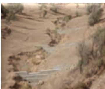
شکل ۱-۶۳- بند گابیونی (سنگ ها در تور سیمی)