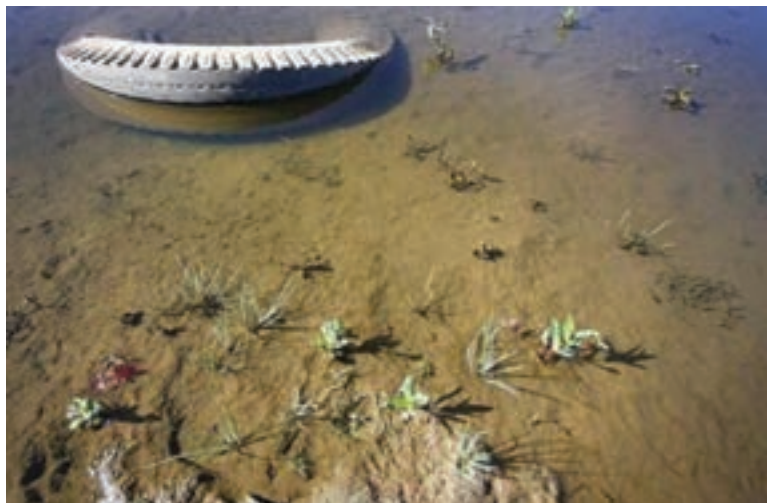
شکل ۸۰-۱ آلودگی آب ها بر اثر ریختن زباله به داخل آن

فاضلاب ها و زباله های شهری (خانگی و بیمارستانی)، کشاورزی و صنعتی، عمده ترین عوامل آلوده کننده آب های سطحی و زیرزمینی استان محسوب می شوند. سالانه بیش از ۵۰ میلیون مترمکعب فاضلاب شهری به عرصه های زیست محیطی وارد می شود. در فاضلاب های شهری باکتری های بیماری زای فراوانی وجود دارد که اگر با روش های مناسب نابود یا دفع نگردند، در محیط باقی می ماند و خطرهای جدی برای انسان به بار می آورند. فاضلاب های کشاورزی نیز به دلیل همراه داشتن سموم آفت کش و کودهای شیمیایی به صورت محلول، در روان آب های کشاورزی باقی می ماند