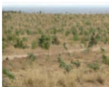
شکل ۱-۶۱- نهال کاری