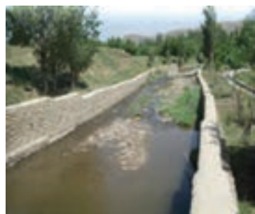
شکل ۱-۶۴- دیوار حاشیه رودخانه