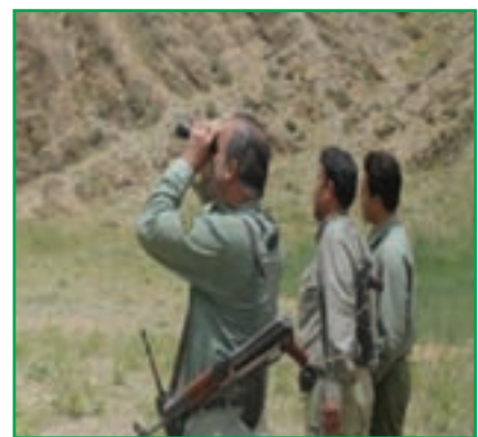
شکل ۱-۷۲- محیط‌بانان سازمان حفاظت از محیط زیست

پژوهش کنید! بررسی کنید که در سال‌های اخیر کدام یک از گونه‌های گیاهی و جانوری محل زندگی شما از بین رفته است؟ نتیجه را به کلاس ارائه دهید.