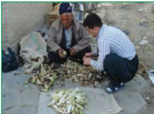
شکل ۵۸-۱ برداشت کنگر از مراتع