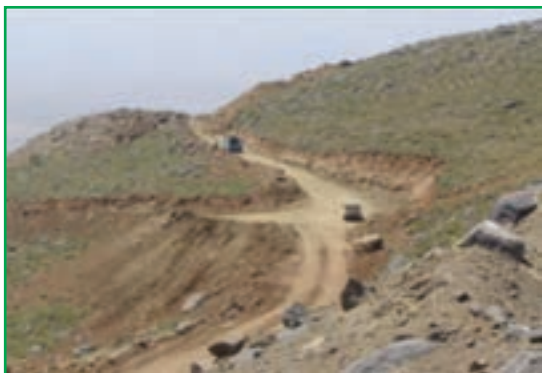
شکل ۵۹-۱ احداث راه در مراتع