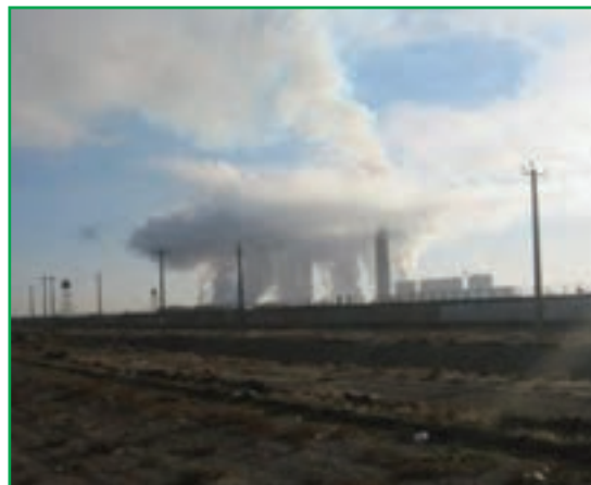
شکل ۷۸-۱ آلودگی هوا - صنایع