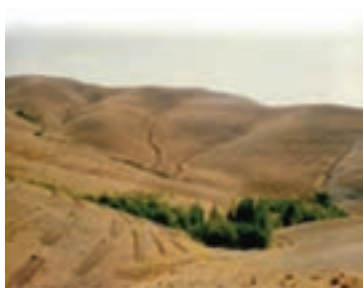
شکل ۱-۶۶- احداث بانکت بندی