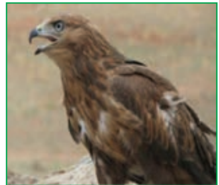
شکل ۱-۷۱- عقاب طلایی

پژوهش کنید! بررسی کنید که در سال‌های اخیر کدام یک از گونه‌های گیاهی و جانوری محل زندگی شما از بین رفته است؟ نتیجه را به کلاس ارائه دهید.