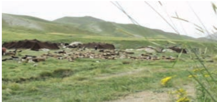
شکل ۵۷-۱ تغذیه دام عشایر