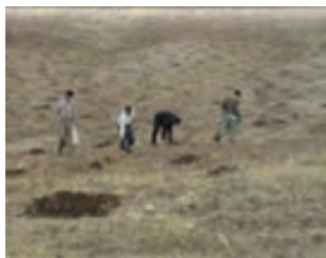
شکل ۱-۶۲- کپه کاری