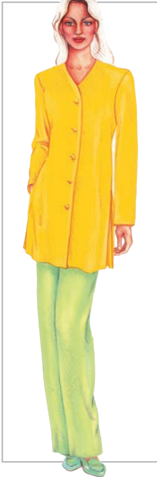
تصویر ۱-۵۶ - ترکیب بندی بر اساس رنگ های اشباع و غیر اشباع

ترکیب بندی بر اساس رنگ های اشباع و غیر اشباع این رنگ ها شامل تنوع ترکیب بندی های زیر می گردند: * ترکیب بندی رنگ های صرفاً اشباع (زنده) (تصویر ۱-۵۵- الف).