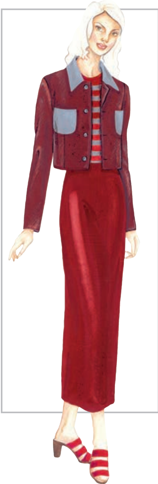
تصویر ۱-۳۴ - همجواری سطوح خاکستری بر زمینه‌ی رنگی - تضاد همزمانی

مثال : اگر سطحی خاکستری بر زمینه قرمز قرار گیرد متمایل به رنگ سبز (سبزی که مکمل آن رنگ قرمز است) به نظر می‌رسد.