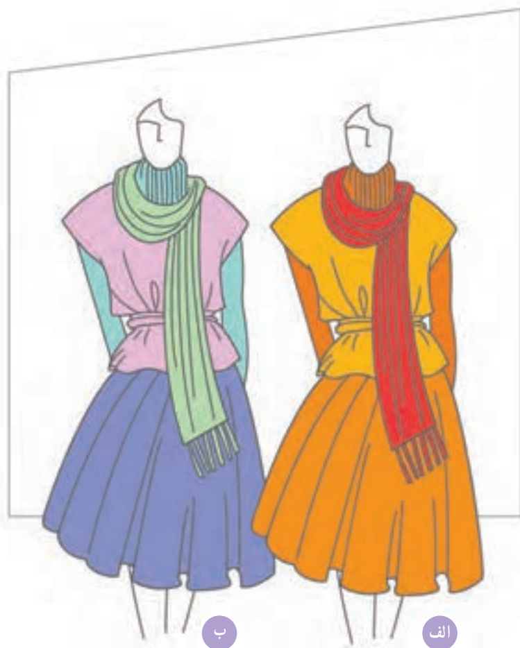
تصویر ۱-۵۹ - الف - ترکیب بندی بر اساس رنگ های گرم