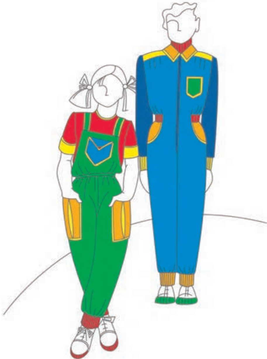
تصویر ۲-۲ - رنگ بندی مناسب لباس کودک

به کارگیری رنگ های درخشان، زنده و اشباع در کنار یکدیگر، با این گروه سنی متناسب است. مانند انواع زرد درخشان، نارنجی، سبز روشن، قرمز روشن و آبی روشن (تصویر ۲-۲).