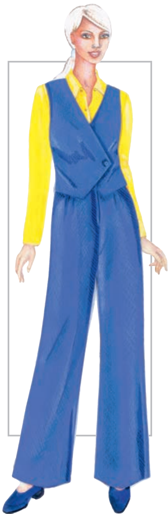
تصویر ۱-۵۸ — ترکیب بندی بر اساس رنگ های تیره و روشن

* ترکیب بندی رنگ های روشن و تیره (تصویر ۱-۵۸).