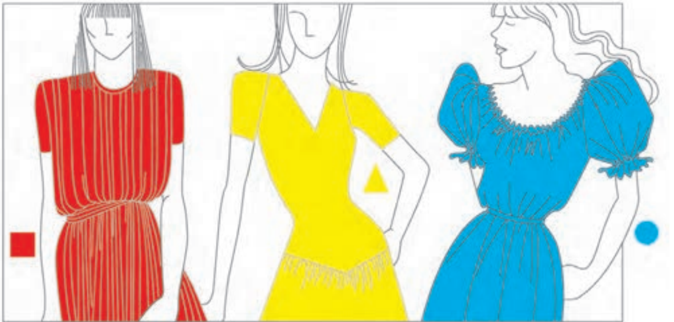
تصویر ۴۸-۱ - کاربرد رنگ‌های اصلی در سه شکل اصلی

ایتن معتقد است در مقابل سه رنگ اصلی، سه شکل اصلی نیز وجود دارد. بدین صورت که رنگ قرمز با مربع، رنگ آبی با دایره و رنگ زرد با مثلث مطابقت دارد و رنگ‌های ترکیبی چرخه‌ی رنگ، با شکل‌های ترکیبی مطابقت می‌نمایند (تصویر ۴۸-۱).