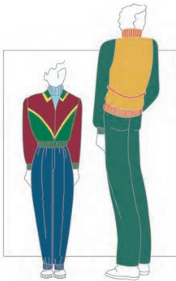
تصویر ۲-۴ - رنگ بندی مناسب لباس پسرانه

● رنگ های مناسب لباس پسرانه (نوجوان و جوان): رنگ بندی این گونه لباس ها فضایی فعال می آفریند و گاهی هم به سردی می گراید مانند انواع آبی، سبز، قهوه ای های روشن، قرمز بنفش، آبی بنفش و غیره (تصویر ۲-۴). مثلاً، مجاورت آبی بنفش و سبز، فضایی فعال، جوان و پویا ایجاد می کند.