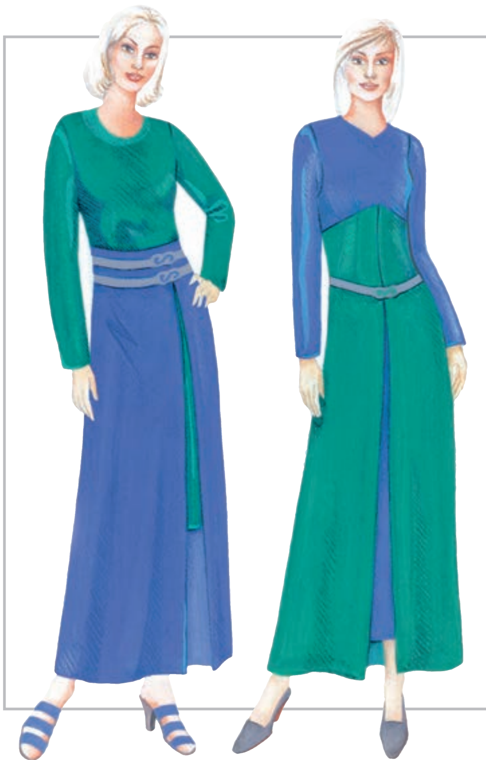
تصویر ۱-۳۵ - همجواری سطوح خاکستری بر زمینه‌ی رنگی - تضاد همزمانی

* همجواری رنگ‌ها در تضاد همزمانی یا سیمولتانه : زمانی که رنگ زمینه از خانواده‌ی گرم باشد، خاکستری بر آن سریع‌تر رنگ مکمل را به نظر می‌رساند (تصویر ۱-۳۵).