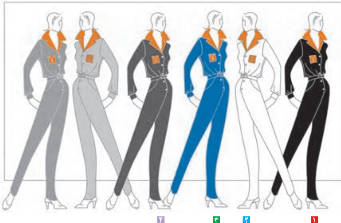
تصویر ۴۳-۱ - تأثیر فضایی گوناگون بر رنگ

زمینه‌های مختلف رنگی می‌تواند اثرات متفاوتی بر رنگ‌ها بگذارد این زمینه‌ها عبارتند از: (تصویر ۴۳-۱)