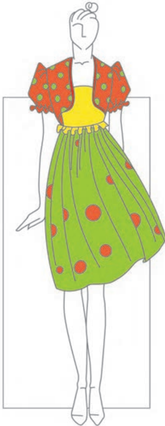
تصویر ۱-۵۳ - ترکیب بندی بر اساس رنگ های فام دار

* ترکیب بندی بر اساس رنگ های صرفاً فام دار (تصویر ۱-۵۴).