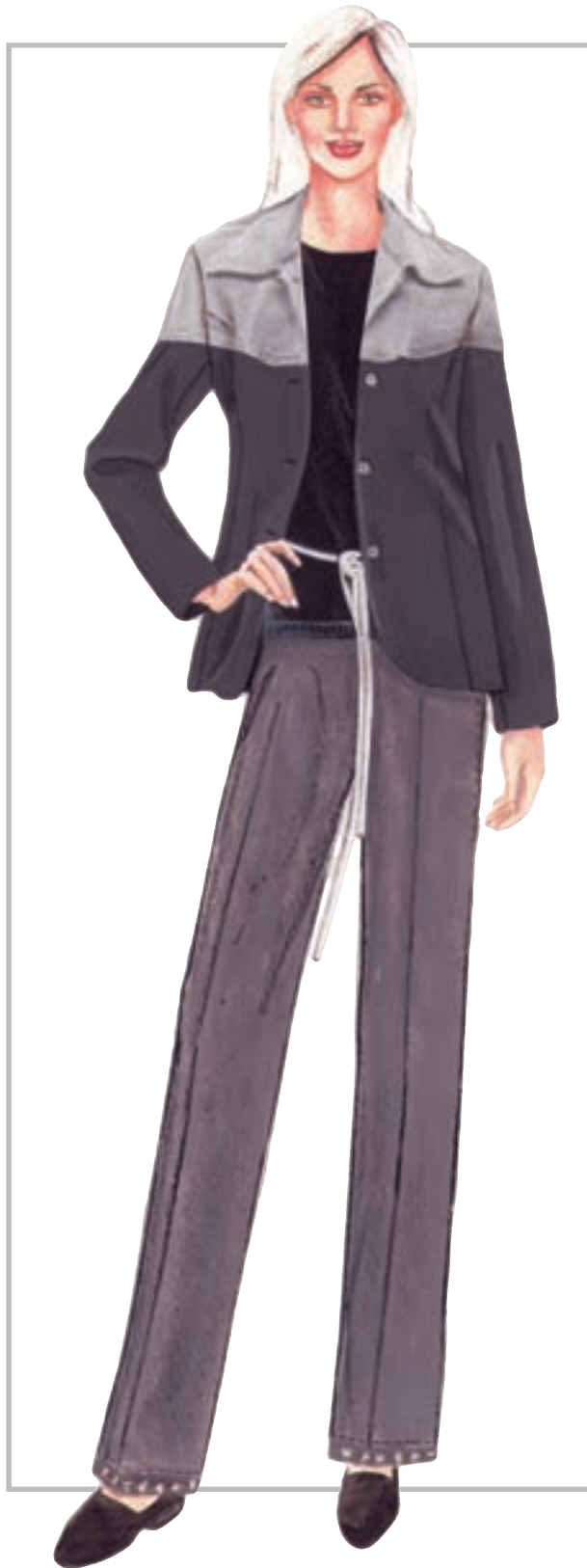
تصویر ۱-۵۲ - ترکیب بندی بر اساس رنگ های بی فام