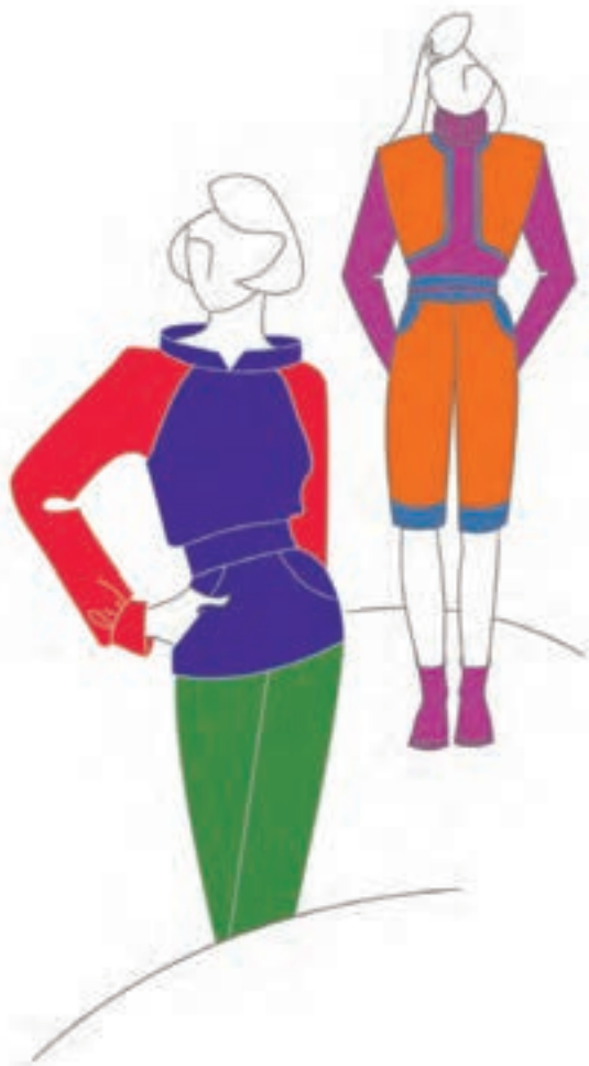
تصویر ۲-۳ - رنگ بندی مناسب لباس دخترانه

● رنگ های مناسب لباس دخترانه (نوجوان و جوان): رنگ بندی این گونه لباس ها فضایی گرم، پرشور و متنوع را طلب می کند مانند انواع زرد، قرمز، نارنجی و بنفش که بیشتر در مجاورت مکمل رنگی شان به کار برده می شوند (تصویر ۲-۳). برای مثال: همجواری قرمز بنفش در مجاورت سبز زرد