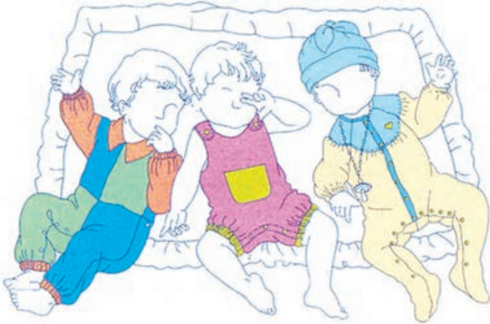
تصویر ۱-۲ - رنگ بندی مناسب لباس نوزاد

بی شک رنگ آمیزی لباس، می تواند متناسب با موقعیت و مناسبت های مختلف تغییر نماید. طراح لباس با شناخت مواردی از جمله گروه سنی، جنسیت فرد، موقعیت های اجتماعی و فرهنگی و مشاغل، به انتخاب رنگ و یا به رنگ بندی طرح لباس اقدام می کند. دسته بندی کلی در جهت بیان رنگ به شرح زیر است: - دسته بندی رنگی بر اساس گروه سنی و جنسیت فرد - دسته بندی رنگی بر اساس موقعیت های شغلی و نوع فعالیت