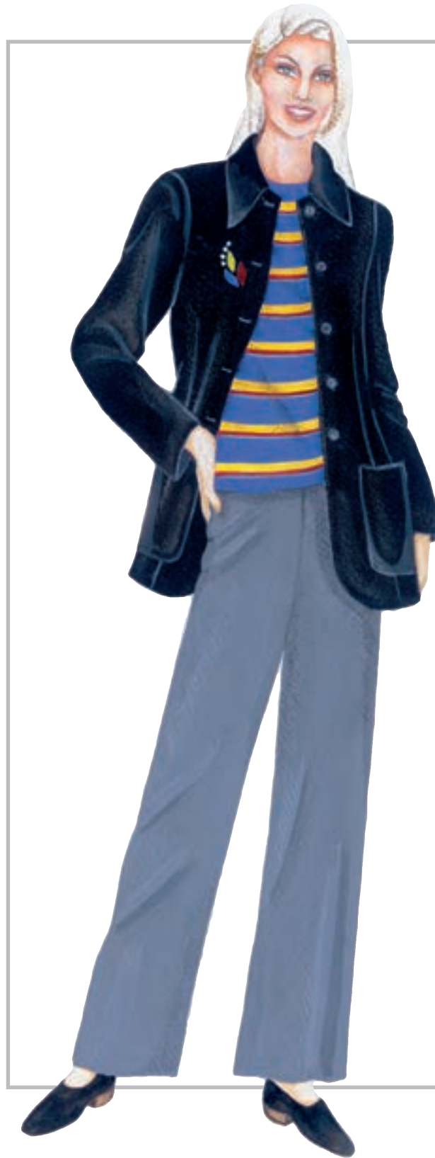
تصویر ۱-۵۴ — ترکیب بندی بر اساس رنگ های بی فام و فام دار