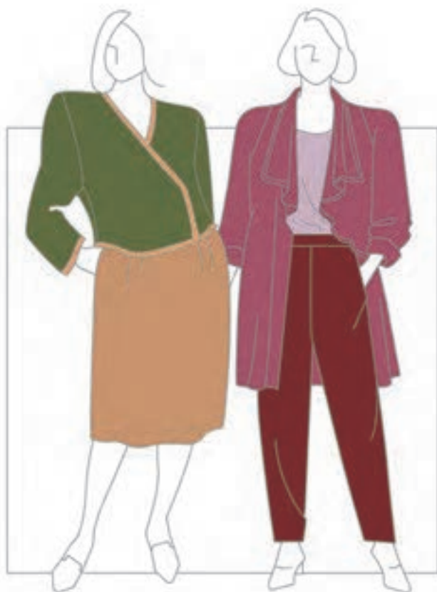
تصویر ۲-۵ - رنگ بندی مناسب لباس زنانه

● رنگ های مناسب لباس مردانه : رنگ بندی این گونه