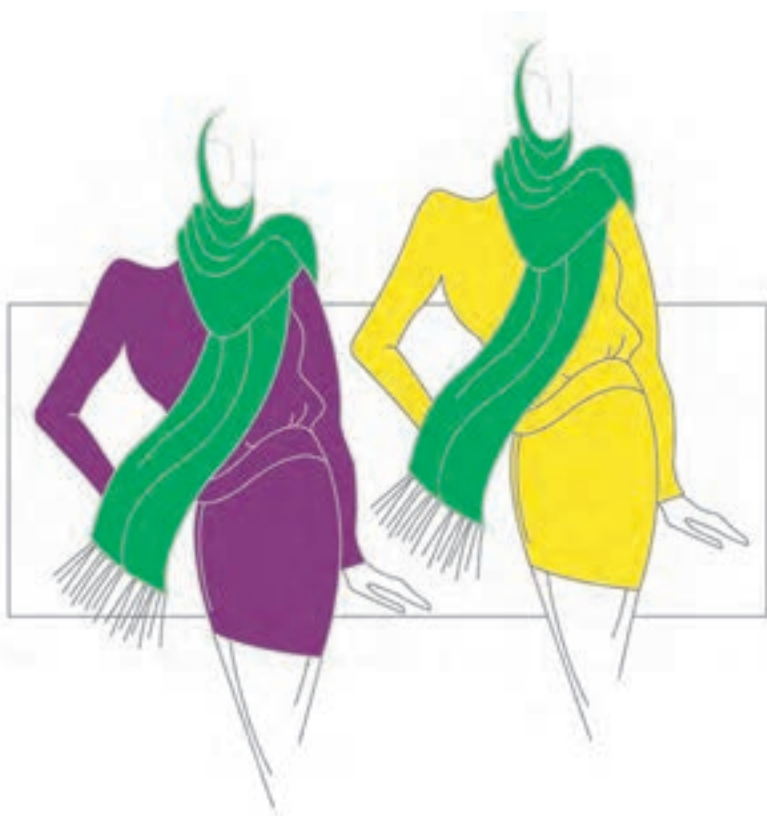
تصویر ۱-۴۷ - تغییر درجه‌ی تاریکی و روشنی و تأثیر متقابل رنگ‌ها