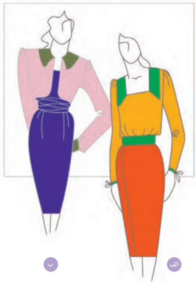
تصویر ۱-۵۵ - الف - ترکیب بندی بر اساس رنگ های اشباع

* ترکیب بندی رنگ های اشباع و غیر اشباع (تصویر ۱-۵۶).