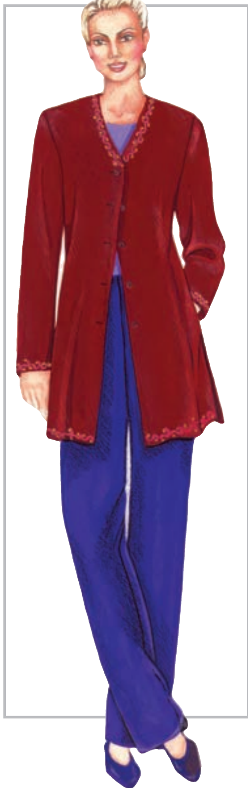
تصویر ۱-۶۰ - ترکیب بندی بر اساس رنگ های سرد و گرم

* ترکیب بندی رنگ های سرد و گرم (تصویر ۱-۶۰).