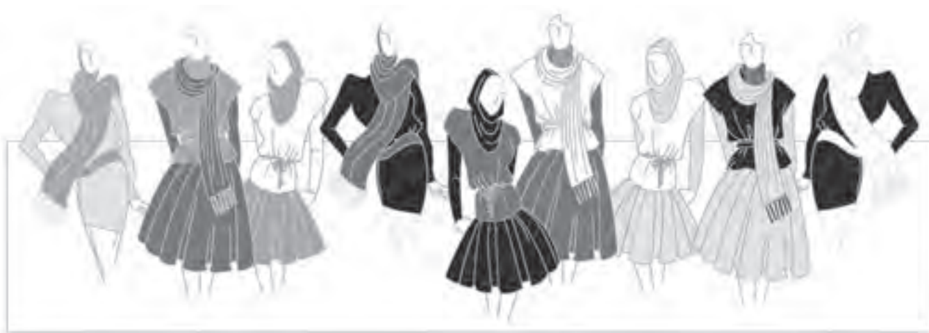
تصویر ۱-۵۱ - ترکیب بندی بر اساس رنگ های بی فام