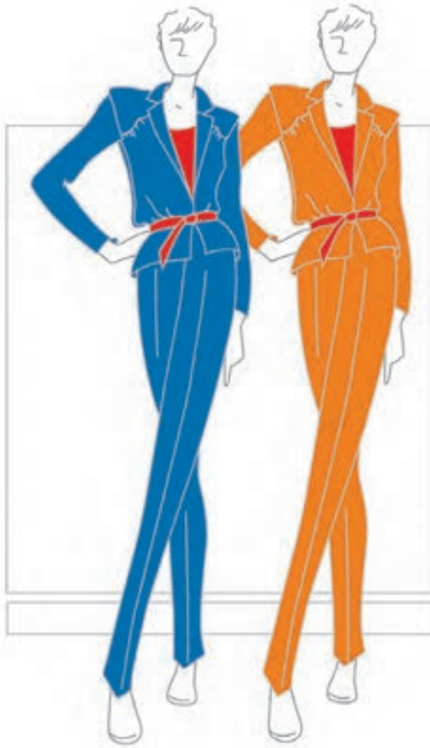
تصویر ۱-۴۵-ب - تغییر درجه‌ی ارزش‌های رنگی

در مجاورت‌های رنگی، رنگ‌ها بر درجات ارزش‌های رنگی یکدیگر تأثیر می‌گذارند. به‌طور مثال، رنگ قرمز در مجاورت و یا بر روی زمینه‌ی نارنجی، شفافیت کمتری می‌یابد، حال آن‌که همان رنگ، در مجاورت و یا بر روی زمینه‌ی آبی، گرم‌تر و شفاف‌تر ظاهر می‌گردد (تصویر ۱-۴۵-ب).