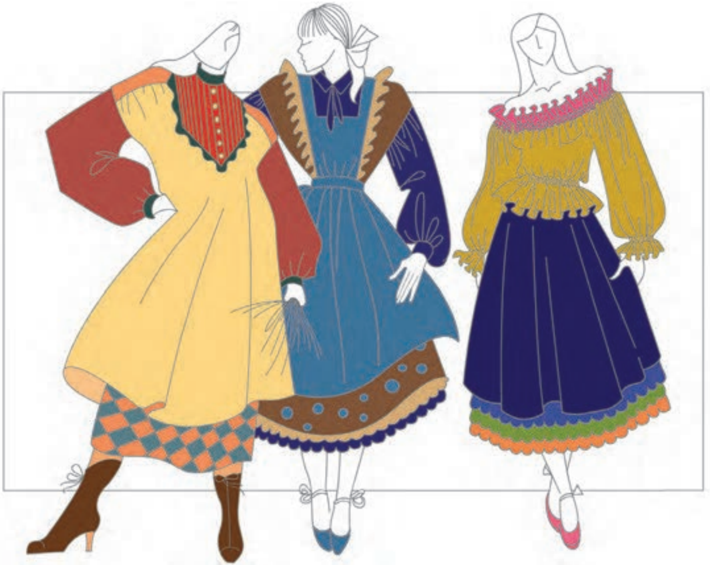
تصویر ۲-۷ - رنگ بندی های تزئینی و سنتی