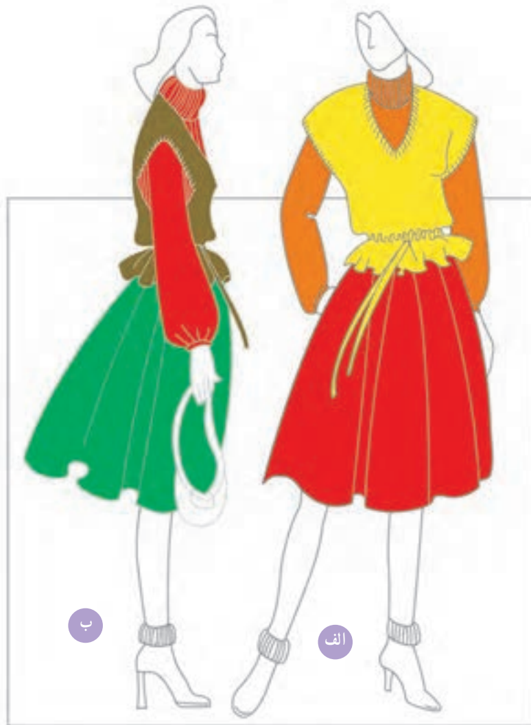
ب -- استفاده از ترکیب میان‌های رنگی غیر همجوار در ساخت رنگ میانی

❖ میان‌های رنگی دو رنگ همجوار در چرخه‌ی رنگ ایتمن: این گروه از انواع رنگ‌های میانی، رنگ‌هایی هستند