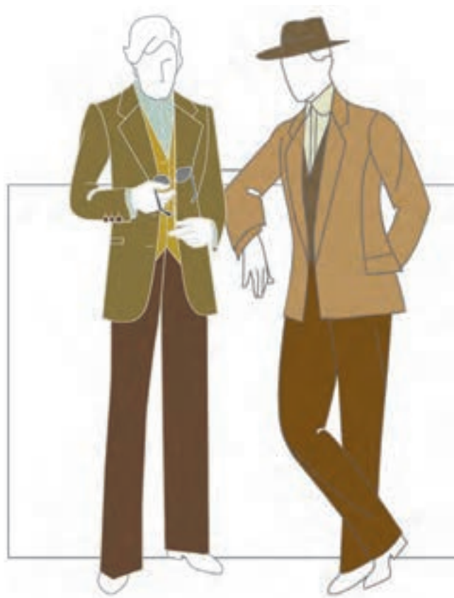
تصویر ۲-۶ - رنگ بندی مناسب لباس مردانه

سنگین و موقر ایجاد می نمایند که مناسب رنگ آمیزی لباس های میان سالان و کهن سالان می باشد (تصویر ۲-۶).