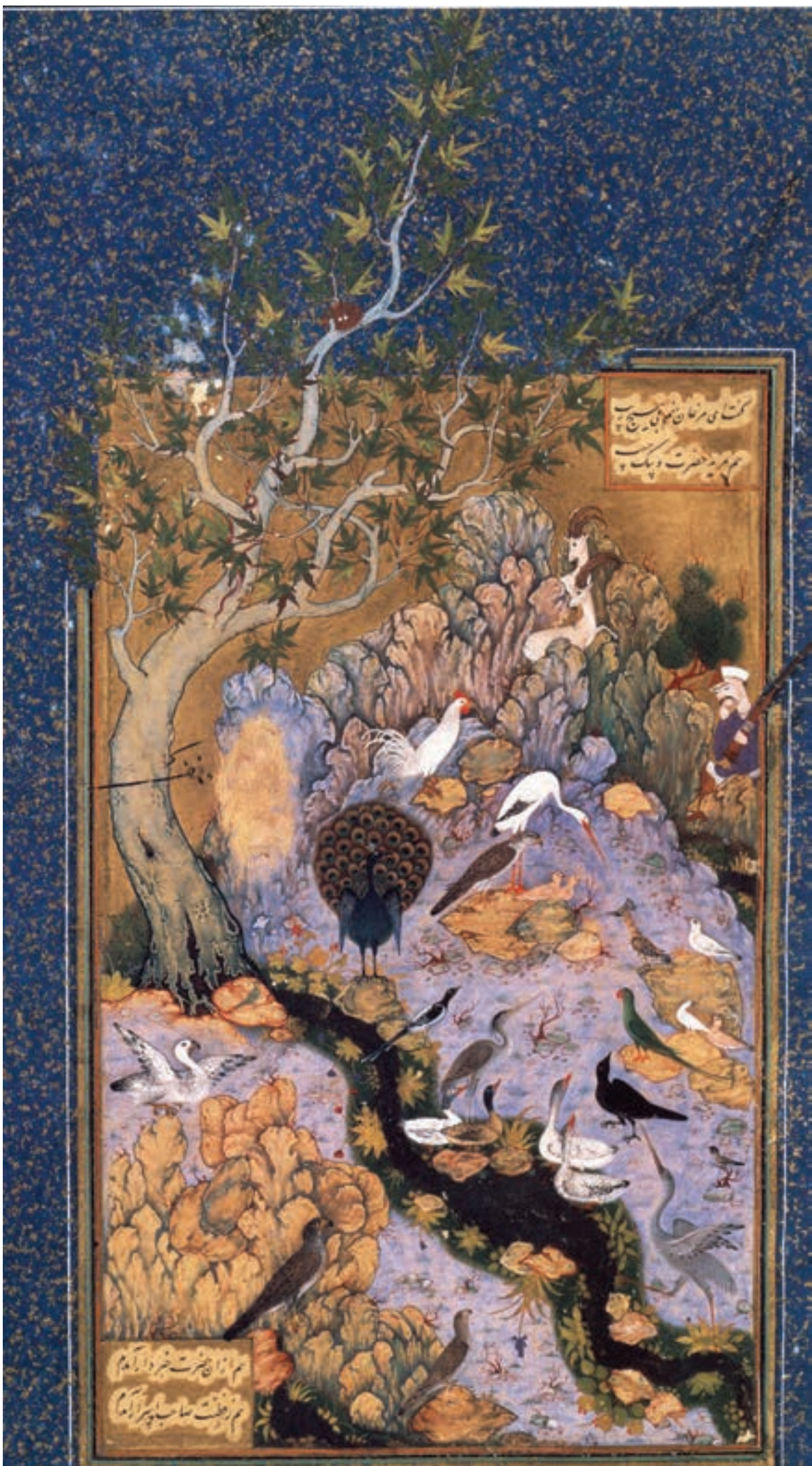
تصویر ۷- تجمع پرندگان قبل از همد، منطق الطیر عطار، مکتب اصفهان، قرن دهم هجری، موزه متروپولیتن