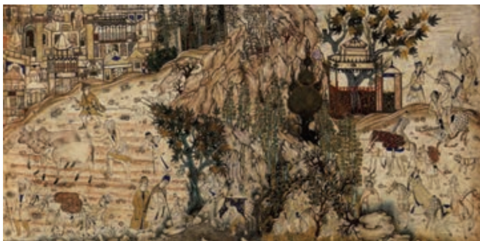
تصویر ۱-۳۱- کار در مزرعه با دورنمای شهر، اثر محمدی، مکتب قزوین، قرن دهم و یازدهم هجری، موزه توپکاپی استانبول

حرکات، طبیعی‌تر گشت و کم‌کم نوعی طبیعت‌گرایی که در مکاتب بعدی با شدت بیش‌تری بروز کرد، در این دوره دیده شد، در آثار نقاشی مکتب قزوین توجه به موضوعات درباری و جنگ و جدال کم‌تر شد و هنرمندان به موضوع‌های عمومی و زندگانی روستایی پرداختند. در این تصاویر، از عمامه‌های دوازده ترکی با میله‌ی قرمز اثری نیست، اغلب تصاویر در کتب به صورت جفتی اجرا شده و معمولاً دو تصویر با یک کادر به تصویر درآمده است. در این دوره مجدداً نقاشی دیواری آغاز گردید و ما شاهد آثار بسیار زیبایی در کاخ قزوین هستیم (تصاویر ۱-۳۱ و ۱-۳۲).