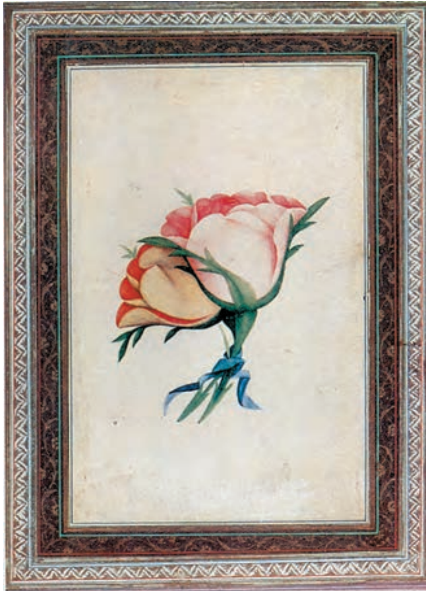
تصویر ۱-۴۴- دو گل با نوار آبی، مکتب شیراز، قرن دوازدهم و سیزدهم هجری

کردند که مکتب شیراز دوران زندیه را به‌وجود آوردند. در این دوره، عده‌ای از هنرمندان به تصویرسازی گل‌ها و گیاهان که با الهام از شیوه اروپایی نقاشی می‌شد، علاقه نشان دادند. آغازگر این شیوه، شفیع عباسی پسر رضاعباسی بود. شیوه‌ی گل و