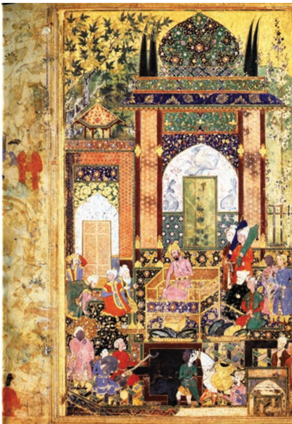
تصویر ۳۰-۱- بابرشاه بر تخت، بابرنامه، اثر فرخی‌بیگ، قرن دهم هجری، واشنگتن

در دوران سلطنت شاه طهماسب، همایون پادشاه هند از سلطنت خلع شد و برای دریافت کمک به دربار ایران پناهنده گردید. او وقتی که از تبریز دیدن کرد و در دربار پادشاه با کار هنرمندان ایرانی آشنایی یافت پس از بازگشت به سلطنت در هند با اجازه‌ی شاه طهماسب دو هنرمند عصر، یعنی عبدالصمد و میرسیدعلی، شاگردان بهزاد را با خود به هند برد. عبدالصمد که