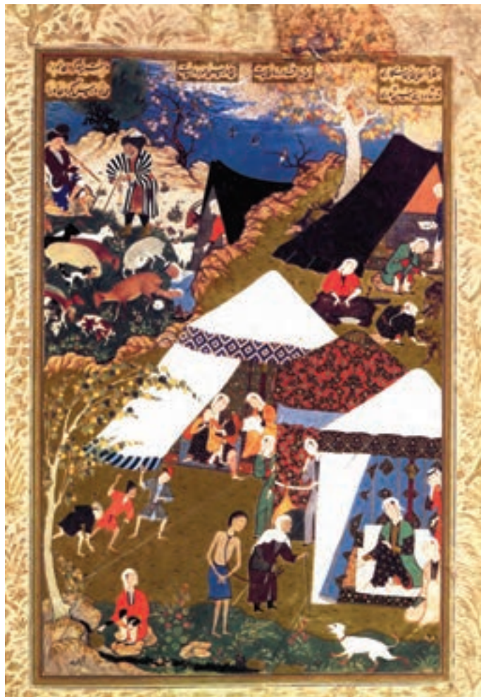
تصویر ۱-۲۳- مجنون در زنجیر، خمسه نظامی، اثر میر سید علی، قرن دهم هجری، کتابخانه بریتانیا

کرده باشد. شیوهی نقاشی بهزاد، پس از او دنبال شد و شاگردان او به اشاعه‌ی تحولات کارهای استاد همت گماشتند (تصاویر ۱-۲۲ و ۱-۲۳).