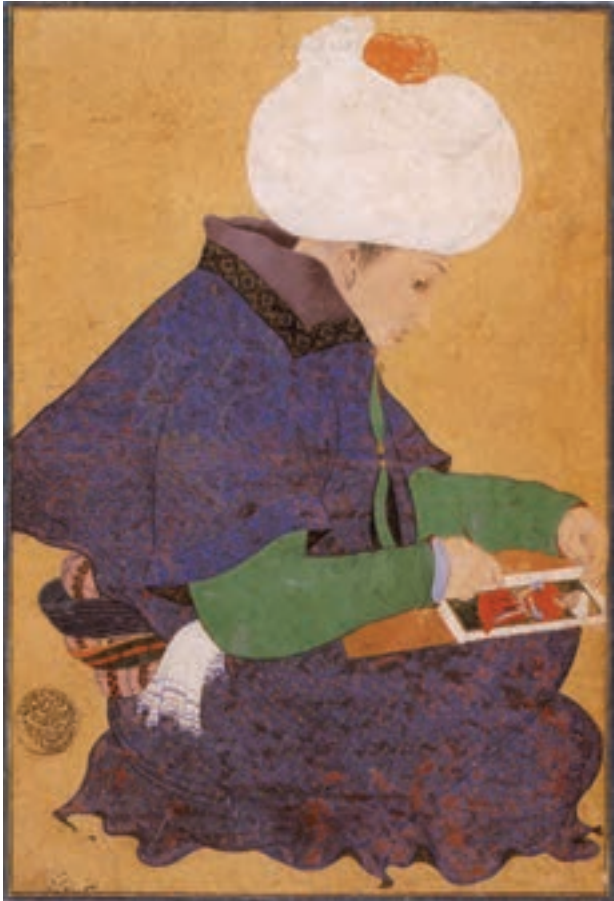
تصویر ۲۵-۱- چهره یک هنرمند، اثر بهزاد، تقلید از روی اثر بلینی (۷سال بعد) قرن نهم هجری و اشنگتن

آثار بهزاد تأثیر پذیرفته بود. تداوم نقاشی‌های بهزاد همراه با خصوصیات نقاشی محلی بخارا، مجموعاً خصوصیات نقاشی بخارا را به وجود آوردند. خصوصیات از قبیل غنی بودن و خلوص رنگ‌ها که بیش‌تر به کارگیری جزئیات و استفاده از شکل‌های ساده، پیکره‌های کوتاه قد و ساختمان‌ها از روبه‌رو را شامل می‌شد. نقاشی‌های مکتب بخارا اغلب جدا از متن کتاب تهیه می‌شدند و سپس به کتاب الحاق می‌گردیدند. معمولاً زمینه‌ی حاشیه‌های این تصاویر را با تشعیر پر می‌کردند ۱ (تصاویر ۲۶-۱ و ۲۷-۱).