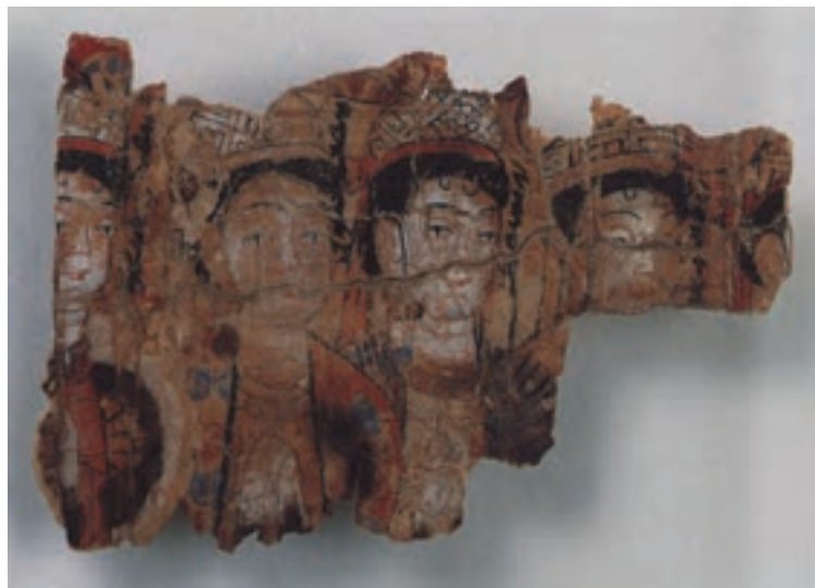
تصویر ۴-۱- چهار زن، تصویرسازی روی کاغذ، تورفان غرب ترکستان چین، قرن اول و دوم هجری، موزه برلین

بنابر اعتقاد مانویان، هرچه زیباست قابل پرستش نیز هست و این همان موضوعی است که باعث شد تا نگارگری ایرانی دارای جنبه‌های تزئینی بیش‌تری گردد. وظیفه‌ی هنر نقاشی در دوران مانویان این بود که توجه را به عالم بالاتر جلب نماید و عشق و ستایش را به سوی فرزندان نور متوجه سازد و نسبت به زاده‌های تاریکی ایجاد نفرت نماید، به همین دلیل، «تذهیب» در کتاب‌های مذهبی مانویان رواج بسیار یافت. در حقیقت تذهیب، صحنه‌ای از نمایش آزاد کردن نور و روشنایی به حساب می‌آید. مانویان برای نمایش نور در آثار خود از فلزات گرانبها چون طلا و نقره استفاده می‌کردند. به کار بردن فلزات گرانبهایی چون طلای زرد، سفید و نقره که به فراوانی در نقاشی‌های ایرانی و همچنین در تذهیب‌های اسلامی متداول گردید ادامه مستقیم سنت هنر مانویان است (تصویر ۴-۱).