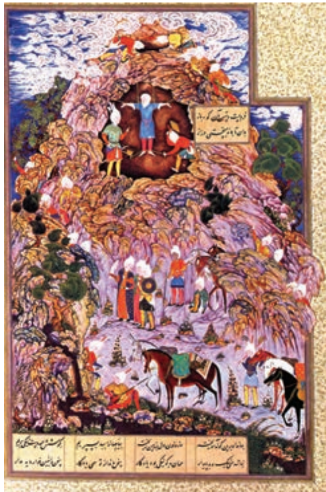
تصویر ۱-۲۲- مرگ ضحاک، شاهنامه، اثر سلطان محمد، قرن نهم هجری، موزه بریتانیا

در آثار بهزاد از عناصر نقاشی چینی یا بیزانس کم‌تر اثری می‌توان یافت. او حتی از به کار بردن نقش ابر در نقاشی‌های خود دوری می‌جست تا حتی الامکان از عناصر نقاشی چینی پرهیز