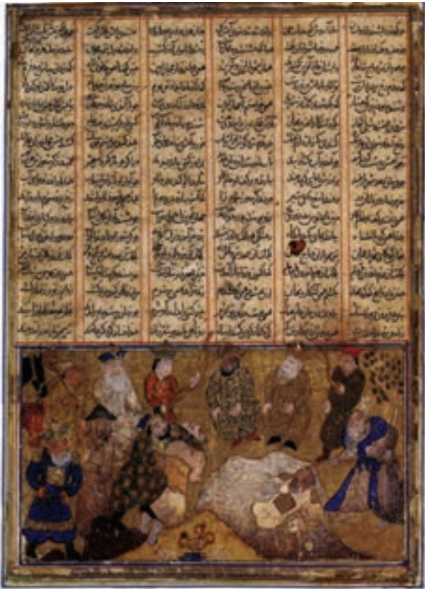
تصویر ۶-۱- افراسیاب، آبرنگ، مرکب و طلا روی کاغذ، شاهنامه، مکتب بغداد، اواخر قرن ششم هجری، مجموعه خصوصی

هنرمندان ایرانی در این دوره، کتاب‌هایی را مصور می‌کردند که موضوعاتی چون شرح حال شاهان ایرانی، دیوان‌های شعر، اخلاقیات، طب و علوم را دربر می‌گرفت. از آن جمله می‌توان به شاهنامه‌ی فردوسی اشاره کرد. (شاهنامه فردوسی بیش‌ترین آثار نقاشی و تصویرگری را در دوران‌های مختلف به خود اختصاص داده است) (تصویر ۶-۱).