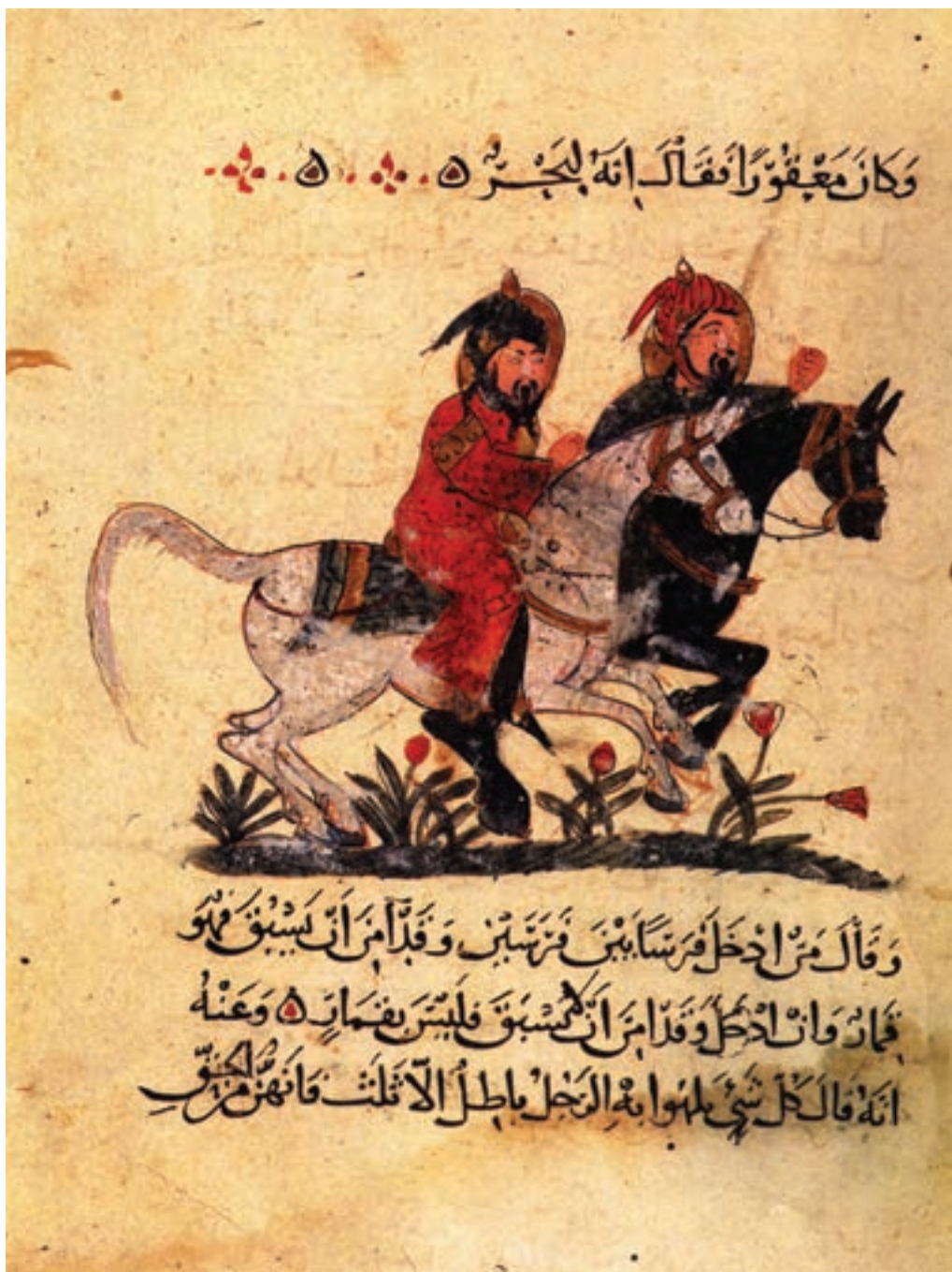
تصویر ۱-۷- دو سوارکار، کتاب البیطار (نگهداری چهارپایان)، نقاش احمد بن احنف، مکتب بغداد، قرن ششم هجری موزه توپکاپی استانبول

مکتب بغداد با وجود داشتن این نام، هرگز یک مکتب عربی خالص نیست، چرا که بسیاری از کتب خطی مصور شده در این دوره، در مراکز دیگر که تحت تسلط سلجوقیان بوده مصور شده است. ولی براساس آنچه درباره‌ی نام مکاتب گفته شد و بر طبق مرکزیت اصلی بغداد، این گونه نقاشی‌ها را تحت عنوان کلی «مکتب بغداد» نام نهادند. ویژگی‌های مهم نقاشی‌های این دوره که نمونه‌های آن بر روی کتب خطی انجام شده جزئی از متن کتاب