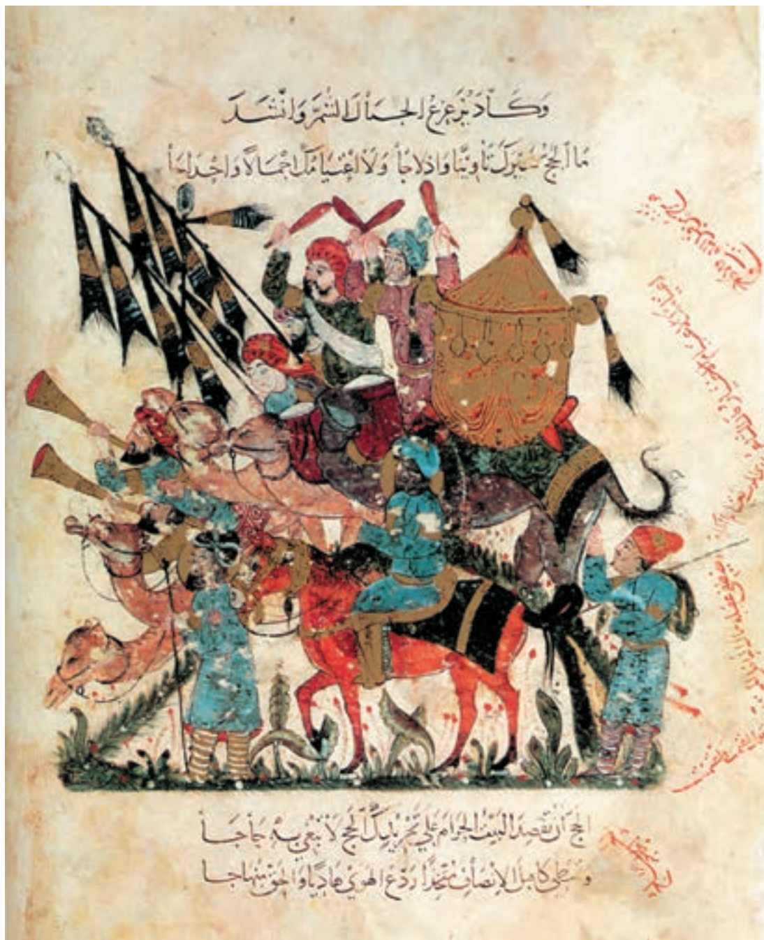
تصویر ۸-۱- کاروان حجاج، مقامات حریری، نقاش یحیی بن واسطی، مکتب بغداد، اواخر قرن ششم، کتابخانه ملی پاریس

وجه تمایز آثار مکتب بغداد و آثاری که در مراکز مختلف تحت تسلط سلجوقیان به وجود آمده در این است که چهره‌های تصاویر مراکز مختلف سلجوقیان به آثار مانویان و ساسانیان بیش‌تر شبیه‌اند. این چهره‌ها، با لباس‌های رنگارنگ همراه با تزیینات گل و برگ و نقوش هندسی و غیر هندسی بوده و شخصیت‌ها دارای گیسوان بلند بافته شده و با کلاه‌های شبیه به نیم‌تاج، مصور شده‌اند. شاید یکی از زیباترین تصاویری که در مکتب بغداد به تصویر