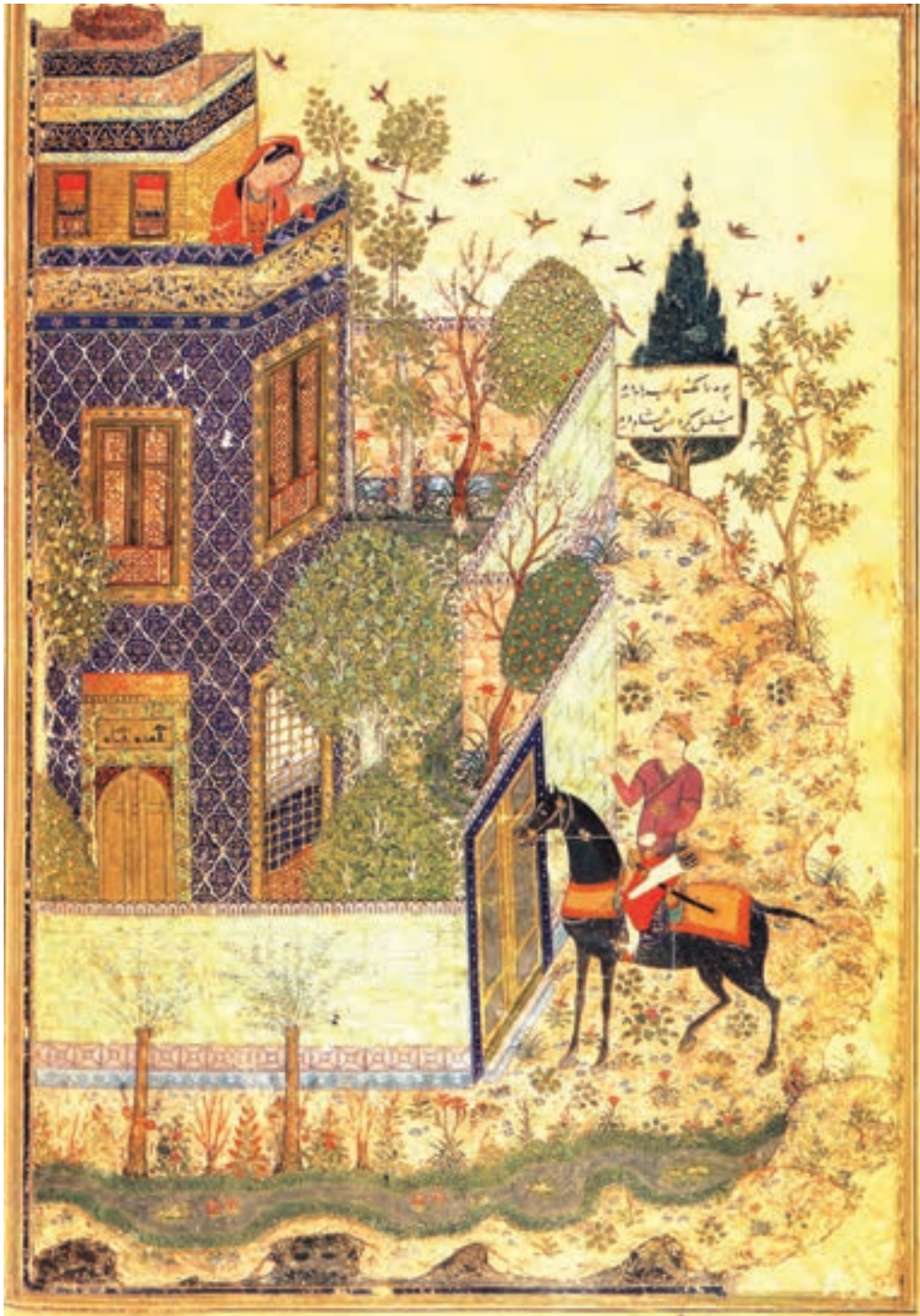
تصویر ۱۲-۱- همای و همایون، اثر جنید، مکتب جلایریان، کتاب خمسه‌ی خواجوی کرمانی، قرن هشتم هجری، موزه بریتانیا

عناصر را با ذوق خلاق ایرانی درهم آمیخته و اثری از نفوذ عوامل بیگانه در آن دیده نمی‌شود (تصویر ۱۳-۱).