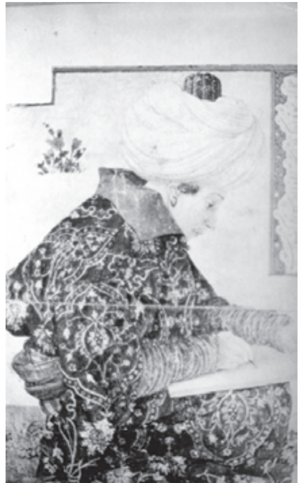
تصویر ۲۴-۱- چهره یک هنرمند، اثر جنتیل بلینی، در دربار عثمانی، قرن نهم هجری

آثار بهزاد تأثیر پذیرفته بود. تداوم نقاشی‌های بهزاد همراه با خصوصیات نقاشی محلی بخارا، مجموعاً خصوصیات نقاشی بخارا را به وجود آوردند. خصوصیات از قبیل غنی بودن و خلوص رنگ‌ها که بیش‌تر به کارگیری جزئیات و استفاده از شکل‌های ساده، پیکره‌های کوتاه قد و ساختمان‌ها از روبه‌رو را شامل می‌شد. نقاشی‌های مکتب بخارا اغلب جدا از متن کتاب تهیه می‌شدند و سپس به کتاب الحاق می‌گردیدند. معمولاً زمینه‌ی حاشیه‌های این تصاویر را با تشعیر پر می‌کردند ۱ (تصاویر ۲۶-۱ و ۲۷-۱).