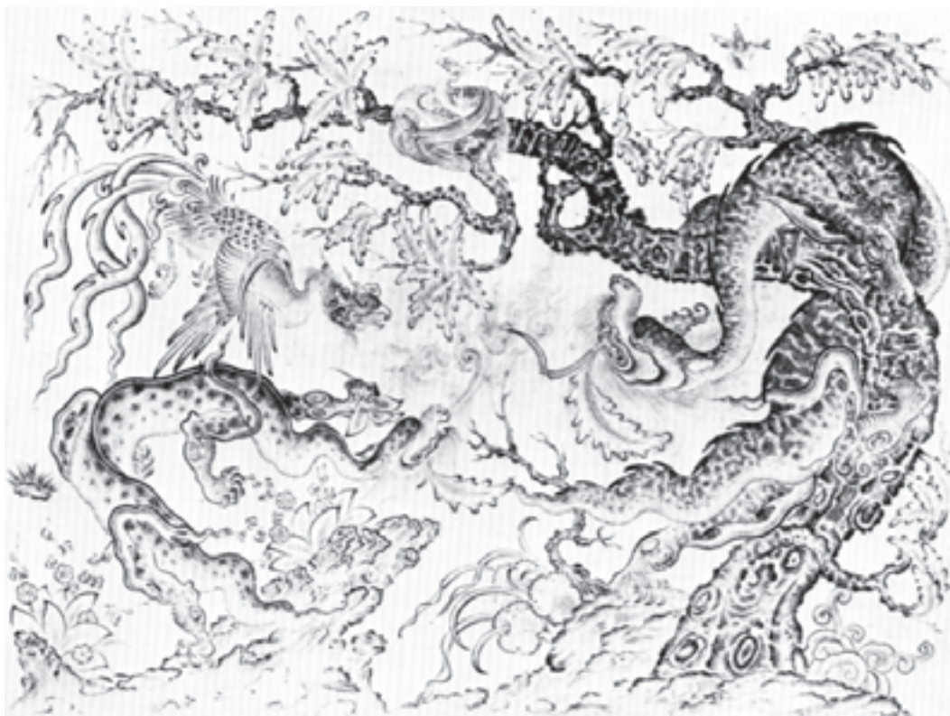
تصویر ۱۰-۱- ازدها و سیمرخ، طراحی به شیوه قلم‌گیری، مدرسه ترکمان (قره‌قویانلو) اوایل قرن هشتم هجری، کتابخانه موزه‌ی استانبول

عناصر تازه را در میان تار و پود هنر نقاشی ایرانی مشخص کرد. در این دوره نیز عناصر نقاشی چینی مانند ابرهای غیر مشخص جای خود را به طرح‌های منظم و شبیه تاج گل داد و برگ‌های ظریف و دقیق، جای مناظر محو شده را گرفت. کوه‌ها و صخره‌های نقاشی مکتب یوان ۱ در چین که حالت برندگی و تیزی داشت با حالتی مواج‌تر به شیوه‌ی ایرانی طراحی گردید و آثار تک رنگ (منوکرَم) جای خود را به نقاشی‌های با رنگ‌های زنده و درخشان بخشید. (تصویر ۱۰-۱) حتی گاهی هنرمندان ایرانی زمینه‌ی خالی نقاشی‌های خود را با استفاده از گل و گیاه پر کردند تا خود را از تقلید نقش ابرها و کوه‌های چینی رها کنند.