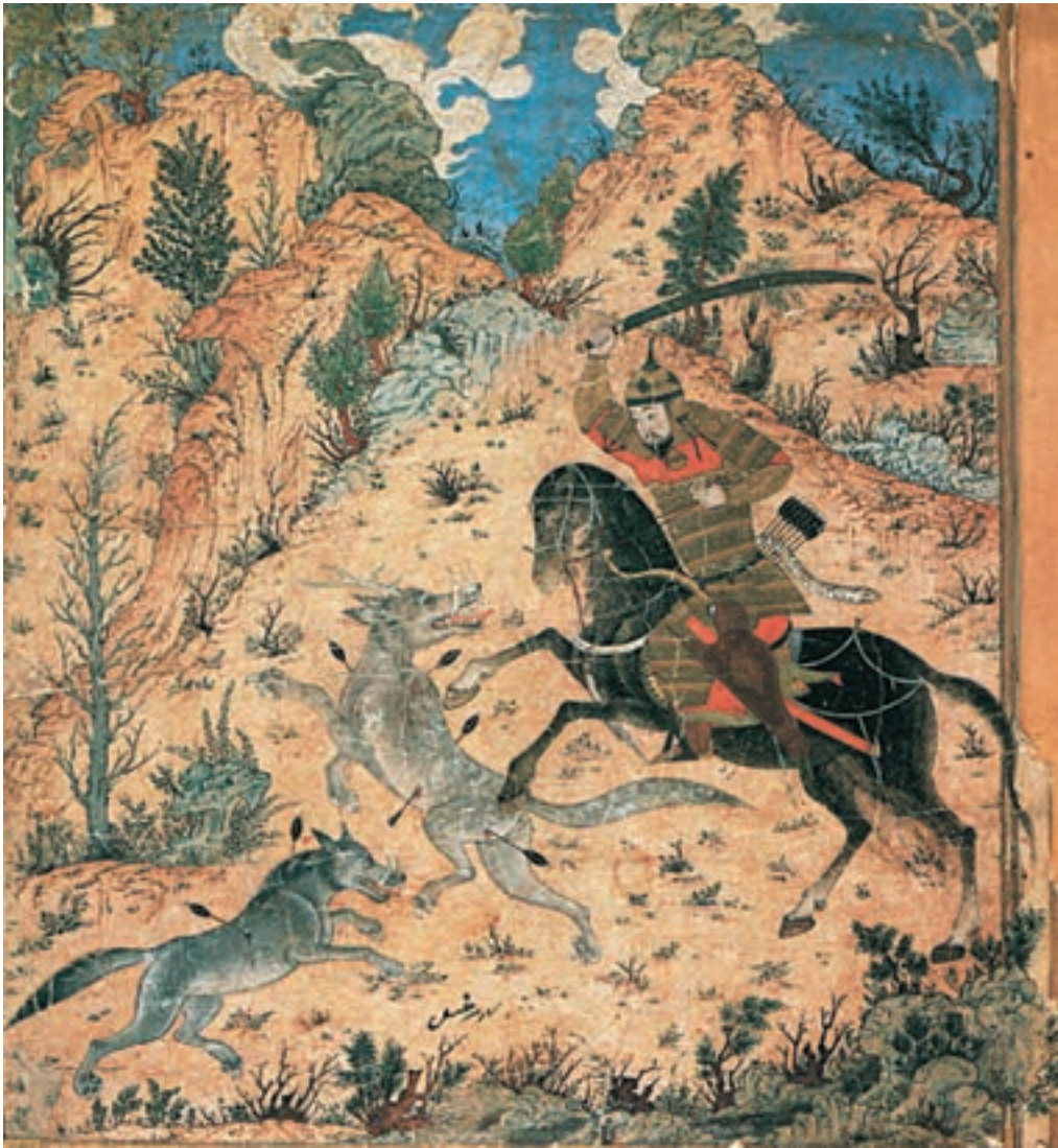
تصویر ۱۵-۱- خوان اول اسفندیار و کشتن گرگ‌ها، شاهنامه، مکتب تبریز، اواخر قرن هشتم هجری، موزه توپکاپی استانبول