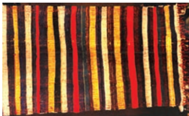
تصویر ۵-۲ - پلاس و دیتیل آن