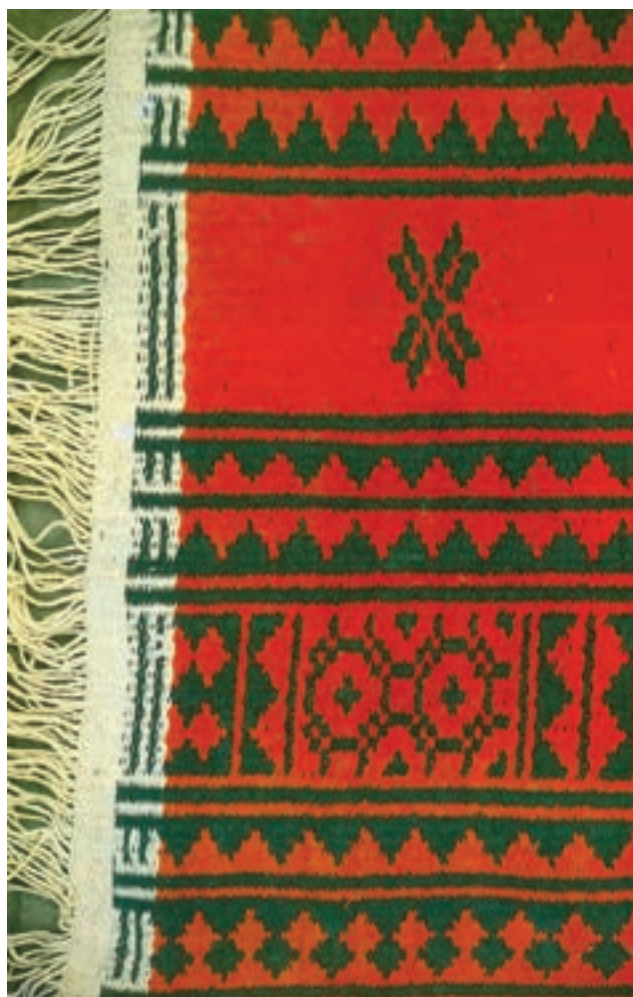
تصویر ۴-۲ - زیلوی میبد

زیلو: زیلو دست‌بافته‌ای است که با استفاده از تار و پود پنبه‌ای بر دارهای عمودی تولید می‌گردد. بافت این زیرانداز تابستانی در روستاها متداول است. زیلو نسبت به سایر دست‌بافته‌ها ضخیم و زمخت می‌باشد. این دست‌بافته دو رویه است و نقش یک طرف آن با طرف دیگر تفاوت دارد. پلاس ۱ : در بافت پلاس نیز، مانند بافت زیلو، از تار و پود پنبه‌ای استفاده می‌شود. با این تفاوت که در بافت پلاس از نخ‌های رویه‌ای نامرغوب و پست استفاده می‌شود. پلاس بافته‌ای دو رویه، معمولاً بدون نقش و ضخیم و درشت می‌باشد.