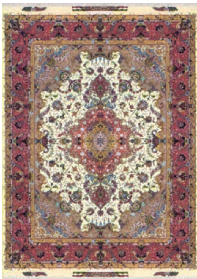
تصویر ۲۰-۲- قالی بافت تبریز