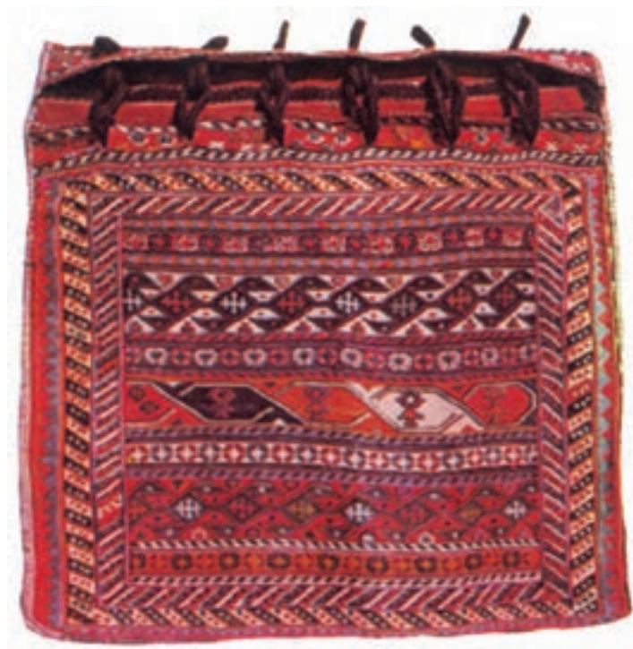
تصویر ۱۲-۲- خورجین از جوال کوچک تر است و در حمل اشیا استفاده می گردد.