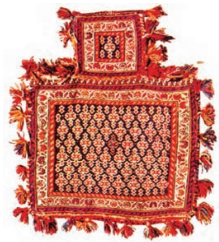
تصویر ۱۷-۲- نمکدان جهت حمل نمک یا ذخیره‌ی آن مورد استفاده قرار می‌گیرد.