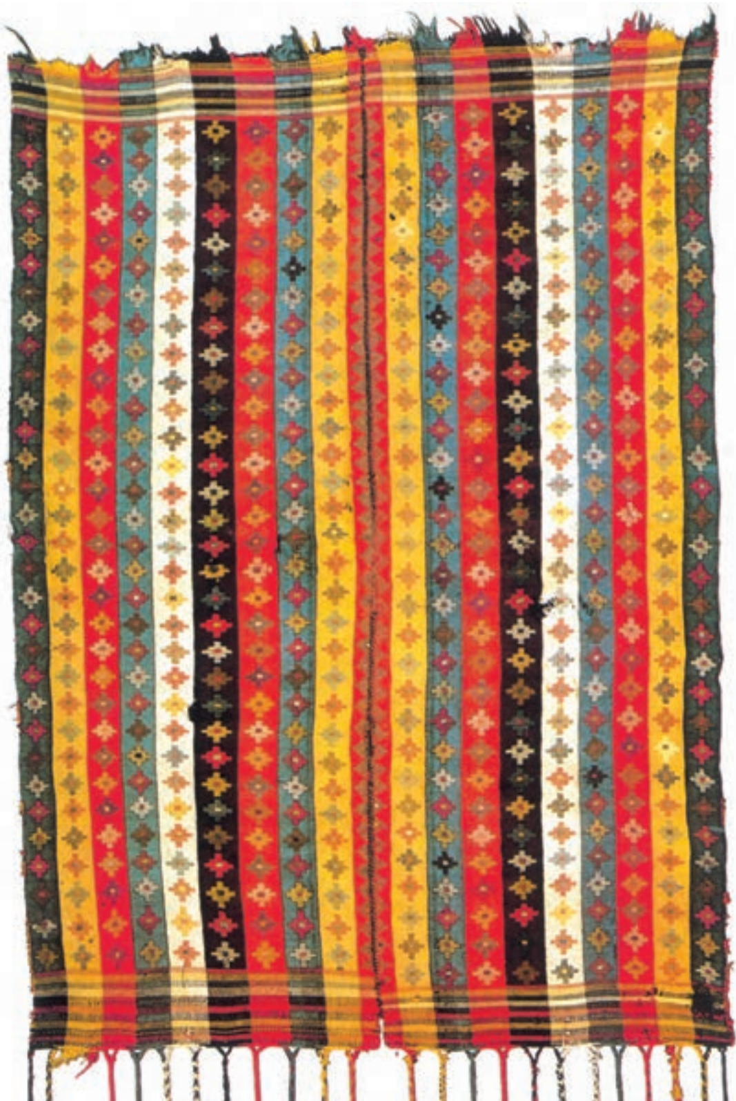
تصویر ۲-۲- جاجیم بافت ایل قشقایی (فارس)