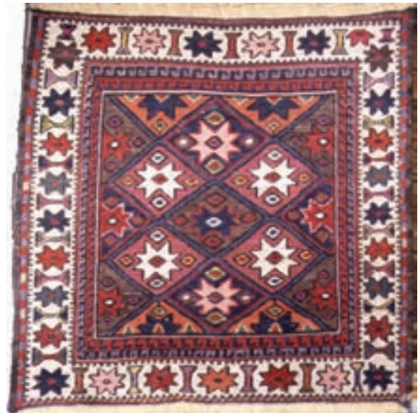
تصویر ۷-۲- ورنی، بافت ایلات شاهسون