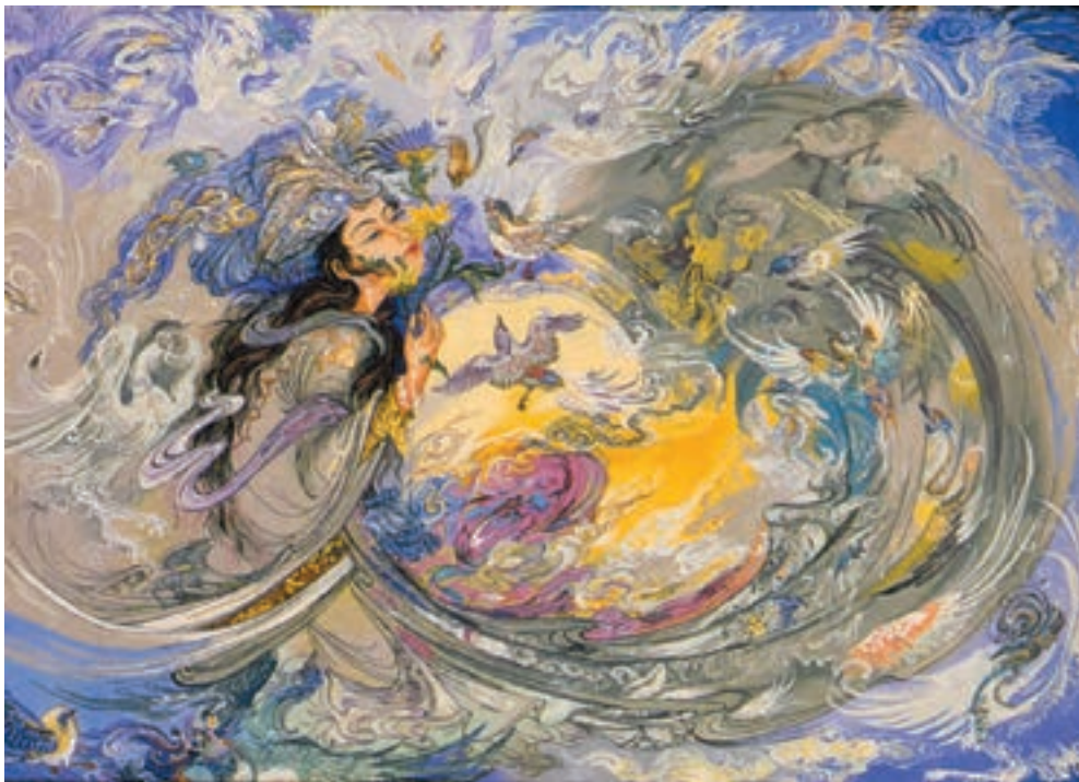
تصویر ۱۹-۲- تصویری از فرش‌های هنری

در بافت قالی روش‌های متنوعی به کار گرفته می‌شود. در بافت قالی‌های تصویری به کارگیری رنگ‌های متعدد و ترکیب آن‌ها با یکدیگر و همچنین تغییراتی که در گره‌ها ایجاد می‌گردد دارای اهمیت بسیار است و به مهارت زیاد نیاز دارد. در بافت قالی‌های دو رویه نیز مهارت بسیاری لازم است. همچنین در برخی بافته‌ها با به کارگیری نخ‌های طلایی و نقره‌ای در متن بافته، نقوش را برجسته می‌بافند (صوف) قالی بافی در میان شهرها و روستاها و ایلات و عشایر بسیار گسترش و رواج دارد.