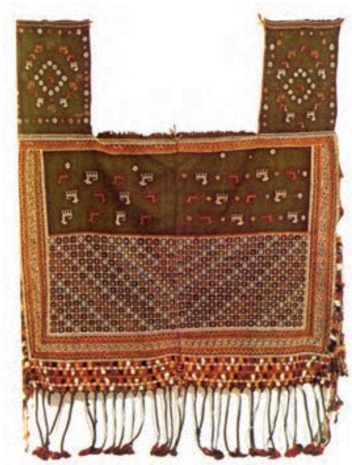
تصویر ۱۰-۲- جل اسب سوزنی قشقایی