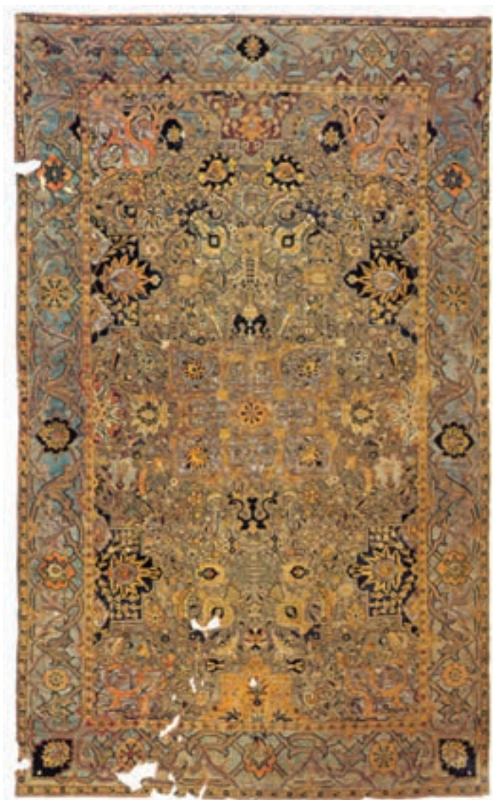
تصویر ۲۱-۲- قالی صوف بازمانده از قرن ۱۱ هجری، که در بافت آن از ابریشم و طلا و نقره استفاده شده است. محل نگهداری - موزه ملی ایران