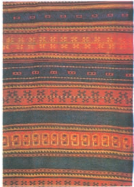
تصویر ۸-۱- نقشی از گلیم کردهای خراسان