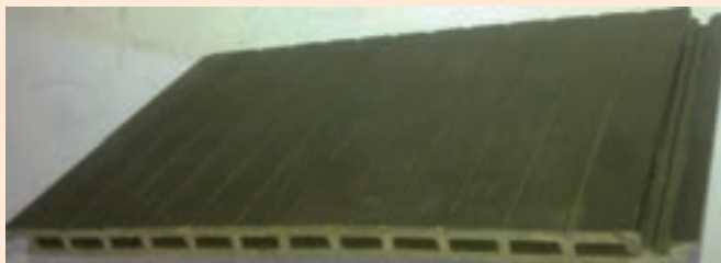
شکل ۱۱-۱۱- دیوارکوب ساخته شده از چوب پلاستیک