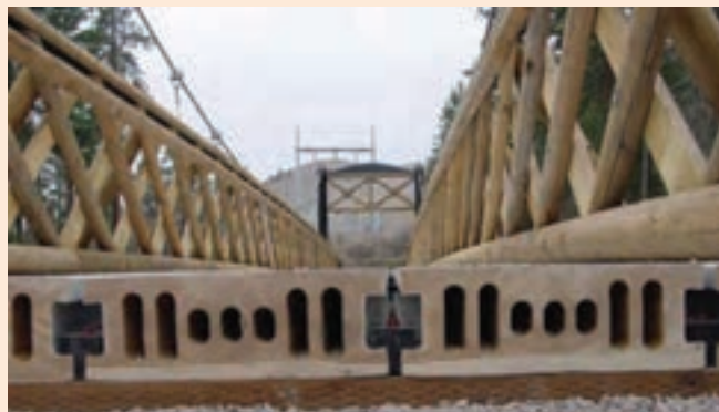
شکل ۱۱-۱۲- استفاده از چوب پلاستیک در کف پوش پل