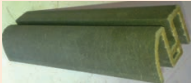
شکل ۱۱-۱۰- پروفیل ساخته شده از چوب پلاستیک

فرآورده‌های چوب پلاستیک (wpe) حاصل از ترکیب ذرات چوب با انواع مواد پلیمری هستند. این فرآورده مقاومت زیادی نسبت به رطوبت و سایش داشته و جهت کاربردهایی مانند کف پوش، پالت و ... مناسب می‌باشند.