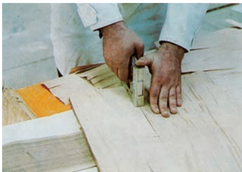
شکل ۱۲-۵- نحوه‌ی استفاده از دستگاه دوخت دستی در به هم دوختن روکش‌های درز شده

۲-۳-۵- دوخت روکش به وسیله دستگاه دوخت دستی: روکش‌های جور شده را به وسیله دستگاه دوخت نیز می‌توانید مهار کنید و لبه آن‌ها را به هم بدوزید؛ البته این عمل را روی روکش‌های نامرغوب که برای پشت صفحات کارتان جور کرده اید انجام دهید، زیرا بعد از پرس کاری باید سوزن‌های دوخت