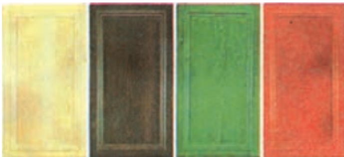
شکل ۲-۵ - درهای قفسه روکش شده با رنگ‌های مختلف