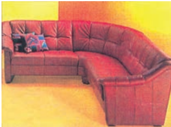
شکل ۳-۳- مورد مصرف چرم طبیعی

چرم برای پوشش رویی مبلمان نشیمن، پوشش کف و پشتی صندلی و غیره به کار می‌رود. چرم‌های مورد مصرف در صنایع چوب را می‌توان به دو دسته تقسیم کرد: ۱-۴-۳- چرم‌های طبیعی: این چرم‌ها را می‌توان از پوست گاو، گوساله، اسب، بز و... از طریق دباغی کردن به دست آورد. چرم‌های طبیعی مورد مصرف در صنایع چوب اغلب از نوع چرم گاوی است که معمولاً به ابعاد 2 \times 3 متر تهیه و به بازار عرضه می‌شود. چرم گاوی ضخیم که معمولاً از پوست گاو میش تهیه می‌شود، به وسیله ماشین‌های برش به دو ورقه‌ی رویی و زیرین تبدیل می‌شود. ورقه‌ی رویی که قسمت مرغوب چرم است و نمایش طبیعی چرم را دارد بدون سوراخ، خراش، تغییر رنگ ناشی از بیماری و غیره است و نیازی به تغییر و اصلاح ندارد. این قسمت به عنوان چرم درجه یک و عالی برای پوشش مبلمان لوکس و گران قیمت استفاده می‌شود (شکل ۳-۳). قسمت‌های زیرین چرم که اشکال نامیده می‌شود، به عنوان چرم درجه ۲ و ۳ و ارزان‌تر از ورقه‌ی رویی چرم به بازار عرضه می‌شود که به مصارف کفش‌سازی، دستکش‌های کار و غیره می‌رسد. چرم‌هایی که به مصارف رویه (روکش) می‌رسند را می‌توان به وسیله‌ی لایه‌ای از رنگ ۱ پوشاند که در این صورت