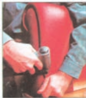
شکل ۳-۵- متصل کردن چرم به بدنه با سوزن‌های دوخت