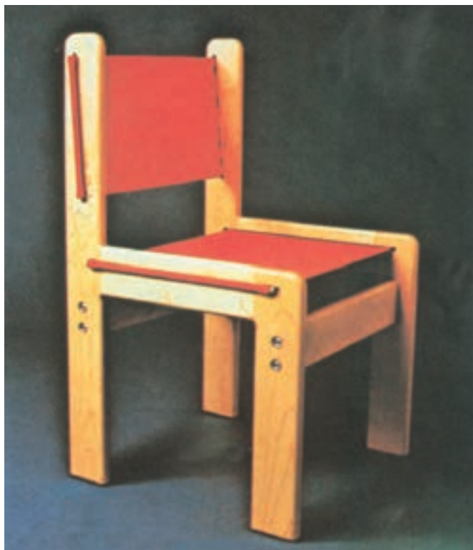
شکل ۳-۲- مورد مصرف پارچه برزنت در محصولات چوبی

۳-۳-۴ پارچه ضخیم یا برزنت: پارچه‌ای است محکم و نخ‌ی که به رنگ‌های مختلفی در بازار وجود دارد و به صورت رُل به فروش می‌رسد، از این پارچه‌ها می‌توان برای ایجاد پشتی و کف صندلی‌های تاشو، راحتی و... استفاده کرد. هم‌چنین می‌توان آن را در کفی انواع مبلی و صندلی به جای فتر مورد استفاده قرار داد (شکل ۳-۲).