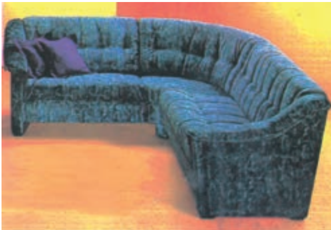
شکل ۱-۳- مورد مصرف پارچه رویه در مبیل‌سازی

۳-۳-۳- پارچه‌های رومبلی (رویه): این پارچه‌ها برای پوشش و تزئین قسمت‌های رویی انواع مبیل‌ها، صندلی‌ها و مواردی نظیر آن به‌کار می‌روند و از نظر ارزش در درجه اول قرار می‌گیرند (شکل ۱-۳).