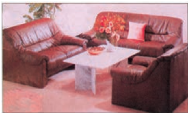
شکل ۳-۴- مورد مصرف چرم مصنوعی

۲-۴-۳- چرم مصنوعی: مواد تشکیل‌دهنده این چرم‌ها ممکن است ضایعات چرم‌های طبیعی و یا مواد شیمیایی باشد. این چرم‌ها به رنگ‌های مختلفی به بازار عرضه می‌شوند و به‌عنوان پوشش انواع مبلمان، پوشش کف و پستی انواع صندلی و غیره می‌توان از آن‌ها استفاده کرد (شکل ۳-۴). چرم مصنوعی به دو صورت، چرم ساده و چرم چروک در بازار یافت می‌شوند که نوع چروک آن برای پوشش انواع مبلمان لوکس استفاده می‌شود. برای جلوگیری از خشک شدن چرم‌ها باید هر چند مدت یک دفعه آن‌ها را روغن (واکس) زد. مورد مصرف چرم‌های مصنوعی، جاهایی است که امکان شستشوی آن وجود دارد. چرم‌ها را می‌توان به‌وسیله سوزن‌های دوخت (میخ‌منگنه) یا میخ‌های بنفش به کلاف مبلمان یا صندلی محکم کرد (شکل ۳-۵).