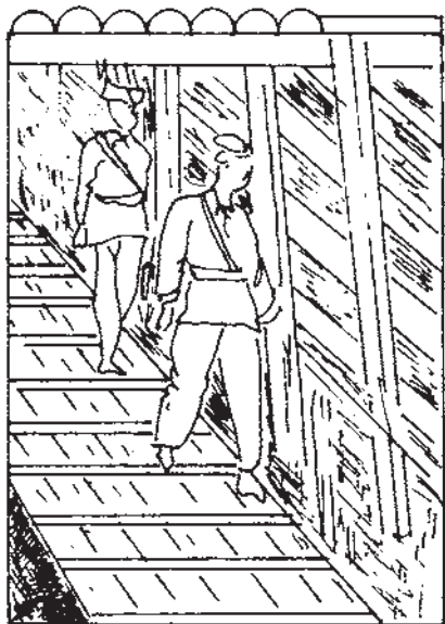
شکل ۶-۱۱- گذرگاه مخصوص کارگران

خواهند بود که در ابتدای نوبت کار، بایستی وارد کارگاه‌ها شده و به فعالیت بپردازند و در پایان نوبت کار از معدن خارج شوند. بنابراین؛ مدتی از وقت یک نوبت کار صرف رفت و آمد می‌شود و در این مدت از راهروها و چاه‌های زیرزمینی برای حمل مواد معدنی نمی‌توان استفاده کرد. برای آن‌که مدت رفت و آمد به حداقل ممکن برسد، از وسایل مکانیکی استفاده می‌کنند و در هر حال رفت و آمد کارگران باید برحسب آئین‌نامه و مقررات خاص حفاظتی صورت گیرد. همچنین، لازم است، تمام کسانی که در معدن زیرزمینی کار می‌کنند هنگام رفت و آمد در راهروها و تونل‌ها، مراقب اطراف و مسیر خود باشند تا به‌طور ناگهانی با مانعی برخورد نکنند و یا در چاله یا گودالی سقوط نکنند. هرچند امروزه، با استفاده از وسایل روشنایی عمومی و انفرادی، مسئله تاریکی در زیرزمین تا حد زیادی حل شده ولی مع‌ذالک، به علت این‌که دیواره‌ها و ماده معدنی، نور را به خود جذب کرده و از انعکاس آن جلوگیری می‌کنند، باز هم روشنایی مطلوب نیست و محدود بودن ابعاد تونل‌ها و کارگاه‌ها نیز امکان وقوع سانحه و تصادف را افزایش می‌دهند؛ به‌خصوص آن‌که تونل‌ها و کارگاه‌ها منحصر به رفت و آمد افراد نیست و ماشین‌آلات معدنی نیز در آن‌جا در حرکت هستند. برای آن‌که عبور لکوموتیو و واگن‌های دنبال آن، منجر به برخورد و تصادف با افراد نشود، در یک طرف کناره تونل‌ها و گالری‌ها، گذرگاهی را برای عبور افراد در نظر می‌گیرند و معبری درست می‌کنند که فاصله دیواره تالبه و واگن در آن حداقل از ۶۰ سانتیمتر کمتر نباشد یا آن‌که لکوموتیوها را با چراغ‌های پرنوری در جلو و عقب مجهز می‌کنند که وجود هرگونه مانعی را قابل تشخیص سازد و افراد را از تردد قطار آگاه کند.