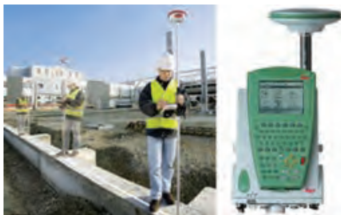
شکل ۷-۶ - پیاده کردن نقاط با GPS و PDA

پیاده کردن نقاط با GPS و PDA : همانند نقشه برداری تک نفره با RPU در اینجا به جای به کارگیری توتال استیشن برای تعیین موقعیت شاخص، از یک GPS استفاده می شود. برای این منظور آنتن GPS روی شاخص نصب شده و توسط کاربر در نقاط مورد نظر قرار داده می شود. GPS به صورت آنی نقاط را تعیین موقعیت نموده و نتیجه را روی صفحه کامپیوتر نمایشگر که روی شاخص نصب شده است به نام (PDA) (Personal Data Assistant) در کنار نقشه طرح نمایش می دهد. کاربر با نگاه به طرح آن قدر جا به جا می شود تا روی نقطه مورد نظر قرار گیرد. البته برای افزایش دقت در این روش، نیاز به دو گیرنده GPS می باشد که توضیح آن در فصل ششم ارائه شده است.