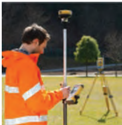
شکل ۷-۳ پیاده‌کردن تک نفره با RPU

سیستم یک نفره‌ای که در بالا شرح داده شد، برای پیاده‌کردن یک نقطه در جهت و فاصله معین از نقطه کنترلی که توتال استیشن در آن نصب شده به کار می‌رود. نقشه‌بردار دائماً صفحه نمایش RPU را که موقعیت او را نشان می‌دهد قرائت می‌کند. لذا آن قدر تغییر مکان می‌دهد تا در جهت و فاصله