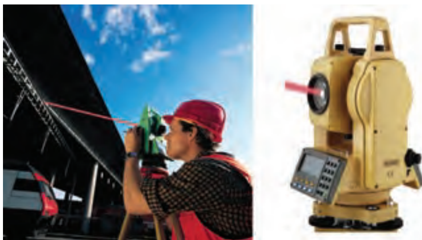
شکل ۷-۴- توتال لیزری بدون رفلکتور

توتال لیزری بدون رفلکتور : در برخی از توتال استیشن ها، که تحت عنوان Puls total station نامیده می شوند، علاوه بر اندازه گیری با استفاده از رفلکتور، می توان بدون رفلکتور نیز فاصله را اندازه گیری کرد. در این نوع توتال استیشن ها، از فن آوری Puls laser استفاده شده است. حداکثر طول قابل اندازه گیری، تابع بافت سطح مورد نشانه روی است. مثلاً در بعضی از دستگاه ها برای دیوار سفید در حدود ۱۰۰ متر می باشد. از این نوع دستگاه ها می توان برای برداشت یا پیاده سازی نقاطی که در دسترس نیست مانند دیواره داخلی گنبدها یا نقاط کنترلی روی دیواره سدها استفاده کرد. مزیت این فناوری در این است که نقطه مورد نظر برای پیاده سازی با لکه لیزر مشخص شده و در فاصله مناسب می توان آن را روی زمین یا سطح سازه مشخص نمود.