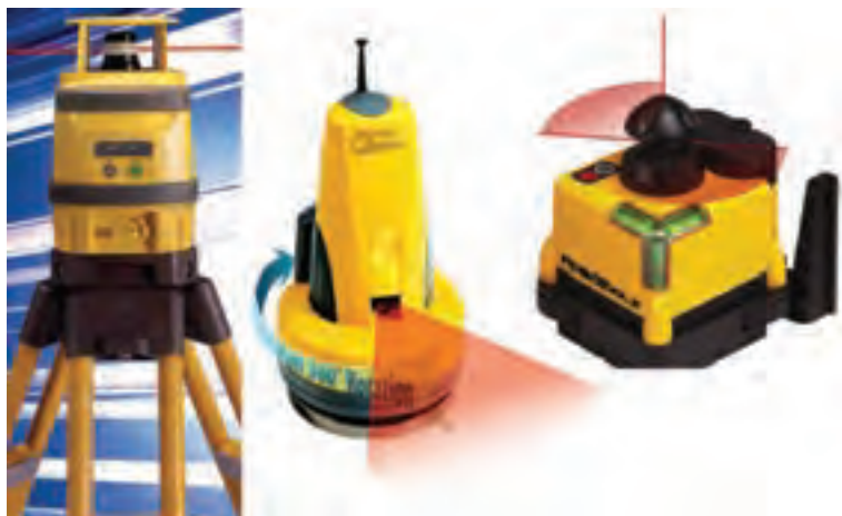
شکل ۷-۵ - تراز یاب چرخنده

پیاده کردن نقاط با GPS و PDA : همانند نقشه برداری تک نفره با RPU در اینجا به جای به کارگیری توتال استیشن برای تعیین موقعیت شاخص، از یک GPS استفاده می شود. برای این منظور آنتن GPS روی شاخص نصب شده و توسط کاربر در نقاط مورد نظر قرار داده می شود. GPS به صورت آنی نقاط را تعیین موقعیت نموده و نتیجه را روی صفحه کامپیوتر نمایشگر که روی شاخص نصب شده است به نام (PDA) (Personal Data Assistant) در کنار نقشه طرح نمایش می دهد. کاربر با نگاه به طرح آن قدر جا به جا می شود تا روی نقطه مورد نظر قرار گیرد. البته برای افزایش دقت در این روش، نیاز به دو گیرنده GPS می باشد که توضیح آن در فصل ششم ارائه شده است.