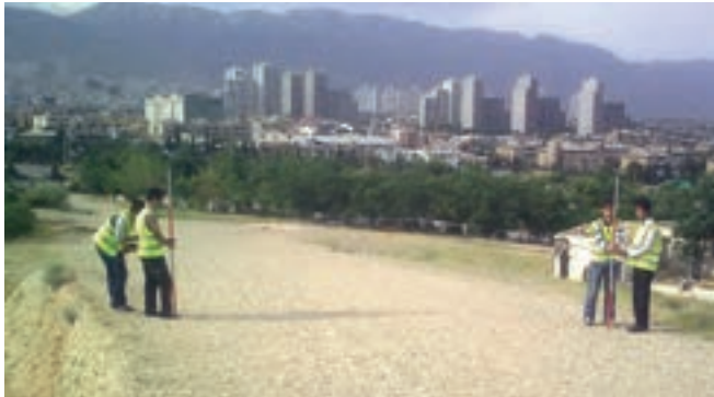
شکل ۴-۴. خطا در اثر باد و تکان خوردن متر

۲ - خطا در اثر باد و تکان خوردن متر: این خطا بیش تر زمانی اتفاق می افتد که در اثر نیروی باد، متر از امتداد خود خارج شده یا پیچ می خورد. در مواقعی که اجباراً در شرایط نامساعد جوّی باید کار کرد سعی می شود فاصله ی دهنه ها کم تر انتخاب گردد. این خطا از خطاهای اتفاقی بوده و عامل ایجاد آن طبیعت است.