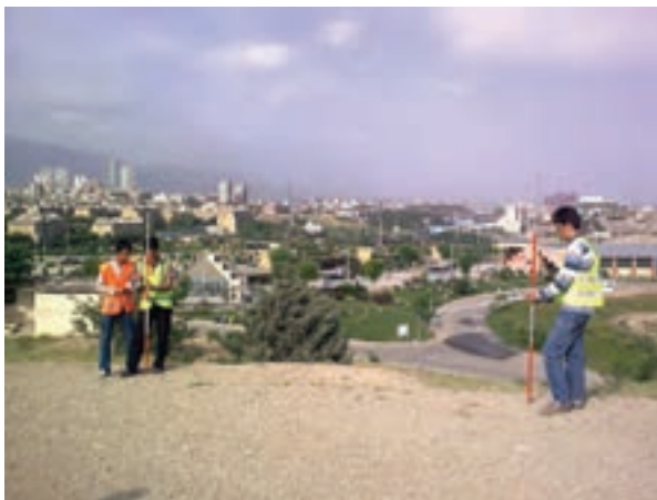
شکل ۴- ۱. خطای شکم دادن متر (شِنت)

۳ - خطای شکم دادن متر ( شِنت ) : اگر دو طرف متر با نیروی کم‌تر از حد لازم کشیده شود بر اثر نیروی جاذبه‌ی زمین و وزن متر، در وسط آن انحنا ایجاد می‌شود و به نظر می‌رسد که متر کمانه کرده است. در این حالت طول اندازه‌گیری شده از طول واقعی بیش‌تر می‌شود و خطایی در اثر کمانه کردن یا شکم دادن متر ایجاد می‌شود. این خطا از نوع تدریجی (سیستماتیک) بوده و عامل ایجاد آن طبیعت (نیروی جاذبه زمین) است.