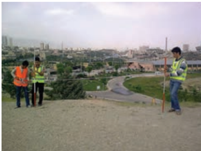
شکل ۴ - ۲. خطای افقی نبودن متر

۴ - خطای افقی نبودن متر : اگر مترکشی ما در راستای سطح افقی نباشد فاصله‌ی اندازه‌گیری شده توسط متر، فاصله‌ی مایل بین دو نقطه می‌شود. این خطا از نوع تدریجی بوده که عامل ایجاد آن انسان است.