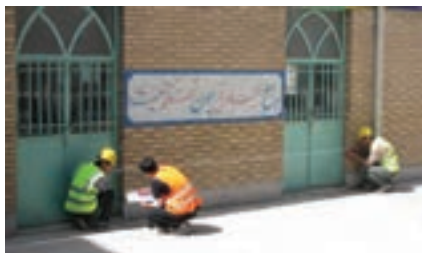
شکل ۲-۵. تهیه‌ی کروکی با متر

در هنگام ترسیم کروکی هر ۵ متر را معادل یک سانتی‌متر در نظر بگیرید.