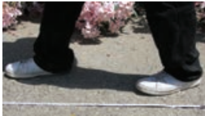
شکل ۲-۲. طول متوسط قدم نقشه بردار