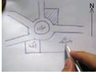
شکل ۱-۲. تهیه کروکی از یک منطقه