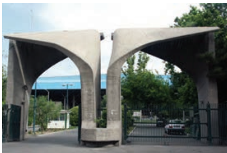
▲ شکل ۲-۱۴ سر در دانشگاه تهران

در این دوره تحولات علمی نیز با رویکرد جدید و تأسیس دانشگاه در ایران صورت می‌پذیرد (شکل ۲-۱۴) و سعی می‌شود تا جلوه‌هایی تازه در معرفی بزرگان ادب فارسی پدید آید و آرامگاه‌های باشکوهی از فردوسی، سعدی و حافظ ساخته شود (شکل ۳-۱۴ الف و ب و ج). در زمینه نقاشی و نگارگری نیز تحول بنیادینی شکل می‌گیرد و مدرسه صنایع مستظرفه به دو بخش هنرستان کمال‌الملک