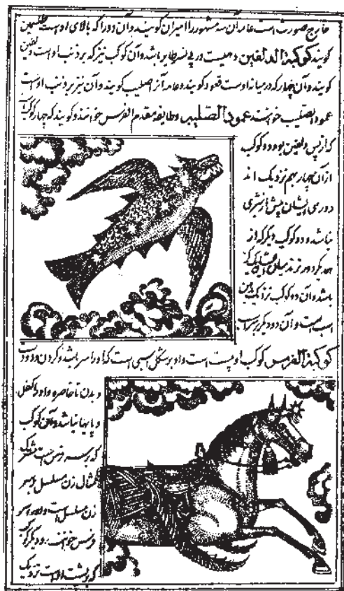
شکل ۱۱-۱۳- چاپ سنگی، کتاب عجایب المخلوقات