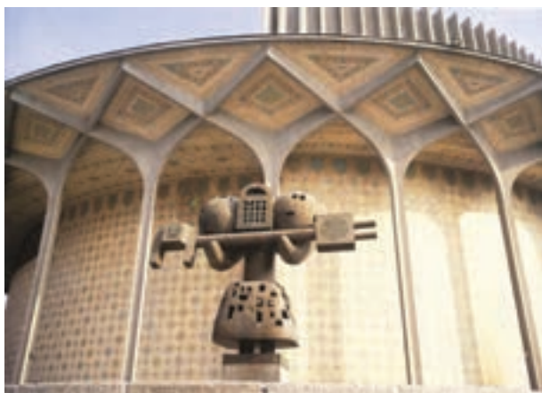
▲ شکل ۹-۱۴ هـ - تئاتر شهر، تهران، علی سردار افخمی