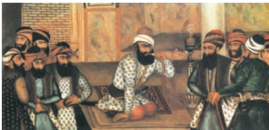
► شکل ۴-۱۳- نقاشی رنگ و روغن از چهره کریمخان زند

نقاشی‌های دوره زندیه که به «مکتب گل» شهرت یافته در بردارنده جنبه‌های مختلف با موضوعات متنوع و همچنین دربردارنده نقاشی‌های رنگ و روغنی با ابعاد بزرگ، نقاشی‌های لاک‌ی و روغنی و گل و مرغ می‌باشد (شکل ۴-۱۳). تحول اساسی در این دوره را بیشتر می‌توان در شیوه‌های جدید هنری به‌ویژه نقاشی بر اشیاء مختلف از جمله قاب آینه، صندوقچه‌های جواهر و ... دید (شکل ۵-۱۳).