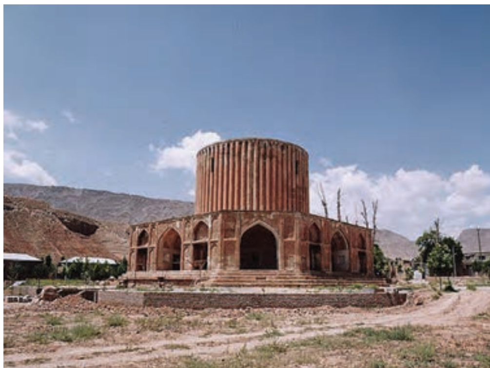
▲ شکل ۲-۱۳-کلات نادری، دوره افشاریه، خراسان