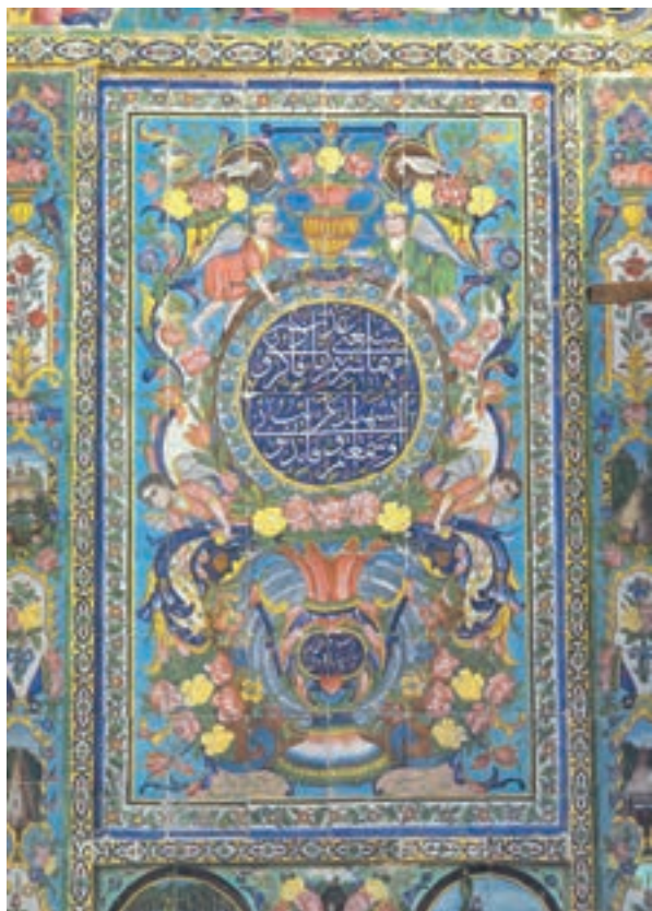
▲ شکل ۱۲-۱۳- ب- کاشی کاری هفت رنگ، دوره قاجاریه