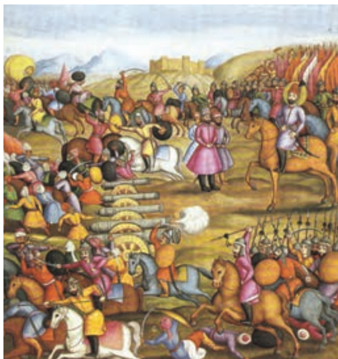
▲ شکل ۱-۱۳-ب - تصویری از کتاب تاریخ جهانگشای نادری (جنگ نادر با اشرف افغان)، ۱۱۷۱ هـ