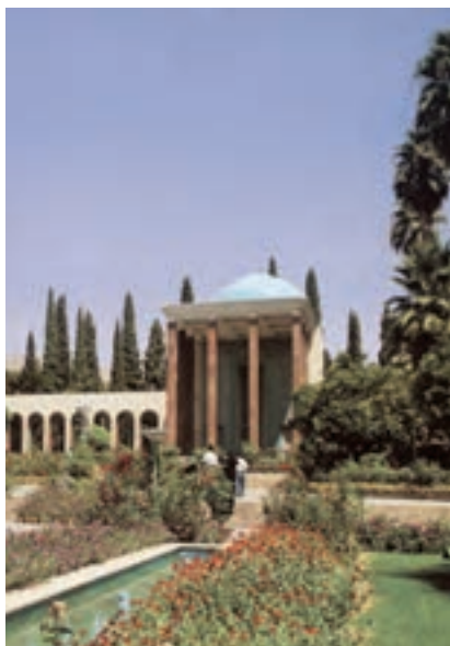
ب — سعدیه، شیراز، آندره گدار