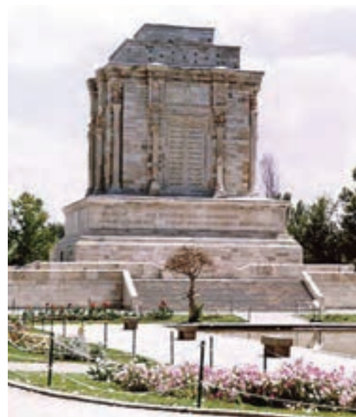
الف — آرامگاه فردوسی، توس، مشهد، لرزاده