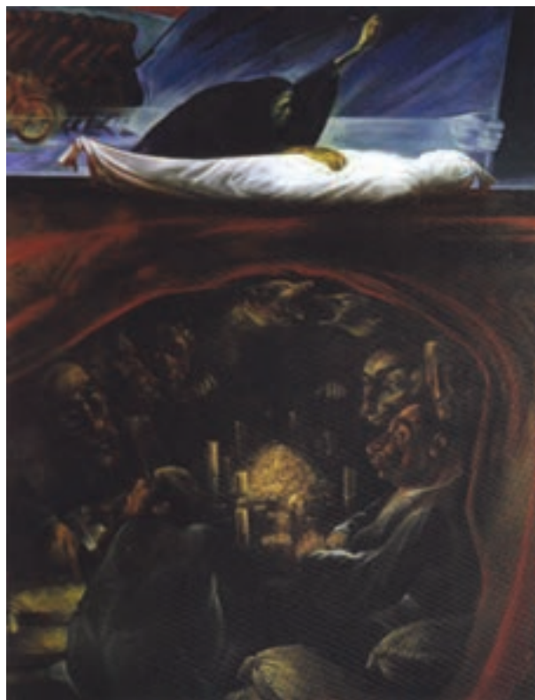
▲ شکل ۱۲-۱۴ الف- نقاشی رنگ و روغن، دوره معاصر