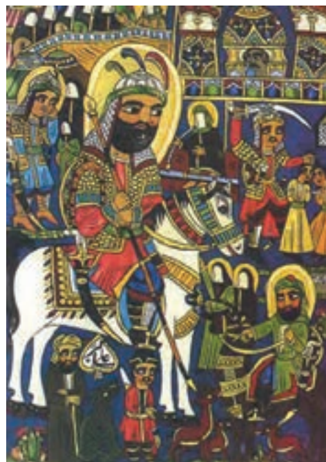
▲ شکل ۱۱-۱۴ نقاشی عامیانه

دوره چهارم نوعی رویکرد هنری از سال ۱۳۶۰ به بعد است. تداوم هنر سنت‌گرایی دوره سوم است که با تحولاتی در جریان شکل‌گیری انقلاب اسلامی و دفاع مقدس با گرایشات مذهبی ادامه می‌یابد. حاصل این تحول به شکلی است که ارزش‌های انقلابی به‌گونه‌ای با ابزار هنری در جریان تحولات اخیر به هویتی کاملاً مشخص تبدیل می‌شود. نوعی انقلاب فرهنگی در عرصه‌های متفاوت ایجاد می‌شود که نتیجه آن را به‌عنوان هنر انقلابی، هنر جنگ، هنر دفاع مقدس و ... می‌دانیم (شکل ۱۲-۱۴).