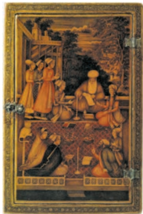
► شکل ۵-۱۳- قاب آینه، نقاشی لاک‌ی روغنی