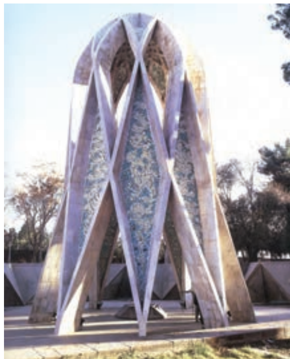
▲ شکل ۹-۱۴ الف - آرامگاه خیام، نیشابور، هوشنگ سیحون