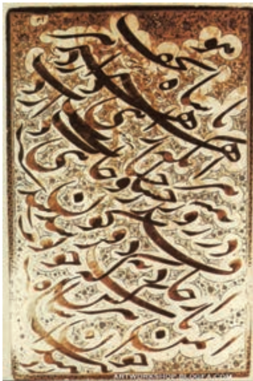
▲ شکل ۱۰-۱۳- سیاه مشق به خط نستعلیق

خوشنویسی این دوره که بیشتر به شیوه نستعلیق می‌باشد به دلیل کاربردهای جدید هنری به شکل سیاه مشق (شکل ۱۰-۱۳) و یا نوعی نگارش مناسب برای چاپ سنگی ۱ است (شکل ۱۱-۱۳).