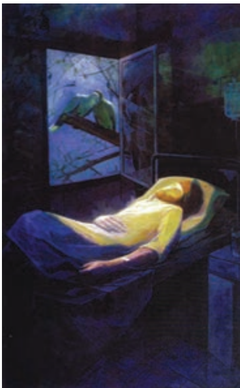
▲ شکل ۱۲-۱۴ ب- نقاشی رنگ و روغن، دوره معاصر

در جریان انقلاب فرهنگی و بازگشایی مجدد مراکز هنری در سطوح مختلف همچنان زمینه برای گرایش‌ات آزاد فراهم شد. با گذشت زمان در برگزاری نمایشگاه‌ها و جشنواره‌ها تحولاتی خاص در عرصه هنر پدید آمد.