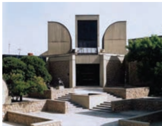
▲ شکل ۹-۱۴ د - موزه هنرهای معاصر، تهران، کامران دیبا