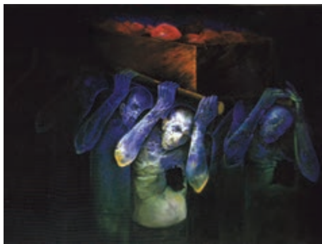
▲ شکل ۱۲-۱۴ د- رنگ اکریلیک روی بوم، دوره معاصر