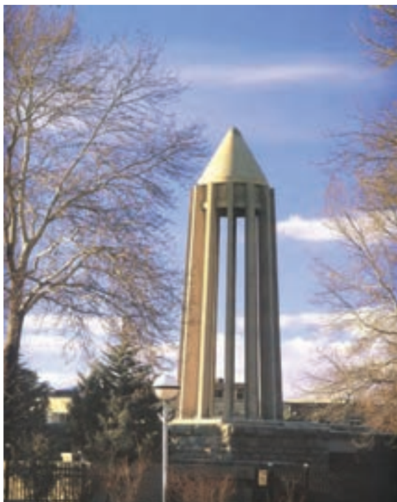
▲ شکل ۹-۱۴ ب - آرامگاه بوعلی سینا، همدان، هوشنگ سیحون