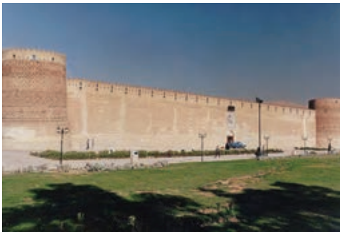
▲ شکل ۳-۱۳- ارگ کریمخان، شیراز

بنابراین زندیه با حفظ میراث هنری دوره صفویه با وجود اندک زمان حضور این سلسله توانست ویژگی‌های منحصر به فرد و خاصی را در هنر پدید آورد که در زمینه نقاشی، معماری و دیگر هنرها، شاخص باشد (شکل ۳-۱۳).