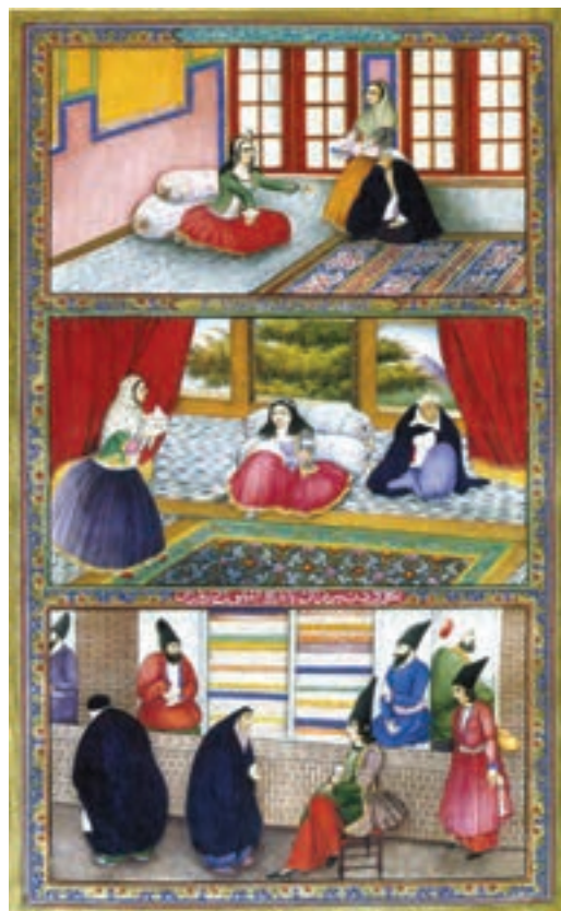
▲ شکل ۱۲-۱۳- الف- برگی از کتاب هزار و یک شب، صنیع الملک، دوره قاجاریه