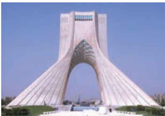
▲ شکل ۹-۱۴ ج - برج آزادی، تهران، حسین امانت