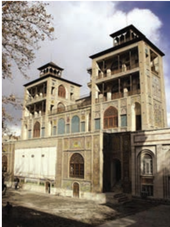
▲ شکل ۹-۱۳- شمس‌العماره، عمارت قاجاری، تهران