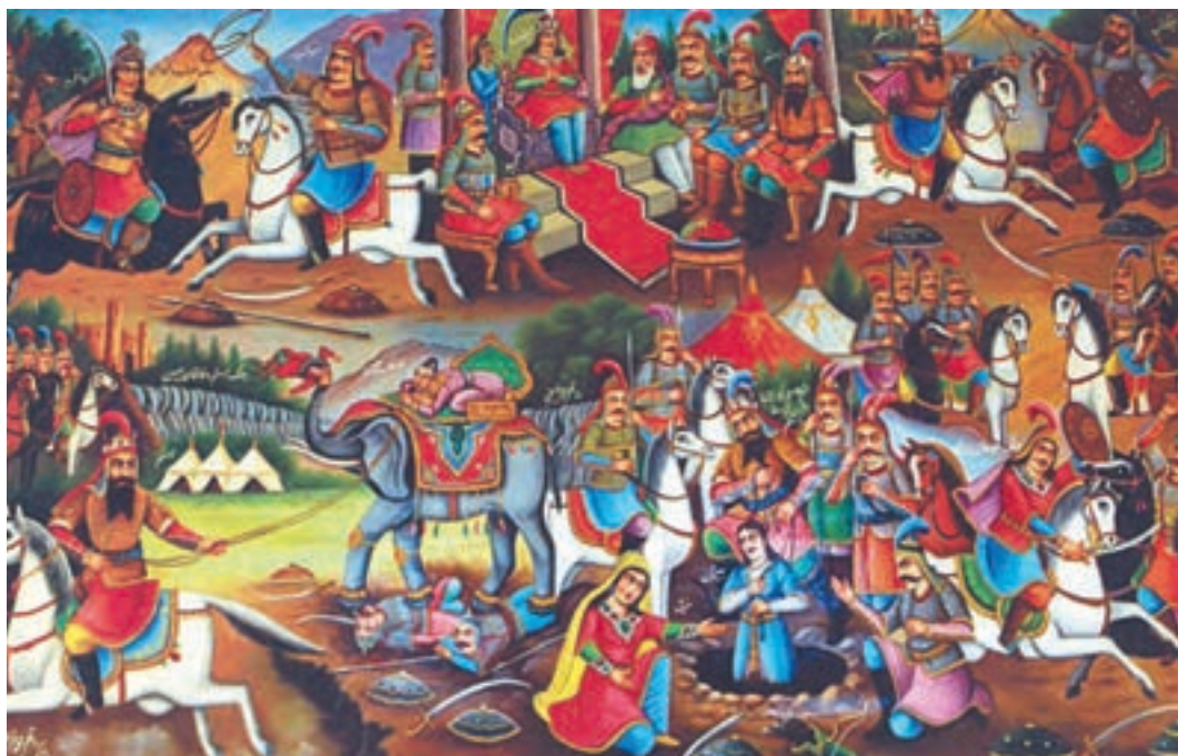
▲ شکل ۱۵-۱۳ نقاشی قهوه‌خانه‌ای، استاد محمد فراهانی

که با تأسیس مدرسه صنایع مستظرفه به همت کمال الملک شکل گرفت. این هنر، نوعی نقاشی ایرانی با گرایشات هنر غربی و شاعرانه همراه با چشم اندازهایی از مکان‌هایی واقعی است که بیان‌کننده هنر رسمی است (شکل ۱۶-۱۳).