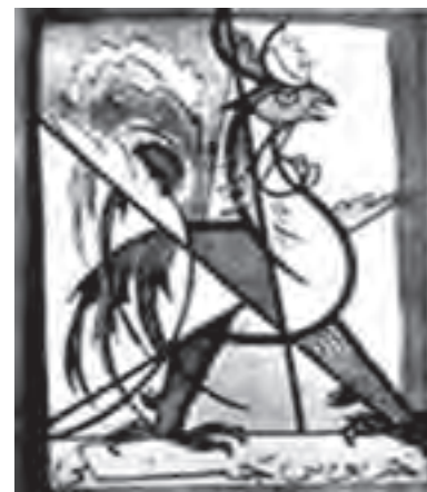
▲ شکل ۷-۱۴- نشانه انجمن خروس جنگی

تحول سنت‌گرایی در این دوره و نوعی توجه به ارزش‌های سنتی ایرانی باعث شد تا زمینه‌های فعالیت بیشتری در عرصه‌های هنری ایجاد شود. این تمایل باعث ایجاد نوعی فعالیت