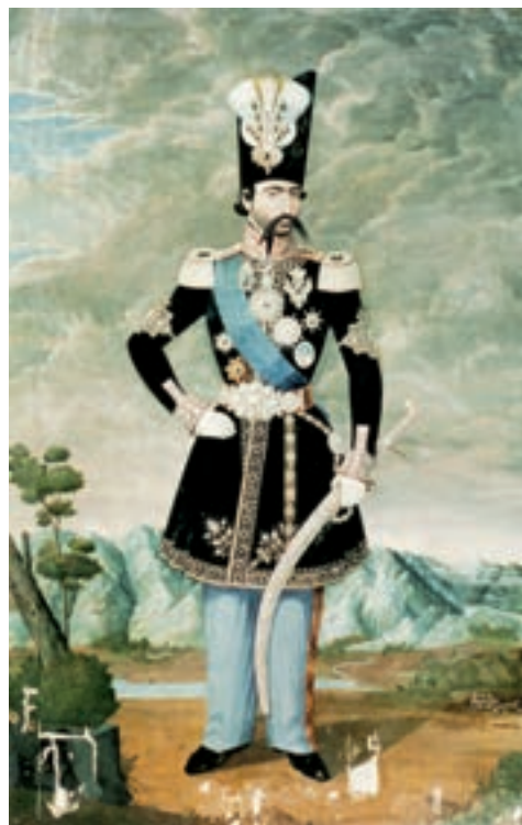
▲ شکل ۸-۱۳ - چهره ناصرالدین شاه

پس از تأسیس مدرسه دارالفنون و دارالصنائع به عنوان اولین مرکز دولتی آموزش هنر نوعی گرایش کامل به هنر اروپایی به وجود می‌آید و تمایل به هنر اشرافی و درباری به اینگونه آثار روزبه‌روز بیشتر می‌شود. تمایلات هنر اروپایی بیشتر در منظره‌سازی و صورت‌سازی و دور شدن از نگارگری ایران دیده می‌شود (شکل ۸-۱۳). تحولات معماری در این دوره نیز مانند نقاشی با تلفیق عناصر سنتی و شکل ظاهری معماری اروپایی می‌باشد (شکل ۹-۱۳).