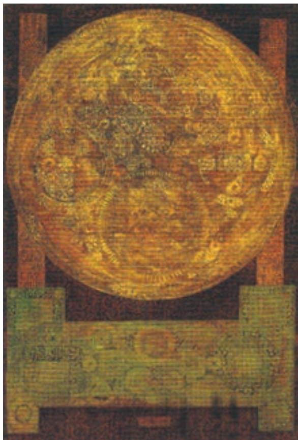
▲ شکل ۱۰-۱۴ ب- نقاشی، فرامرز پیل آرام، مواد ترکیبی