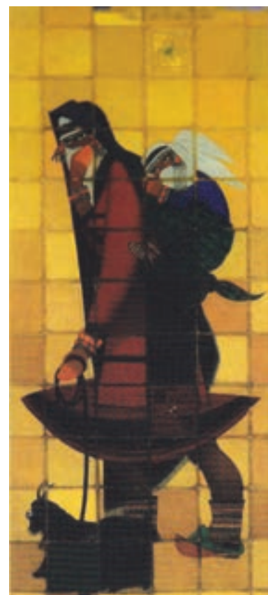
▲ شکل ۸-۱۴- زن قوچانی، جلیل ضیاءپور، رنگ و روغن روی بوم