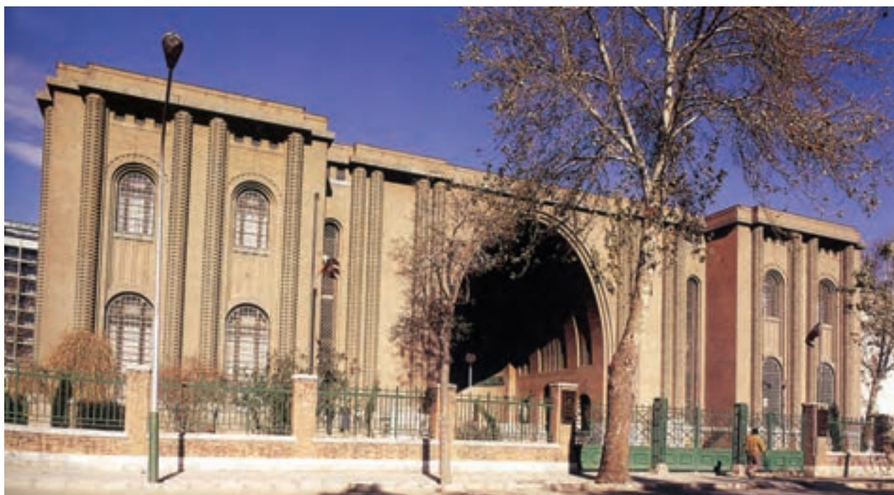
▲ شکل ۱-۱۴ سر در موزه ملی ایران، تهران، آندره گدار

بودند اما به لحاظ رویکرد باستان‌شناسی سعی داشتند تا طرح‌های معماری خود را به شیوه باستانی بسازند (شکل ۱-۱۴).