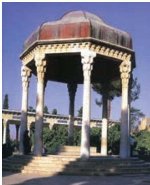
ج — حافظیه، شیراز، آندره گدار