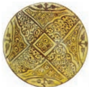
▲ شکل ۸-۶- ظرف زرین فام، با طرح و نقش گیاهی