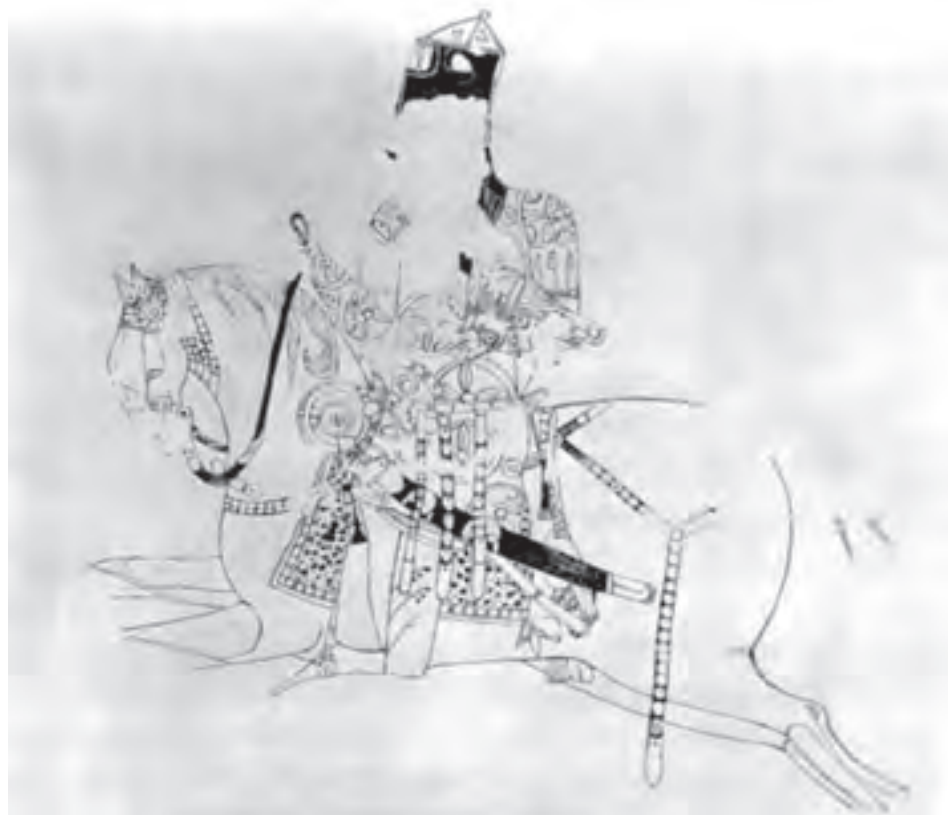
▲ شکل ۸-۱۰ - نقاشی دیواری، نیشابور، سده سوم و چهارم هجری

همچنین در این دوره هنر فلزکاری بازمانده از دوران ساسانی ادامه یافت و ظروف بزرگ و باشکوهی تولید شد (شکل ۸-۹). اما به دلایل گوناگون هیچ نمونه‌ای از مصورسازی کتاب دیده نشده و تنها نمونه موجود شاید همان نسخه ارژنگ مانی (یافته شده در منطقه تورفان ۱ در سده دوم و سوم هجری) باشد. آثار پراکنده به ویژه دیوارنگاری‌های دوران حکومت‌های اسلامی (اموی و عباسی) و یا نگاره‌های سفالینه‌ها، بیانگر تداوم سنت نقاشی از دوره ساسانی به دوره آغازین اسلامی است. اما منابع مشخصی برای تعیین ماهیت نقاشی این دوران نیست و بیشترین اعتبار نقاشی را بایستی در سده‌های بعد شاهد باشیم (شکل ۸-۱۰).