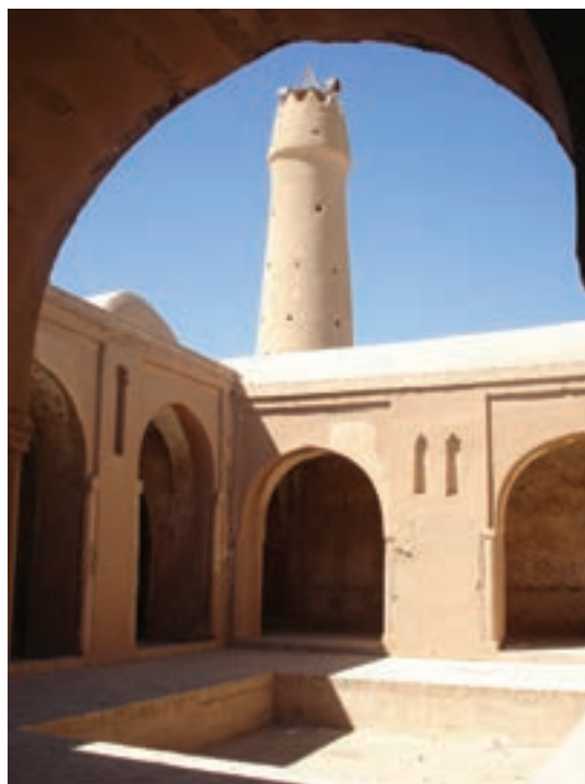
▲ شکل ۸-۲ — مسجد تاریخانه، دامغان، سده اول تا سوم هجری

در دوره اسلامی استفاده از آجر به دلیل سادگی و ایجاد ترکیب‌های متفاوت، همواره ترجیح داده می‌شد. زیرا آجر از چوب بادوام‌تر و از سنگ ارزان‌تر بود. همچنین کار با آن سریع‌تر و انعطاف‌پذیرتر از سنگ بوده و می‌توانست هرگونه بنایی را با هر قابلیتی پدید آورد که همین زمینه‌ساز فرصت‌های مناسبی برای تجلی تزیینات ساختمان‌ها شد (شکل ۸-۳).