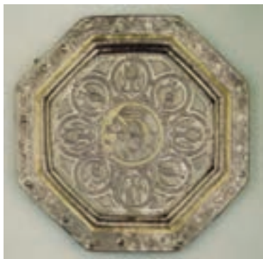
▲ شکل ۸-۹ - ظرف فلزی، نقره طلا اندود، سده سوم هجری

همچنین در این دوره هنر فلزکاری بازمانده از دوران ساسانی ادامه یافت و ظروف بزرگ و باشکوهی تولید شد (شکل ۸-۹). اما به دلایل گوناگون هیچ نمونه‌ای از مصورسازی کتاب دیده نشده و تنها نمونه موجود شاید همان نسخه ارژنگ مانی (یافته شده در منطقه تورفان ۱ در سده دوم و سوم هجری) باشد. آثار پراکنده به ویژه دیوارنگاری‌های دوران حکومت‌های اسلامی (اموی و عباسی) و یا نگاره‌های سفالینه‌ها، بیانگر تداوم سنت نقاشی از دوره ساسانی به دوره آغازین اسلامی است. اما منابع مشخصی برای تعیین ماهیت نقاشی این دوران نیست و بیشترین اعتبار نقاشی را بایستی در سده‌های بعد شاهد باشیم (شکل ۸-۱۰).