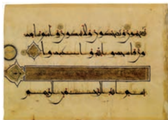
▲ شکل ۸-۸- برگه از قرآن مجید به خط کوفی، سده سوم هجری

خط کوفی به‌دست توانای یک هنرمند ایرانی به‌صورت خطی زیبا، با ارزش تزئینی بسیار بالا درآمد. هرچند خواندن آن با اشکالاتی روبه‌رو بود اما باز هم توسط هنرمندان ایرانی اصلاح شد و خطوط دیگر به‌دست محمدبن علی فارسی معروف به ابن مقله پدید آمد. خط کوفی همچنان به‌عنوان خطی تزئینی به مدت ۵ سده در نواحی مختلف به‌شیوه‌های گوناگون به کار می‌رفت. این خط به عنوان رایج‌ترین نقش تزئینی روی ظروف فلزی و سفالی، پارچه و یا کتیبه‌ها مورد استفاده قرار گرفت. با سیر تحول خط، از خط کوفی «اقلام سته» پدید آمد که به خطوط شش‌گانه، محقق، ریحان، ثلث، نسخ، رقاع و توقیع، شهرت یافته‌اند (شکل ۸-۸).