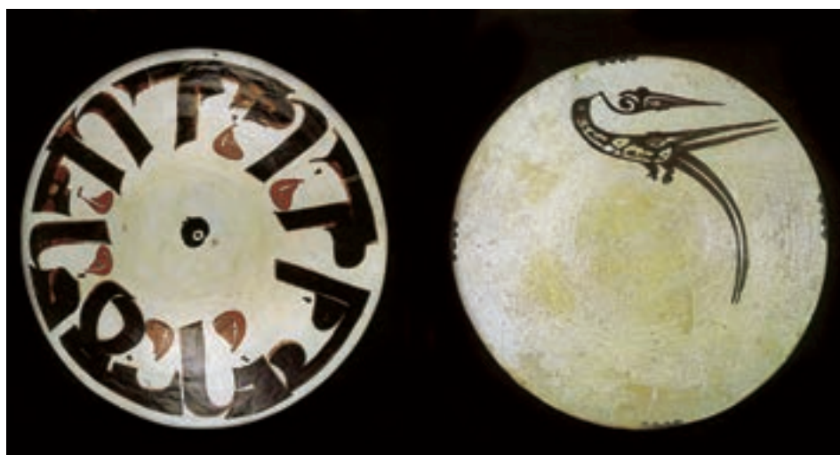
▲ شکل ۸-۷- ظرف سفالی، نیشابور، سده سوم و چهارم هجری

خط کوفی به‌دست توانای یک هنرمند ایرانی به‌صورت خطی زیبا، با ارزش تزئینی بسیار بالا درآمد. هرچند خواندن آن با اشکالاتی روبه‌رو بود اما باز هم توسط هنرمندان ایرانی اصلاح شد و خطوط دیگر به‌دست محمدبن علی فارسی معروف به ابن مقله پدید آمد. خط کوفی همچنان به‌عنوان خطی تزئینی به مدت ۵ سده در نواحی مختلف به‌شیوه‌های گوناگون به کار می‌رفت. این خط به عنوان رایج‌ترین نقش تزئینی روی ظروف فلزی و سفالی، پارچه و یا کتیبه‌ها مورد استفاده قرار گرفت. با سیر تحول خط، از خط کوفی «اقلام سته» پدید آمد که به خطوط شش‌گانه، محقق، ریحان، ثلث، نسخ، رقاع و توقیع، شهرت یافته‌اند (شکل ۸-۸).