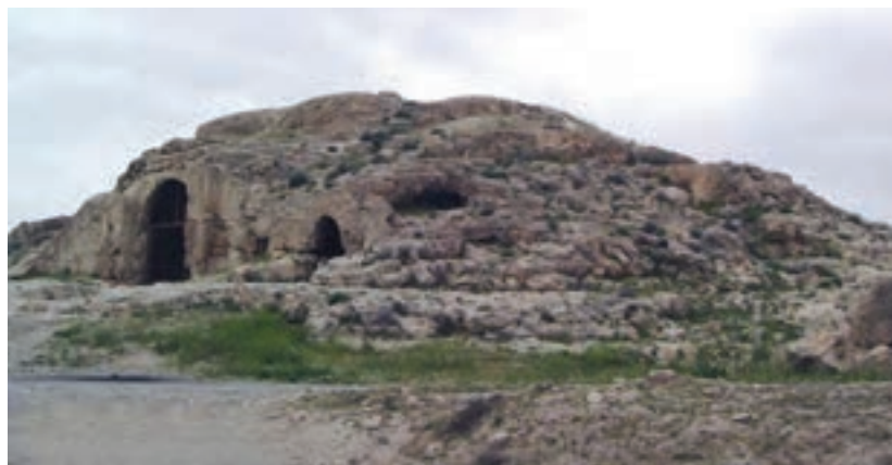
▲ شکل ۱-۸ — مسجد سنگی داراب گرد

نظام معماری اسلامی همان‌گونه که اشاره شد مستقیماً ریشه در سنت ساسانی داشته و از همان آغاز برخی از کاخ‌ها و آتشکده‌های ساسانی بدون هیچ‌گونه اصلاح و تغییری به مسجد تبدیل شده است. از نمونه‌های شاخص این تبدیل می‌توان به ایوان مدائن در تیسفون، آتشکده باستانی مسجدسلیمان و مسجد سنگی داراب گرد (در اصل آتشکده بوده) اشاره کرد (شکل ۱-۸). از آنجایی که مسجد مکان ویژه‌ای است که نه تنها مرکزیت دینی دارد بلکه در تمام دوران‌ها نهادی سیاسی، مکانی برای قضاوت و نهادی آموزشی نیز به‌شمار می‌آید، بنابراین دارای منزلتی والا بوده و رفته‌رفته می‌بایست تحولاتی در ساخت آن پدید آید. به‌همین علت ابتدا ساختار کلی مسجد به شیوه‌ای ستون‌دار یعنی با شبستان‌های ستون‌دار (چهل‌ستونی) و حیاط ساخته می‌شد که جهت آن‌رو به قبله بود. از کهن‌ترین مساجد شناخته شده در ایران می‌توان به تاربخانه ۱ دامغان، مسجد فهرج یزد (روستایی اطراف یزد)، مسجد جامع شوش، مسجد جامع سیراف (بوشهر) و مسجد جامع اصفهان اشاره کرد (شکل ۲-۸). از دیگر موارد تحول یافته در ساختار معماری اسلامی وجود مدرسه است که با ساخت صحن گشاده، سرسراه‌های گنبددار و ایوان در چهار نمای حیاط معرفی می‌شود. این ساختار از الگوهای کاملاً ایرانی است که تلفیق آن با مسجد در مسیر تحول خود عالی‌ترین الگوی تلفیق معماری مسجد و مدرسه را به‌بار آورد.