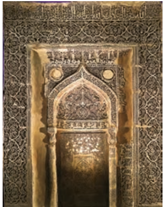
▲ شکل ۸-۴- محراب، مسجد جامع نایین، سده سوم و چهارم هجری ▲ شکل ۸-۵- آرامگاه امیر اسماعیل سامانی، بخارا

از سده دوم هجری به بعد شاهد تکمیل فنون و سبک‌های متعدد در تولید انبوه سفالینه‌ها هستیم که چشم‌انداز هنر ایرانی در آنها به‌خوبی دیده می‌شود. سفالگری بیانگر کهن‌ترین و فراگیرترین هنر ایرانی در همه اعصار بوده و شاید بهترین سند و مدرک زندگی هنری ایران دوران اسلامی باشد. این آثار پیوند بسیار نزدیکی با زندگی مردم داشته و در تمام زمینه‌ها علاوه بر کاربرد، زیبایی نیز دارد. همچنین در مقایسه چنین برمی‌آید که پیشرفت سفالگری دوره اولیه اسلامی بیشتر از فن سفالگری در دوره ساسانی است. در این سیر تحول، لعاب‌های سبز و قهوه‌ای دوره ساسانی تداوم می‌یابد اما به دلیل اهمیت بیشتر سفالگری و جایگزینی آن نسبت به فن فلزکاری، در این زمان شیوه‌های تزئین یافته‌تر و ظریف‌تری در سفال‌ها پدید می‌آید. این توجه و اهمیت به سفالگری در دوره اسلامی