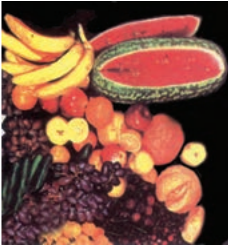
شکل ۳-۷- گروه میوه‌ها

روده‌های حساس هستند و معمولاً یبوست هم دارند می‌توانند روزانه با مصرف مقدار کمی میوه بین غذا یا همراه غذا دفع راحتی داشته باشند. مصرف زیاد میوه‌ها باعث نفخ شکم، اختلالات روده‌ای و اسهال می‌شود.