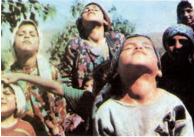
شکل ۲-۶ - شیوع بیماری گواتر در یک منطقه حاکی از کمبود ید در رژیم غذایی است.