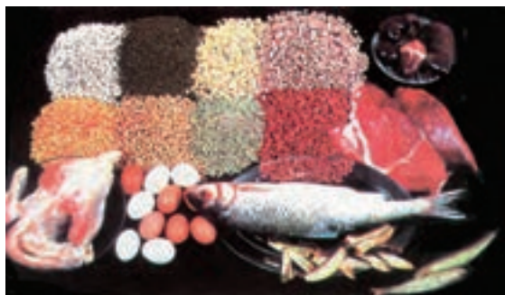
شکل ۷-۲- گروه گوشت و حبوبات

مواد غذایی که در گروه گوشت و حبوبات قرار می‌گیرند شامل انواع گوشت قرمز و سفید مثل گوشت گاو، گوسفند، مرغ، ماهی، دل، جگر و تخم مرغ و حبوبات (انواع لوبیاهای، نخود، عدس، ماش و لپه) و مغزها مثل گردو، پسته و بادام زمینی (شکل ۷-۲). این مواد می‌توانند قسمتی از نیاز انسان به پروتئین، آهن، ویتامین‌های گروه B (به خصوص تیامین، نیاسین، ریوفلاوین، ویتامین B ۱۲ ) و روی را تأمین نمایند.