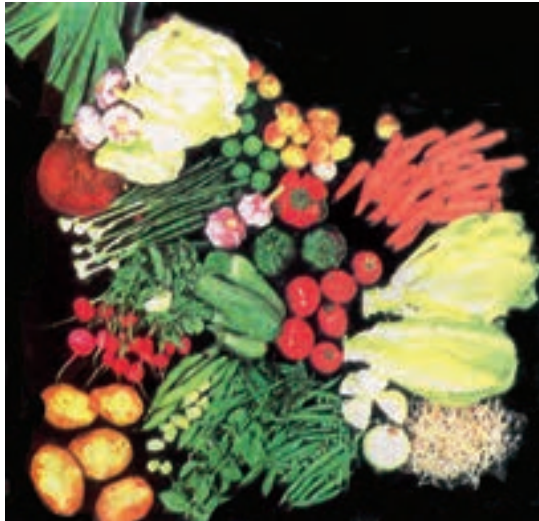
شکل ۴-۷- گروه سبزی‌ها

سبزی‌ها به علت داشتن آب زیاد (حدود ۷۵ تا ۹۰ درصد) معمولاً کالری کمتری دارند. در ترکیب سبزی‌ها مقداری سلولز وجود دارد که برای انسان قابل هضم و جذب نیست و فقط باعث افزایش حجم مواد غذایی مصرفی می‌شود و در نتیجه به تخلیه روده‌ها و دفع مواد زاید کمک می‌نماید.