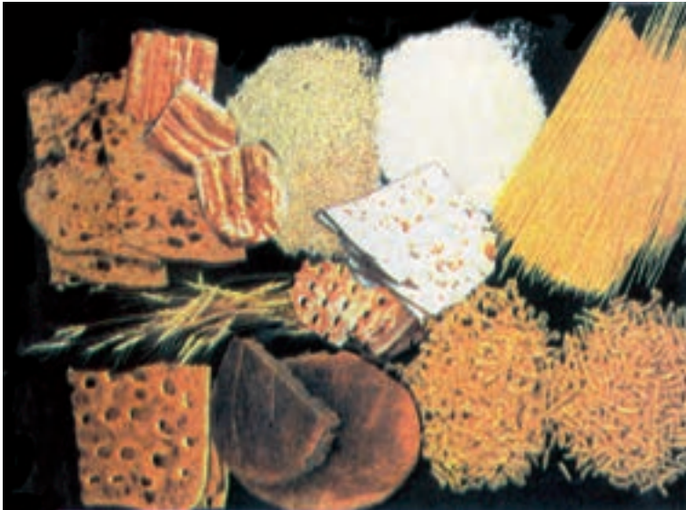
شکل ۵-۷- گروه نان و غلات

آرد می‌باشند. این مواد می‌توانند مقداری از نیاز بدن به انرژی، ویتامین‌های نیاسین، تیامین و برخی از مواد معدنی مانند آهن و روی و همین‌طور فیبر غذایی را تأمین کنند.