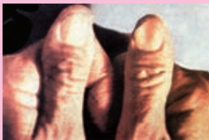
شکل ۱-۶- قاشقی شدن ناخن ها در کم خونی فقر آهن