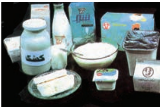
شکل ۷-۱- گروه شیر و فرآورده‌های آن

پنیر، کشک، بستنی و دوغ است (شکل ۷-۱). این مواد می‌توانند نیاز بدن به اغلب مواد مغذی به ویژه پروتئین، کلسیم، ریوفلاوین و روی را تأمین کنند. اگر چه لبنیات از بهترین منابع پروتئین و کلسیم هستند، ولی از نظر آهن، ویتامین C و ویتامین D فقیر می‌باشند.