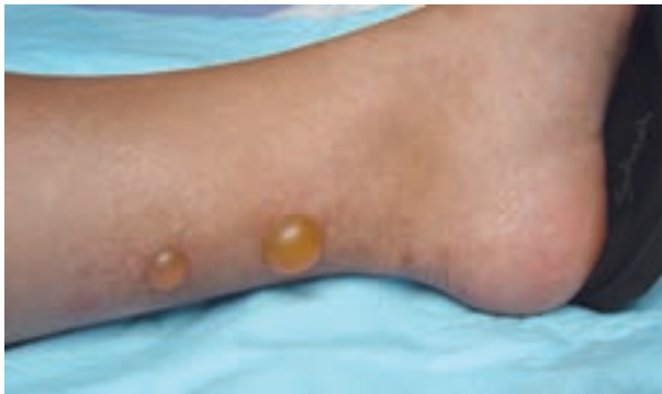
شکل ۹-۸- ضایعات ناشی از گزش حشرات

این بیماری در سنین خردسالی در فصول فعالیت حشرات یعنی بهار و تابستان در اثر گزش حشرات دیده می‌شود. ضایعات به شکل دانه‌های قرمز خارش‌دار و برجسته بر روی قسمت‌های باز بدن به خصوص دست‌ها و پاها، شکم و کمر و صورت بروز می‌کند. گاهی ضایعات به شکل تاولی مشاهده می‌شود (شکل ۹-۸). درمان گزش شامل استفاده از داروهای ضد خارش موضعی است.