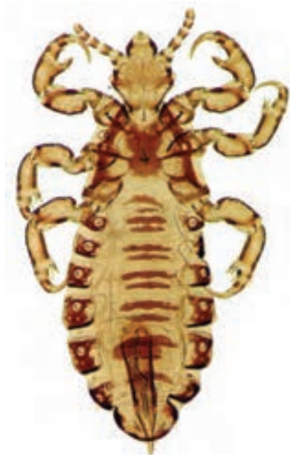
شکل ۵-۸- شپش موی سر

بیماری است که به علت آلودگی پوست و موی سر با این حشره، در مناطق پر جمعیت که سطح بهداشت فردی و اجتماعی پایین است مشاهده می‌گردد. لذا این بیماری در مواقع جنگ و بی‌خانمانی شیوع بیشتری پیدا می‌کند (شکل ۵-۸).