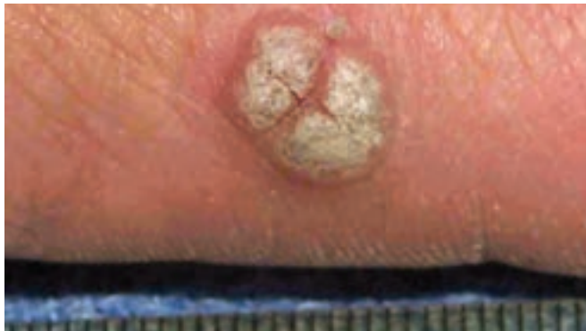
شکل ۸-۸- زگیل معمولی

بیماری ویروسی مزمنی است که در سنین خردسالی شایع است. بیماری به صورت دانه‌های برجسته به رنگ پوست با سطح خشن و یا صاف می‌باشد. این ضایعات در پشت دست‌ها و صورت، بیشتر از سایر نقاط بدن مشاهده می‌گردد (شکل ۸-۸).