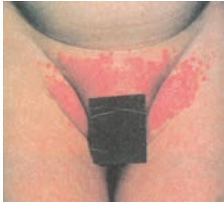
شکل ۱۳-۸- آگزمای ناشی از قارچ کاندیدا

این بیماری در سنین شیرخوارگی به علت تحریک پوست بر اثر تماس طولانی با ادرار و یا مدفوع به وجود می‌آید. عدم تعویض به موقع کهنه و یا پوشک، سبب تشدید عارضه می‌گردد. این بیماری به صورت قرمزی ناحیه تناسلی بروز می‌کند و در صورت طولانی شدن ممکن است در چین‌های منطقه قارچ کاندیدا اضافه شود که با بروز دانه‌های به ظاهر چرکی، در اطراف ضایعه اصلی و چین‌ها مشخص می‌گردد (شکل ۱۳-۸).