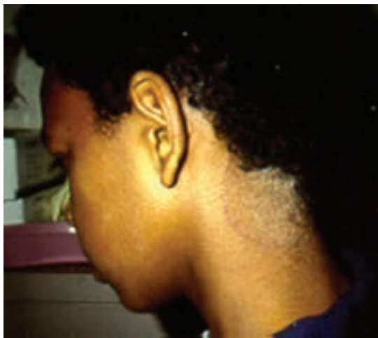
شکل ۲-۸- کچلی پوست و ناحیه پشت گردن

کچلی پوست: این نوع کچلی به صورت صفحات قرمز رنگ دایره یا بیضی شکل با حاشیه مشخص و کمی برجسته بروز می‌کند که در مرکز آن ضایعه در حال بهبود می‌باشد. کچلی پوست بیشتر در نواحی تنه و اندام‌ها مشاهده می‌گردد (شکل ۲-۸).