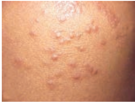
شکل ۷-۸- گال یا جرب

و ناحیه تناسلی به وجود می‌آیند. حرکت انگل در پوست سبب انتشار بیماری می‌گردد (شکل ۷-۸). خارش بدن به هنگام شب بیشتر است.