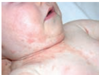
شکل ۱۲-۹- اگزمای شیرخوارگی در یک کودک