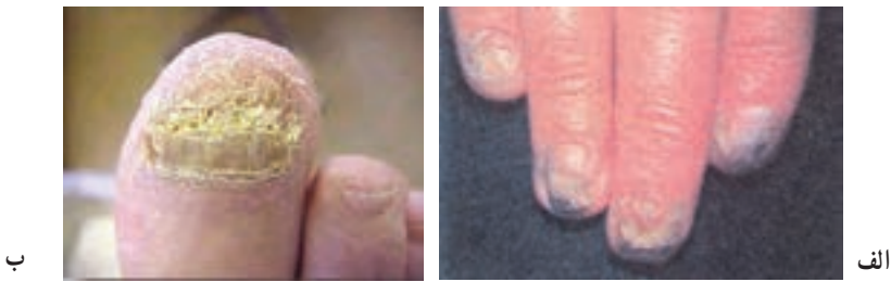
شکل ۳-۸- ضایعه قارچی ناخن (کچلی ناخن)

کچلی ناخن : این نوع کچلی با التهاب و قرمزی ناخن و تغییر شکل آن مشاهده می‌گردد (شکل ۳-۸).