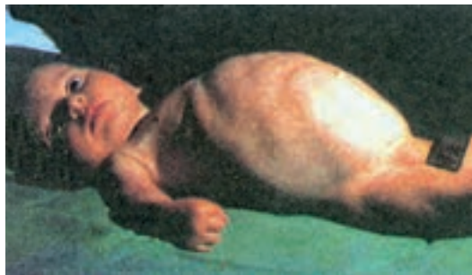
شکل ۳-۲- شکم نفاخ و برجسته در یک کودک مبتلا به مگاکولون

۲- بیماری مگاکولون ۱ : در این بیماری روده بزرگ در انتهای خود، یعنی کمی بالاتر از سوراخ مقعد، فاقد گانگلیون عصبی است؛ لذا در نقاطی که عصب وجود ندارد حرکت دودی روده بزرگ از بین رفته و مدفوع در قسمت بالای آن باقی می‌ماند و بیوست شدید بروز می‌کند، به طوری که کودک مبتلا به مگاکولون هفته‌ها قادر به دفع مدفوع نیست و در این حالت شکم نفاخ و بزرگ شده، رشد