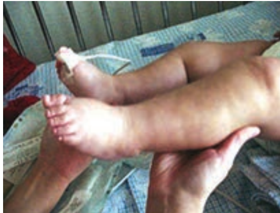
شکل ۷-۲- ادم پاهاى یک کودک

۴- در جریان نارسایی کلیه‌ها، دفع آب و املاح از بدن مختل می‌شود و به علت افزایش حجم کلی آب بدن، به حجم مایعات بین سلولی نیز افزوده می‌شود و ادم بروز می‌کند. ادم ممکن است خفیف یا شدید، موضعی و یا عمومی باشد. در ادم عمومی علاوه بر ادم پاها، در داخل شکم و فضاهاى جنبى نیز مایع جمع می‌شود که موجب بروز تنگی نفس در بیمار مبتلا به ادم می‌گردد. با معاینه بیمار مبتلا به ادم گاهی می‌توان به علت بروز ادم پی‌برد. ادم کلیوی و قلبی گوده‌گذار است یعنی اثر انگشت در محل فشار وارده باقی می‌ماند. اما ادم آلرژیک غیرگوده‌گذار است و فشار انگشت، اثری در محل ادم باقی نمی‌گذارد. در ادم کلیوی، رنگ پوست محل ادم سفید است اما در ادم قلبی به علت کندی جریان خون وریدی و سیانوز پوست محل ادم کبود و تیره رنگ است.