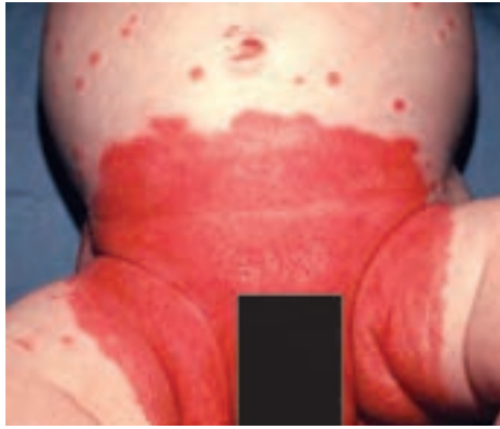
شکل ۹-۳ عفونت برفکی ناحیه تناسلی در یک کودک

شکل ۹-۳ ضایعات فارچی کاندیدا را در ناحیه تناسلی یک کودک نشان می‌دهد. این ضایعات غالباً به دنبال عفونت برفکی دهان و دستگاه گوارش به وجود می‌آیند.