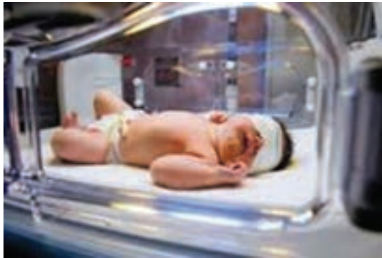
شکل ۱۱-۳- فوتوتراپی در نوزاد

درمان زردی نوزادی: تجویز داروهای گیاهی به نوزادان مبتلا به زردی آن طوری که مرسوم است هیچ گونه اثر شناخته شده‌ای ندارد و لذا نباید این داروها را به نوزاد داد. زردی فیزیولوژیک چون بسیار خفیف و گذراست احتیاج به درمان خاصی ندارد و خودبه‌خود بهبود می‌یابد و زردی‌های پاتولوژیک با توجه به علل آن درمان می‌شوند البته در ضمن درمان علت اصلی بیماری باید به کاهش زردی نیز اقدام نمود. اقداماتی که برای کاهش زردی انجام می‌شود عبارت است از فوتوتراپی و تعویض خون. فوتوتراپی: تاباندن نور چراغ فلورسنت به سطح بدن نوزاد، سبب شکسته شدن مولکول بیلی روبین و تبدیل آن به یک ماده بی‌ضرر می‌گردد. لذا برای این منظور از دستگاهی که برای این کار تعبیه شده استفاده می‌نمایند و نوزاد را بدون لباس و برهنه در حالیکه چشم‌هایش توسط نواری بسته شده در زیر دستگاه می‌خوابانند (شکل ۱۱-۳). زمان متوسط فوتوتراپی ۲-۳ روز است. فوتوتراپی را برای درمان انواع متوسط زردی یعنی وقتی که مقدار بیلی روبین بین 10^{\circ} تا 15 میلی گرم است به کار می‌برند.