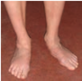
شکل ۱-۲- کف پای صاف

۱- گاهی درد اندام مربوط به رشد کودک است. این دردها بیشتر در کشاله ران بروز می‌کند.