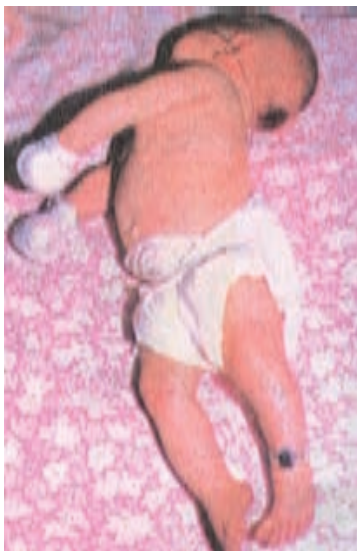
شکل ۷-۳- یک نوزاد مبتلا به کزاز (سفتی گردن و کشیدگی اندام‌ها)

بیماری کزاز می‌گردد. در این مورد از واکسن دوگانه بزرگسالان Td (کزاز - دیفتری) به جای TT (کزاز) استفاده می‌شود و در صورت دیر مراجعه کردن زن حامله واکسیناسیون دیفتری کزاز را در هر زمان حاملگی می‌توان انجام داد، به شرطی که آخرین دوز واکسن Td حداقل ۲ هفته تا تاریخ زایمان فاصله داشته باشد ۱ روش دوم؛ که باید مکمل روش اول گردد استفاده از وسایل استریل برای بریدن بندناف و نیز محافظت بهداشتی بندناف تا زمان جدا شدن آن است. بندناف از روز ششم تا دهم تولد جدا شده، می‌افتد. ضمن تمیز نگهداشتن و استحمام کودک استفاده از هرگونه ماده ضدعفونی برای بندناف ممنوع است. علائم کزاز نوزادی در مراحل اولیه عبارت است از نخوردن شیر، عدم توانایی مکیدن پستان. در مراحل پیشرفته تشنجات مکرر و سفتی عضلات اندام‌ها سبب کشیده شدن گردن و تنه به طرف عقب می‌گردد. شکل ۷-۳ یک نوزاد مبتلا به کزاز را نشان می‌دهد.