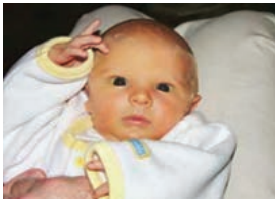
شکل ۵-۲- زردی یک نوزاد

یرقان در اثر افزایش بیلی‌روبین در بدن به وجود می‌آید. بیلی‌روبین که از تجزیه هموگلوبین به دست می‌آید در بدن به دو صورت غیرمستقیم (محلول در چربی) و مستقیم (محلول در آب) وجود دارد. بیلی‌روبین غیرمستقیم برخلاف بیلی‌روبین مستقیم در صورت افزایش بیش از حد طبیعی از سد مغزی عبور می‌کند و موجب تخریب سلول‌های مغزی می‌گردد. این موضوع در نوزادان اهمیت بیشتری دارد که در مبحث بیماری‌های نوزادان به آن اشاره خواهد شد. بروز یرقان در بدن، به مقدار بیلی‌روبین تام ۲ خون بستگی دارد. به طور طبیعی مقدار آن یک میلی‌گرم در صد میلی‌لیتر خون است. اگر مقدار بیلی‌روبین تام از این حد بیشتر شود ابتدا صلبیه چشم‌ها و سپس پوست بدن زرد می‌شود و یرقان ظاهر می‌گردد. شکل ۵-۲ زردی و بروز یرقان را در یک نوزاد نشان می‌دهد.