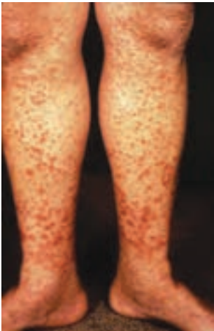
شکل ۶-۲- پورپورا ناشی از اختلال عروقی در بیماری هنوخ شوئن لای

نقاط بدن به وجود می‌آید. در بیماری‌های خونریزی دهنده هر نقطه‌ای از بدن ممکن است دچار خونریزی شود. خونریزی زیرپوست را پورپورا ۱ و خونریزی از بینی را اپیستاکسی ۲ و خونریزی از معده را هماتمز و خونریزی از کلیه و مثانه را هماتوری می‌نامند (شکل ۶-۲).