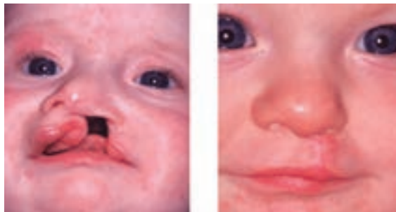
ب) لب شکری و شکاف کام قبل و بعد از ترمیم