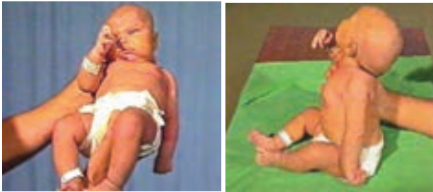
شکل ۱-۳- فلج ارب در بازوی چپ یک نوزاد

علائم بیماری: نوزاد به خاطر فلج دست در طرف مبتلا، توانایی حرکت دادن آن را ندارد. این بیماری با شکستگی استخوان بازو اشتباه می‌شود که با عکسبرداری از بازوی همان طرف می‌توان