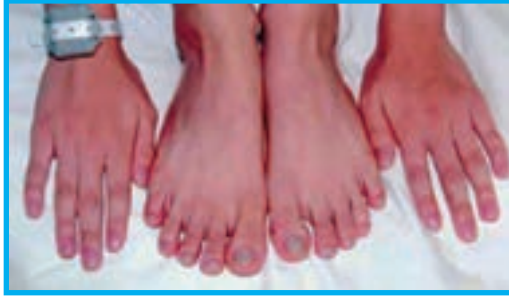
شکل ۴-۲. سیانوز انگستان دست‌ها و پاها

وجود جسم خارجی در مسیر راه‌های تنفسی و غیره، موجب بروز تنگی نفس و سیانوز می‌شوند. ۴- اختلال مرکز تنظیم‌کننده تنفس در بصل النخاع در اثر بیماری‌هایی چون فلج اطفال، انسفالیت، مننژیت و بعضی از سموم و داروها سبب تنگی نفس و سیانوز می‌گردد. ۵- علت بروز سیانوز همیشه تنگی نفس و اختلال تنفسی نیست بلکه مصرف بعضی از داروها، اختلالات مادرزادی هموگلوبین، سرمازدگی، شوک، کندشدن جریان خون در اندام‌های بدن و مخلوط شدن خون تیره و روشن در بیماری‌های مادرزادی قلب نیز موجب پیدایش سیانوز می‌گردند.