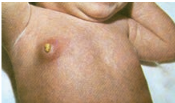
شکل ۳-۶- آبسه پستان نوزاد

۳-۵-۳- عفونت بندناف : بندناف به علت ساختمان خاص خود آمادگی زیادی برای عفونت دارد. استفاده از وسایل کثیف و آلوده و غیراستریل برای بریدن بندناف در موقع تولد، گذاردن مواد آلوده و کثیف بر روی بندناف و پانسمان روزانه غیرضروری آن با وسایل غیراستریل سبب بروز عفونت بندناف می‌شود. علائم، عفونت بندناف، قرمزی اطراف ناف و ترشح چرکی از آن است. عفونت بندناف اگر سریعاً درمان نشود، ممکن است منجر به عفونت خون و مرگ نوزاد گردد.