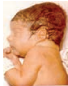
ب) کنسیدگی سر نوزاد در اثر تجمع خون در زیر پوست سر