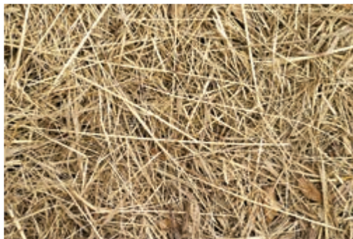
شکل ۵-۸ - کاه

کاه، ساقه باقیمانده گیاه پس از خرمن کوبی و جدا کردن دانه است. عموماً کاه از غلات و گیاهان تیره حبوبات به دست می‌آید. کاه غلات به نوبه خود، هم برای تغذیه و هم برای تهیه بستر دام‌ها به کار می‌رود. این ماده، به علت کمبود پروتئین و داشتن مقدار زیادی سلولز و لیگنین از نظر تغذیه کم ارزش است و فقط برای حجیم شدن غذا به عنوان علوفه در تغذیه دام مورد استفاده قرار می‌گیرند. البته باید توجه کرد که کاه در جیره غذایی طیور مورد مصرف ندارد.