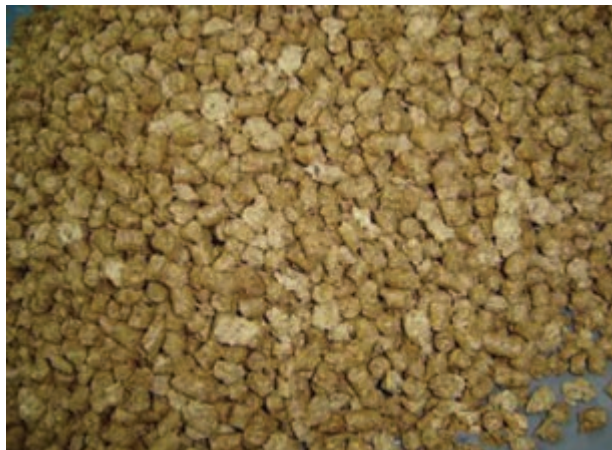
شکل ۹-۸ - کنجاله سویا

به دلیل وجود تعدادی مواد ضد تغذیه‌ای ۱ محدودیت مصرف دارد. هر چند عمل‌آوری با حرارت در حین تولید کنجاله سویا تا حدی از محدودیت مصرف کنجاله سویا می‌کاهد.