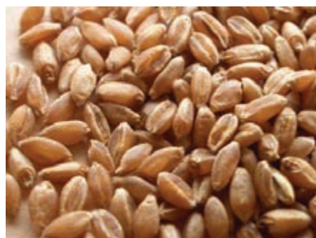
شکل ۸-۸ - گندم

گندم: گندم یکی از منابع اصلی انرژی در جیره‌های طیور است و در دام نیز استفاده می‌گردد. میزان انرژی قابل متابولیسم گندم برای نشخوارکنندگان ۳۲۵۴ کیلوکالری در هر کیلوگرم و برای طیور ۲۹۹۰ کیلوکالری در هر کیلوگرم است. از آن‌جا که گندم برای تهیه نان و بیسکویت استفاده می‌شود مصرف آن در تغذیه دام و طیور در بعضی کشورها محدودیت دارد.