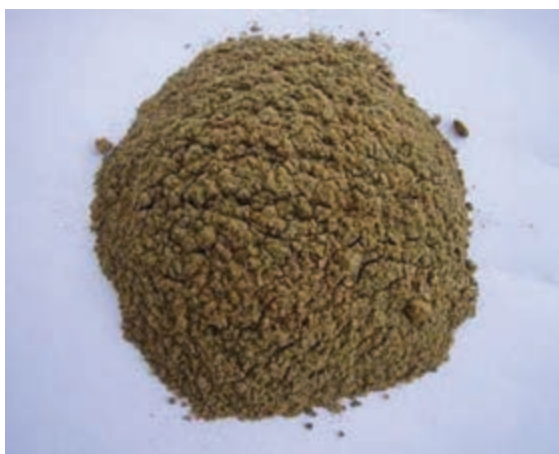
شکل ۱۲-۸ - پودر ماهی

میزان پروتئین پودر ماهی بسته به نوع ماهی از ۶۰ تا ۷۰ درصد متغیر است و از نظر اسید آمینه لیزین و متیونین غنی است. چنانچه از پودر ماهی به میزان زیاد در جیره گاوهای شیری استفاده شود، احتمال اینکه شیر آنها طعم و بوی ماهی بگیرد وجود دارد. همچنین استفاده زیاد آن در طیور باعث ایجاد طعم ماهی در تخم مرغ و گوشت طیور می شود.