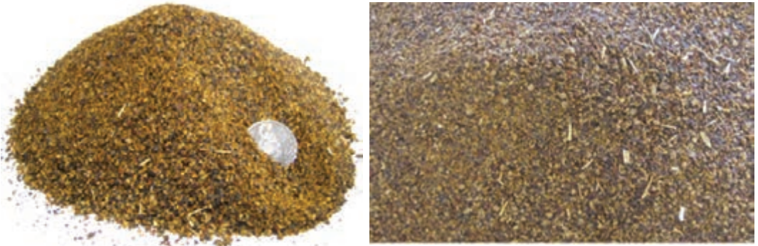
شکل ۱۱-۸- کنجاله کلزا

کنجاله کلزا، می‌تواند باعث ایجاد طعم ماهی و مزه‌های نامطلوب دیگر در تخم مرغ شود. تانن هم به دلیل مقاومت در مقابل آنزیم‌ها، قابلیت هضم آن را کاهش می‌دهد.