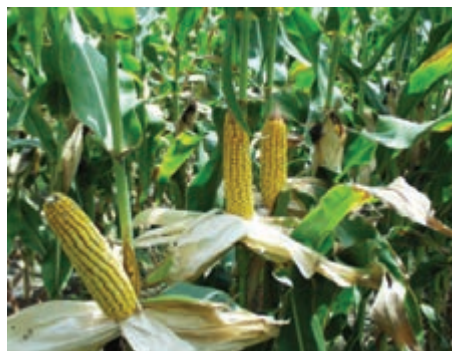
شکل ۶-۸ - ذرت