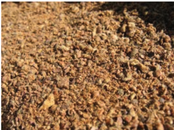
شکل ۱۰-۸ - کنجاله تخم پنبه

کنجاله تخم پنبه حاوی ماده سمی به نام گوسیپول است که مقدار آن به شرایط آب و هوایی، کیفیت خاک و روش روغن‌گیری از تخم پنبه بستگی دارد. گوسیپول می‌تواند در طیور باعث بروز مشکلات هضمی، کاهش خوش‌خوراکی، تغییر رنگ زرده تخم مرغ به سبز زیتونی و کاهش تولید مثل و مسمومیت شود. از این رو مصرف کنجاله تخم پنبه محدودیت دارد. استفاده از سولفات آهن و سایر ترکیبات آن، به دلیل ترکیب شدن آهن با گوسیپول، می‌تواند از اثرات سمی کنجاله تخم پنبه بکاهد. حرارت دادن به کنجاله تخم پنبه نیز می‌تواند از میزان گوسیپول آن بکاهد.