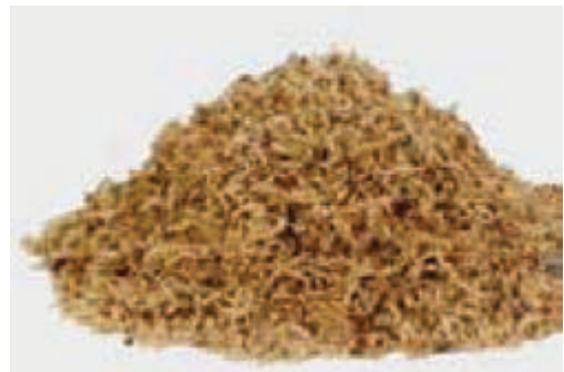
شکل ۴-۸- تفاله چغندر قند

غذاهای حیوانی : از انواع این غذاها که منشأ حیوانی دارند، می‌توان از شیر و مشتقات آن نام