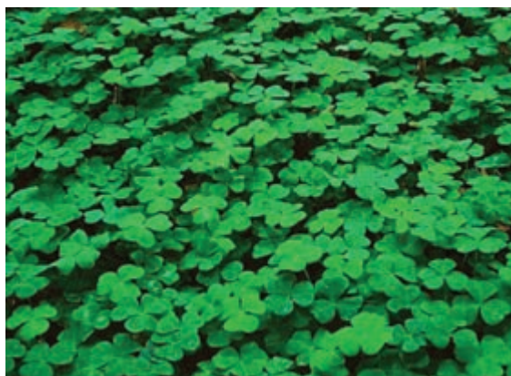
شکل ۲-۸ - شبدر