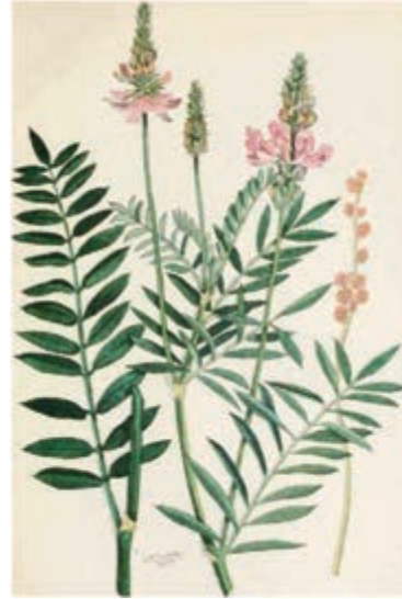
شکل ۳-۸- اسپرس

ب- خانواده گرامینه (گندمیان): مهمترین انواع گیاهان خانواده گرامینه که ممکن است به صورت علوفه سبز مورد مصرف قرار گیرند، عبارت از: ذرت، ذرت خوشه‌ای، جو، گندم و چاودار می‌باشند. اکثر این گیاهان به صورت سبز و کمتر به عنوان علف خشک مورد استفاده قرار می‌گیرند. همچنین از آن‌ها به عنوان سیلو (به ویژه در مورد ذرت) نیز استفاده می‌شود. شاخ و برگ این گیاهان سرشار از کربوهیدرات است ولی از نظر پروتئین فقیرند. لذا بهتر است همراه با یونجه یا سایر گیاهان خانواده بقولات مورد استفاده‌ی دام قرار گیرند.