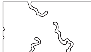
شکل ۱-۴ - تخلخل‌های باز در قطعه

۳-۱-۲-۴- محاسبه چگالی ظاهری، حقیقی و کلی: در قسمت‌های قبلی، چگالی یک ماده را به عنوان رابطه‌ی بین وزن و حجم آن تعریف کردیم. برای یک بدنه‌ی بدون تخلخل، تنها یک وزن و یک حجم وجود دارد. اما در مورد قطعات متخلخل این چنین نیست و حجم‌های متعدد و در نتیجه چگالی‌های متعددی را می‌توان تعریف کرد.