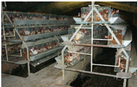
تصویر ۴-۶ - قفس پله ای