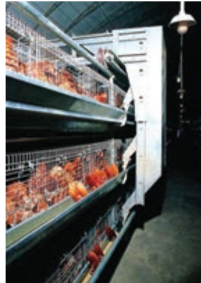
تصویر ۹-۴- دان خوری خودکار

آب خوری های چکه ای و فنجانای می توانند به نحوی نصب شوند که مرغ های دو قفس مجاور از آن استفاده کنند. آب خوری چکه ای مرسوم ترین نوع آب خوری در سیستم قفس است. میزان هدر رفتن آب در این سیستم به حداقل می رسد. به ازای هر ۶ تا ۸ قطعه مرغ تخم گذار باید یک عدد آب خوری چکه ای و به ازای هر ۱۰ تا ۱۲ قطعه مرغ تخم گذار یک عدد آب خوری فنجانای در نظر بگیرید ۴ (تصاویر ۹-۴ و ۱۰-۴).