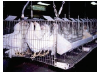
تصویر ۴-۲- قفس مرغ تخم‌گذار