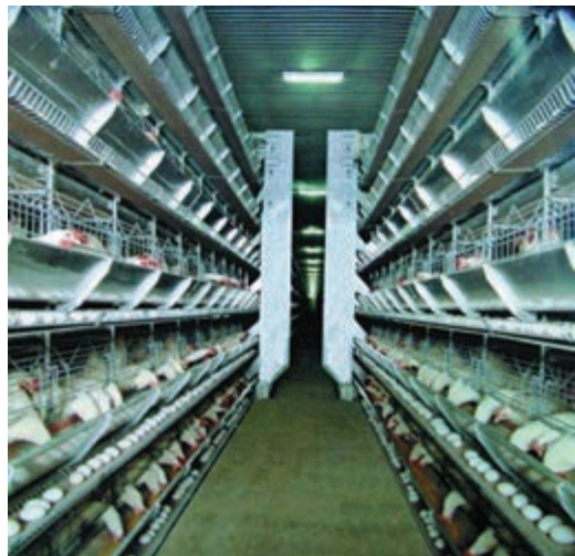
تصویر ۸-۴ - جمع آوری تخم مرغ به روش خودکار