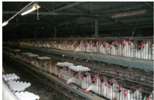
تصویر ۷-۴ - جمع آوری تخم مرغ به روش دستی