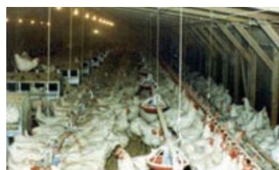
تصویر ۱۱-۴- انواع لانه تخم گذاری