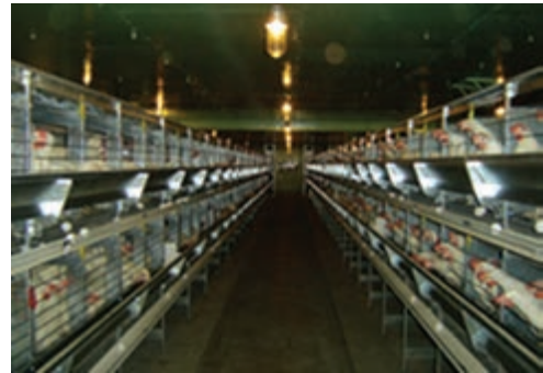
تصویر ۴-۴ - انواع قفس باتری