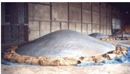
شکل ۲-۴- نحوه نگهداری مواد در انبار