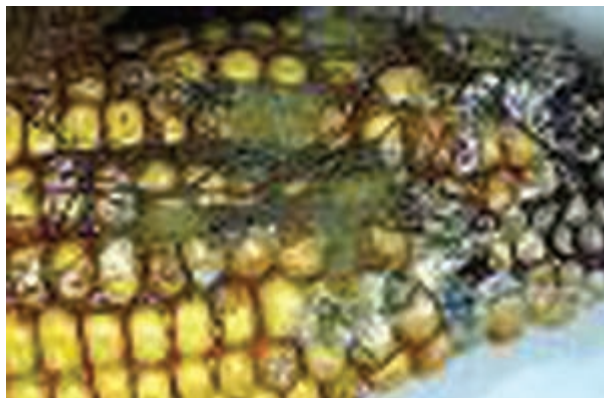
شکل ۴-۶- بلال کپک زده

۴-۶-۱- قارچ کش ها و روش های استفاده از آنها : جداسازی و تمیز کردن، اولین اقدام برای کنترل مواد آلوده به شمار می رود. در مرحله بعد و در صورت وجود آلودگی از قارچ کش ها استفاده نمایید.