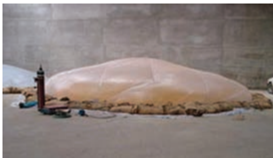
شکل ۳-۴- هوادهی مواد خوراکی

تا آلوده نبودن آن به حشرات، کنه‌ها و آفات محرز گردد. علاوه بر این حداقل هر هفته یک بار محتوی انبار را از نظر وجود احتمالی آفات و امراض بازرسی کنید و در صورت لزوم نمونه‌هایی از آن را برای آزمایش به آزمایشگاه بفرستید.