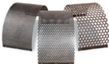
شکل ۳-۳ انواع غربال (توری)