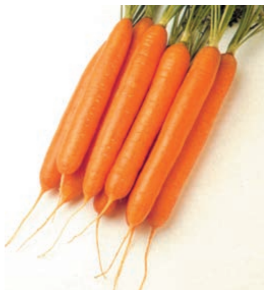
شکل ۱۴-۳- رقم تامبلینا