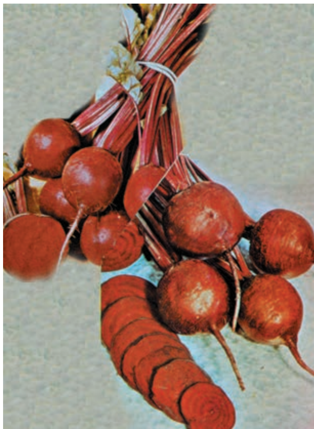
شکل ۳۲-۳- الف

– گفته می‌شود خام آن به اندازهٔ عسل خاصیت دارد، پاک‌کنندهٔ دستگاه گوارش است و به هضم غذا کمک می‌کند. سودمندترین اعضای چغندر، بعد از ساقه و غدهٔ آن، برگ است (شکل ۳۲-۳- الف).