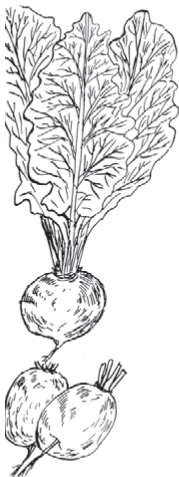
شکل ۳-۳۲ ب