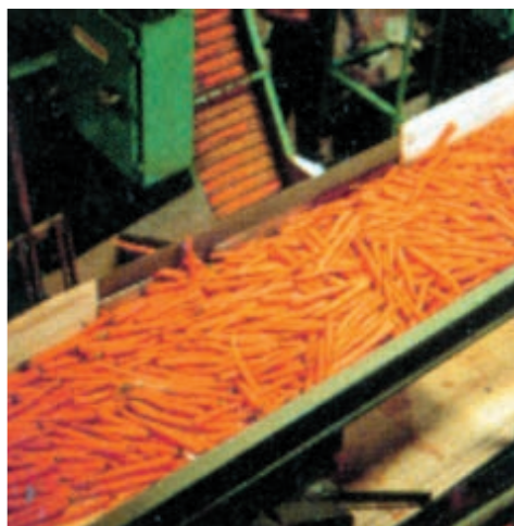
شکل ۲۰-۳- درجه بندی به وسیله دستگاه را نشان می‌دهد.

۴-۵-۲- درجه‌بندی: ریشه‌ها را با جداکردن درشت از ریز و آسیب‌دیده از سالم، درجه‌بندی نمایید (شکل ۲۰-۳).