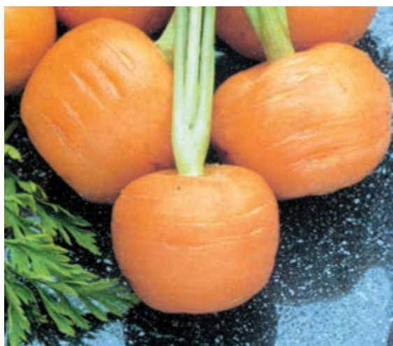
شکل ۱۵-۳- هالی پی اس