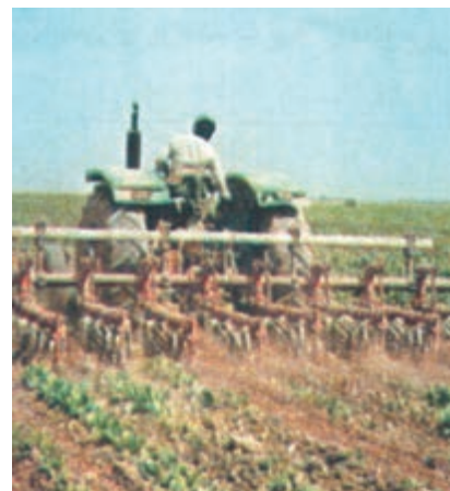
شکل ۲۲-۳- وجین علف‌های هرز با استفاده از ماشین مرکب سله‌شکنی و وجین‌کن

۳- تراکتور را طوری وارد مزرعه کنید که چرخ‌های آن در بین ردیف‌ها قرار گیرد و به گیاه اصلی صدمه وارد نسازد. تراکتور را به طور اصولی و صحیح و با سرعت مناسب، در مزرعه به حرکت درآورید تا عمل سله‌شکنی و وجین انجام شود (شکل ۲۲-۳). گزارش کار این فعالیت‌ها را به مربی خود تحویل دهید.