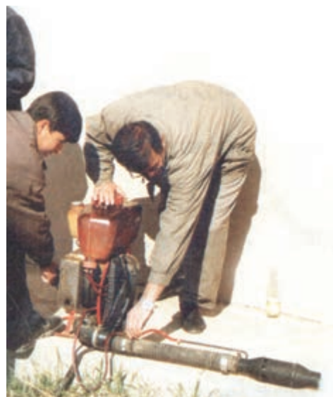
شکل ۲۵-۳- آماده سازی و روشن کردن شعله افکن

۷- گاز دستگاه را به میزان مورد نیاز تنظیم نمایید.