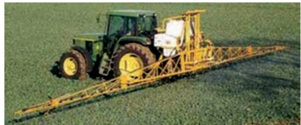
شکل ۳۱-۳- سم‌پاش پشت تراکتوری بوم‌دار

لازم است سالیانه حداقل یک‌بار سم‌پاش را، چنان‌که توضیح داده شد، برای تنظیم میزان خروجی، کالیبره نمایید. از این نوع سم‌پاش در ایران برای مبارزه با علف‌های هرز مزارع بزرگ استفاده می‌شود (شکل ۳۱-۳).