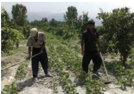
شکل ۳-۲۱- وجین علف‌های هرز با استفاده از وسایل دستی

۴- علف‌های هرز را از محصول اصلی تشخیص دهید و آنها را با استفاده از ابزار، از خاک خارج کنید (شکل ۳-۲۱).