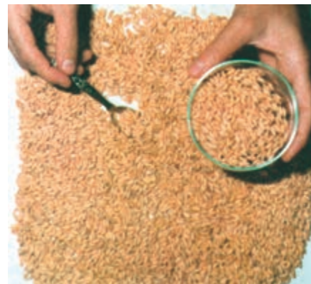
شکل ۲۰-۳- بذور عاری از علف هرز

(الف) استفاده از بذور عاری از بذور علف هرز (شکل ۲۰-۳):