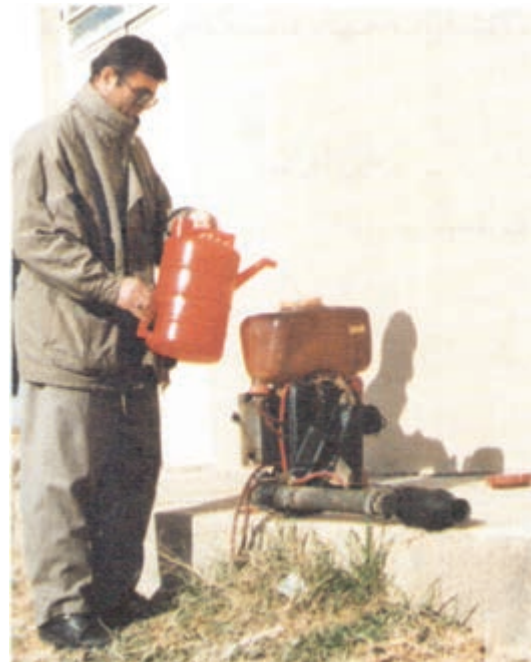
شکل ۲۴-۳- پر کردن مخزن شعله افکن