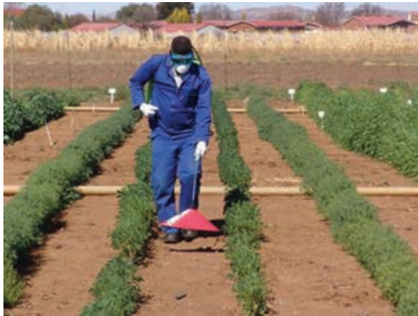
شکل ۲۳-۳- کنترل علف‌های هرز با استفاده از گرما

۴-۸-۳- کنترل فیزیکی علف‌های هرز: برای کنترل فیزیکی علف‌های هرز از گرما و آتش استفاده می‌شود. (شکل ۲۳-۳).