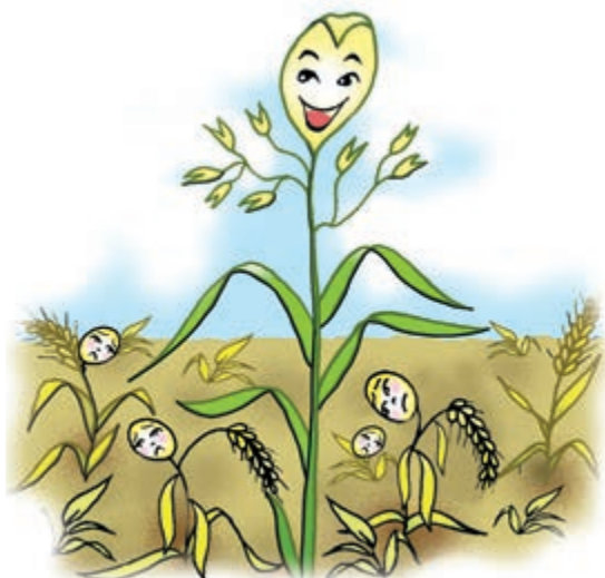
شکل ۵-۲ - غلبه علف هرز بر زراعت

الف - دسته‌ای از گیاهان مثل ارزن در مقابل علفهای هرز قادر به رقابت نیستند و موجب افزایش علفهای هرز می‌شوند که به آنها از نظر توسعه علفهای هرز «کتیف‌کننده» می‌گویند (شکل ۵-۲).