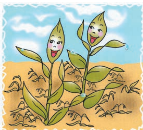
شکل ۵-۳ - بعضی از گیاهان خفه‌کننده علفهای هرز هستند.

ب - دسته دیگری از گیاهان با رشد سریع و غلبه بر علفهای هرز موجب کاهش رشد و توسعه آنها می‌شوند به این گونه گیاهان «خفه‌کننده علف هرز» می‌گویند مثل جو و گندم سیاه (شکل ۵-۳). ج - دسته‌ای از گیاهان به تمیزکننده علف هرز یا گیاهان وجینی معروف‌اند که به دلیل رشد کند این گیاهان، زارعین مجبور به مبارزه و دفع علفهای هرز (وجین) در این گونه زراعتها می‌باشند. به همین دلیل در این گروه از گیاهان علفهای هرز به مقدار زیادی از بین برده می‌شود (شکل ۵-۴).