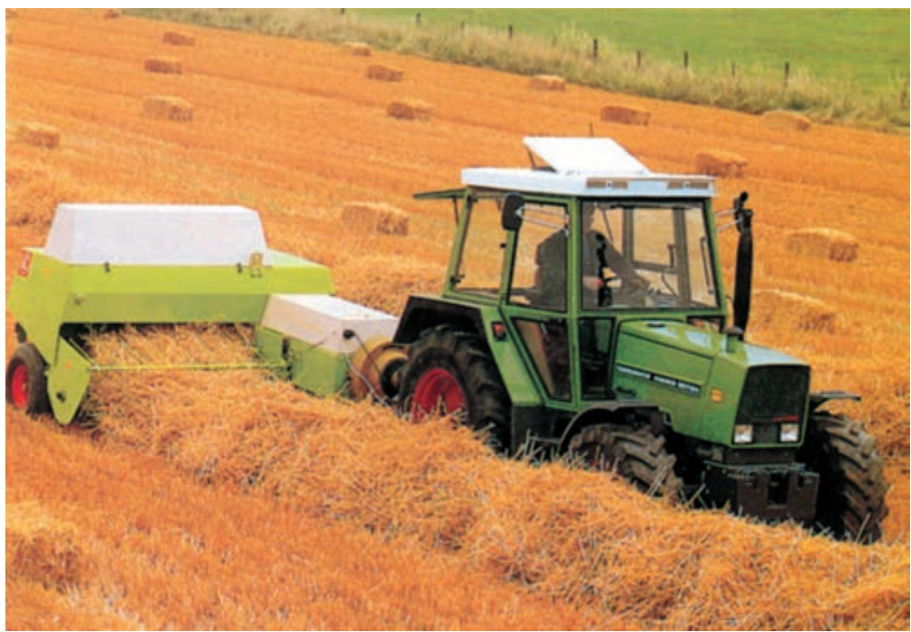
شکل ۵-۵- باقیمانده کاه و کلش در زراعت پس از جمع‌آوری بسته‌های کاه

د- در انواع گیاهان زراعی، علفهای هرز همزیست خاصی وجود دارد؛ مثلاً در گیاهان آب‌دوست، انواع خاص علف هرز مثل سوروف گسترش می‌یابد در حالی که در گیاهانی مثل یونجه و سبزیجات، انگل (سس) بخوبی تکثیر و توسعه پیدا می‌کند. در تناوب، از کشت پیاپی یک گروه مشابه باید خودداری شود. ۵- میزان آب: چون نیاز آبی گیاهان متفاوت است طبعاً یکی از عوامل مؤثر در تعیین نوع زراعت میزان آب خواهد بود. در صورت وجود آب فراوان، سطح زیر کشت گیاهان آب‌دوست مثل نیشکر، برنج، یونجه و پنبه افزایش خواهد یافت و این‌گونه