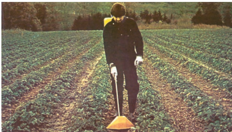
شکل ۵-۴ - کنترل علفهای هرز در کشتهای ردیفی و زراعتهای وجینی