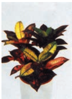
۲-۶ - اکتون C.V Mrs. Iceton (شکل ۳-۲-۵).