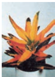
۲-۵ - ستاره طلا C.V gold Star (شکل ۳-۲-۴).