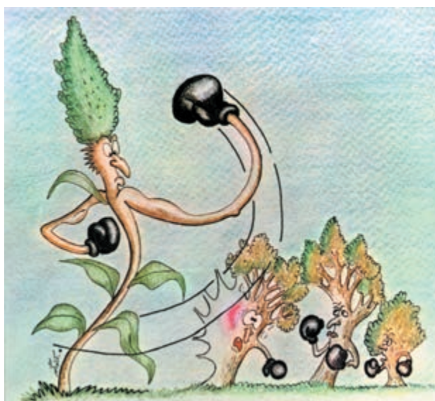
شکل ۴-۴- غلبه علف هرز بر بعضی از گیاهان

۴- افزایش علفهای هرز: در اثر کشت تک محصولی، علفهای هرز گیاهان میزبان به نحو مؤثری افزایش می یابد. در حالی که با تغییر گیاه میزبان شرایط مناسب رشد علفهای هرز نیز از بین خواهد رفت مثلاً رشد و توسعه یولاف در کشت ممتد گندم (مثال دیگری را شما ارائه نمایید) (شکل ۴-۴).