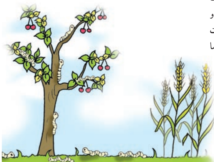
شکل ۳-۴- افزایش آفات و بیماریها

۳- افزایش آفات و بیماریها: کشت ممتد یک گیاه باعث تجمع آفات و بیماریهای بخصوصی باتوجه به شرایط مساعد و وجود میزبان مناسب در طول سالهای پیایی خواهد شد مثل آفت کرم ساقه خوار برنج یا بوته میری جالیز (حداقل دو مثال نیز شما ارائه نمایید) (شکل ۳-۴).