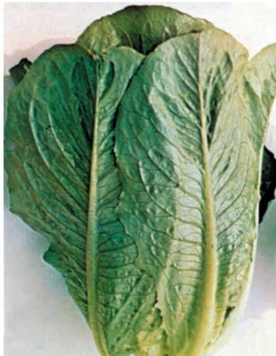
شکل ۶۱-۱- الف

برگها: بدون دمبرگ با قاعده نسبتاً پهن (رگبرگ و سطحی در قاعده بسیار پهن است) بر روی ساقه چسبیده و اغلب بر روی آن تا شده است و گویچه ای را به وجود می آورد. برگهای درونی کمرنگ تر، زرد، کرم یا زرد مایل به سبز می باشند. برگهای بیرونی به رنگ سبز تیره یا سبز مایل به خاکستری است. برگها، نرم، آبدار، شیرابه دار، خوشمزه و کمی شیرین می باشند که خوراکی هستند (شکل ۶۱-۱).