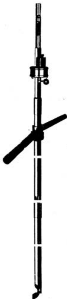
شکل ۵-۳- سوند فستوکسین برای قرص گذاری در داخل توده غله

۴- در انبارها از ترکیبات هیدروژن فسفره مثل قرصهای فستوکسین نیز می‌توان استفاده نمود. در انبارهای سرپوشیده و یا زیر چادرهای پلاستیکی به ازای هر تن محصول مثل گندم، جو، برنج و ... ۳ تا ۶ قرص کافی است این قرصها بسرعت و حداکثر