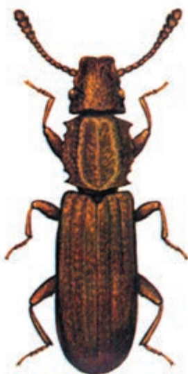
شکل ۳-۱۰ - شپشه دندان‌دار

خسارت این آفت در درجه اول متوجه دانه و آرد غلات است اما به خشکبار مثل کشمش، بادام، گردو و میوه خشک نیز خسارت وارد می‌نماید.