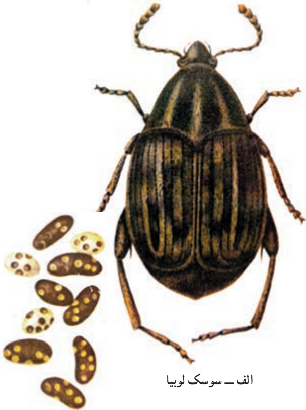
الف - سوسک لوبیا

۷- سوسک لوبیا: حشره کامل به رنگ خاکستری و به طول ۲ تا ۴/۵ میلی‌متر است. در اواخر زمستان در انبارها ظاهر می‌شود. تخم‌ریزی این حشره بیشتر در انبار صورت می‌گیرد. لاروها پس از تغذیه محصول و تبدیل حشره کامل به مزارع نیز حمله کرده، موجب خسارت می‌شوند (شکل ۱۴-۳) در سال قادر به تولید چند نسل است. این آفت در درجه اول به لوبیا خسارت می‌زند اگر لوبیا موجود نباشد به سایر دانه‌های حبوبات حمله می‌کند.