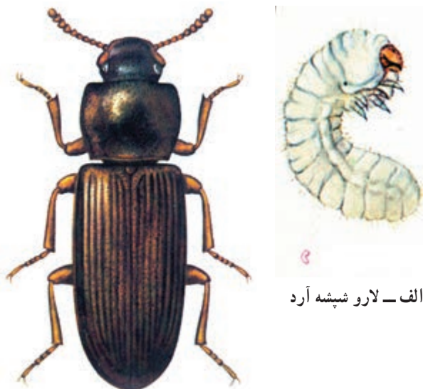
الف - لارو شپشه آرد

۴- شپشه آرد: سوسکی است کوچک به رنگ قهوه‌ای مایل به قرمز تا قهوه‌ای تیره و به اندازه ۴ تا ۴/۵ میلیمتر، تخم‌ریزی آفت، گسترده است و هر حشره ماده در روز ۲ تا ۳ عدد و در طول زندگی ۵۰۰ تا ۱۰۰۰ عدد تخم می‌گذارد. تخمها چسبیده‌اند و با محصول و حتی کیسه‌ها جابجا می‌شوند (شکل ۱۱-۳). محدودۀ فعالیت این آفت در ۱۲ تا ۳۵ درجه حرارت است. لاروها پوست‌اندازی دارند و پوسته‌ها و فضولات حشره، باعث کاهش کیفیت محصول می‌شود. خسارت در درجه اول متوجه مواد نرم مثل آرد و سبوس غلات است و علاوه بر آن به دانه‌های کتان، کنجد و بادام‌زمینی نیز خسارت می‌زند.