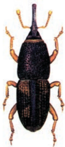
ب - شپشه برنج

بیشترین علاقه این آفت به برنج است اما از دیگر غلات نیز استفاده می‌نماید. ارزش غذایی برنج را از بین می‌برد و بعضی مواقع حتی محصول را غیرقابل استفاده می‌نماید.