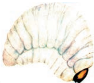
الف - لارو شپشه برنج

۲- شپشه برنج: حشره کامل به رنگ قهوه‌ای مایل به سیاه و به طول ۲/۵ تا ۴ میلیمتر است. دارای بالهای ریز و قادر به پرواز است (شکل ۳-۹).