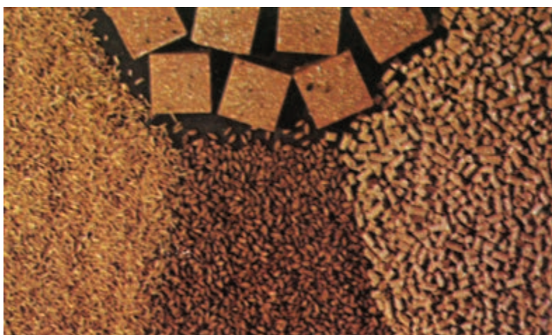
شکل ۱۶-۳- طعمه آماده مصرف «کلرت» به صورت‌های پلت (PELLET)، مکعبهای روغنی (WAX BLOCK) و ... برای استفاده در شرایط مختلف مناسب می‌باشد.

طرز تهیه: گندم یا ذرت یا دانه خربزه را در ظرفی ریخته روغن کتان را بتدریج روی آن بریزید و با چوب به هم بزنید تا دانه‌ها به‌طور یکنواخت به روغن آغشته گردد. سپس بتدریج فسفر دوزنگ را روی دانه‌ها بریزید به طوری که دانه‌ها به سم آغشته گردد و بلافاصله طعمه را برای کنترل مورد استفاده قرار دهید (شکل ۱۶-۳).