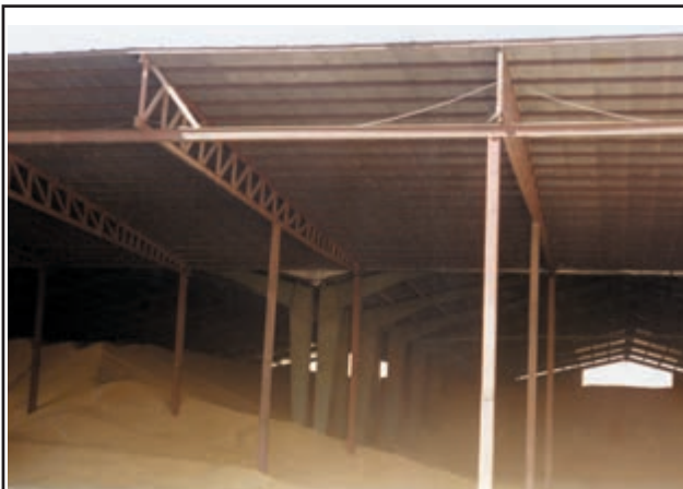
شکل ۲-۳- یک نوع انبار