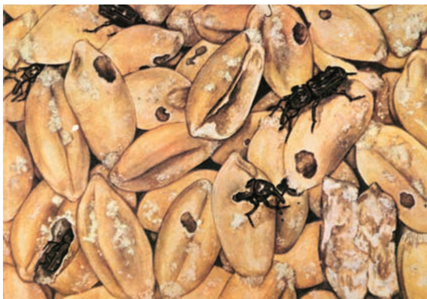
شکل ۸-۳- خسارت آفات روی محصول