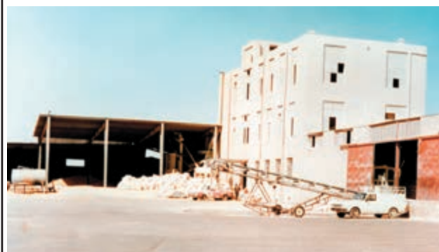
شکل ۳-۳- نوع دیگر انبار