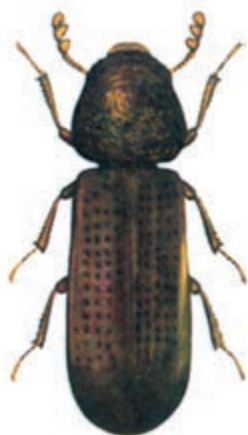
شکل ۱۲-۳- ریزوپرتا

۵- ریزوپرتا: سوسکی است به طول ۲/۵ میلیمتر و دارای رنگ قهوه‌ای مایل به عنابی براق دارای چند نسل در سال و بیشتر در نواحی گرمسیری فعالیت دارد (شکل ۱۲-۳). لاروهای جوان این حشره، به دانه‌های شکسته و آسیب دیده در اثر حمله دیگر آفات خسارت وارد می‌کنند اما در سنین بالا بیشتر از دانه‌های سالم تغذیه می‌کنند. این آفت به دانه غلات و حتی نان و بیسکویت نیز خسارت وارد می‌نماید.