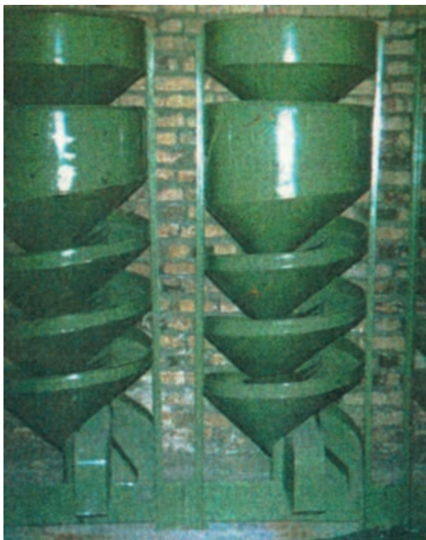
شکل ۱-۳- یک نوع دستگاه بوجاری

۵- محصول آغشته و آلوده به حشرات و امراض برای کنترل رطوبت و حرارت قبل از انبار کردن می‌توان با برداشت بموقع، هوا دادن و حمل بموقع محصول تا حدود زیادی شرایط مساعد را فراهم نمود.