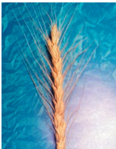
شکل ۱-۳۵ - گندم اینیا ۶۶

پیمانۀ مهاتتی: انتخاب ارقام مناسب گندم و جو برای کشت شماره شناسایی: ۱۱-۱-۷۴/ک