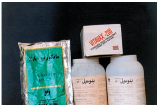
شکل ۱-۵۹- انواع سموم ضد عفونی کننده گندم

مهارت: کشت گندم و جو شمارۀ شناسایی: ۱۱-۱-۷۴/ک