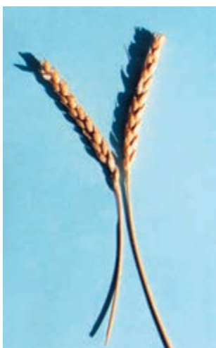
شکل ۳۰-۱- سفیدک