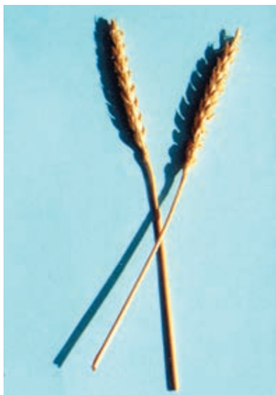
شکل ۱-۳۴ - بزوستایا

گندم آرژانتین: مبدأ آن کشور آرژانتین، سنبله آن بدون ریشک، زردرنگ، ارتفاع بوته متوسط، زودرس، رنگ دانه زرد و درشت می باشد. گندمی است که در برابر سرما حساس و نسبت به خوابیدگی، گرما، ریزش دانه و بیماریهای قارچی مقاوم است. وزن هزار دانه بین ۴۰ تا ۵۰ گرم، عملکرد، ۳ تا ۵ تن در هکتار و مناسب کاشت در مناطق گرم و معتدل است (شکل ۱-۳۳).