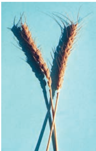
شکل ۲۹-۱- شاه پسند

گندم شاه پسند: سنبله ریشک دار، اندازه بوته بلند، رنگ دانه سفید مایل به قرمز، گندمی پاییزه، دیررس، مقاوم در برابر ریزش و خوابیدگی و نسبت به زنگها و سیاهکها و خشکی حساس است. ارزش نانوایی آن خوب نیست. (شکل ۲۹-۱)