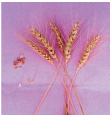
شکل ۴۹-۱- گندم C-73-20