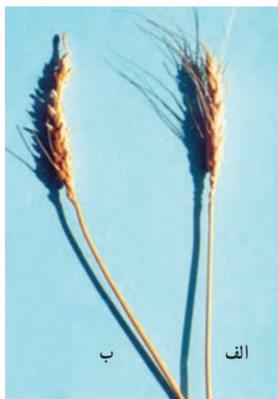
شکل ۵۳-۱- الف- گندم مقاوم در برابر ریزش، ب- گندم حساس نسبت به ریزش