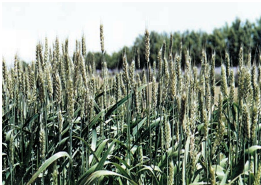
شکل ۵۱-۱- گندم نوید

ارقامی از گندمهای اصلاح شده خارجی و ایرانی