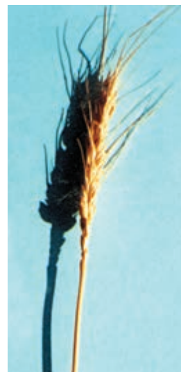
شکل ۴۸-۱- کرج ۲