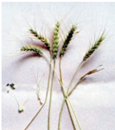
شکل ۵۰-۱- گندم گلینسون

مهارت: کشت گندم و جو شمارۀ شناسایی: ۱-۱۱-۱-۷۴/ک