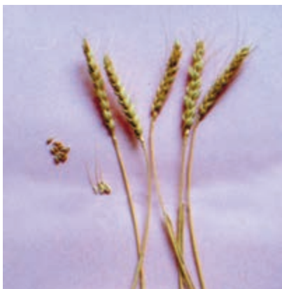
شکل ۱-۳۱ - گندم بکراس - روشن

پیمانۀ مهارتی: انتخاب ارقام مناسب گندم و جو برای کشت شماره شناسایی: ۱۱-۱-۷۴/ک