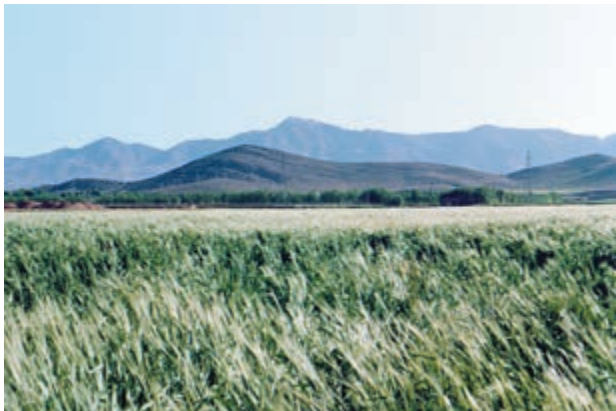
شکل ۵۲-۱- خوابیدگی در گندم

پیمانه مهارتی: انتخاب ارقام مناسب گندم و جو برای کشت شماره شناسایی: ۱۱-۱-۷۴/ک