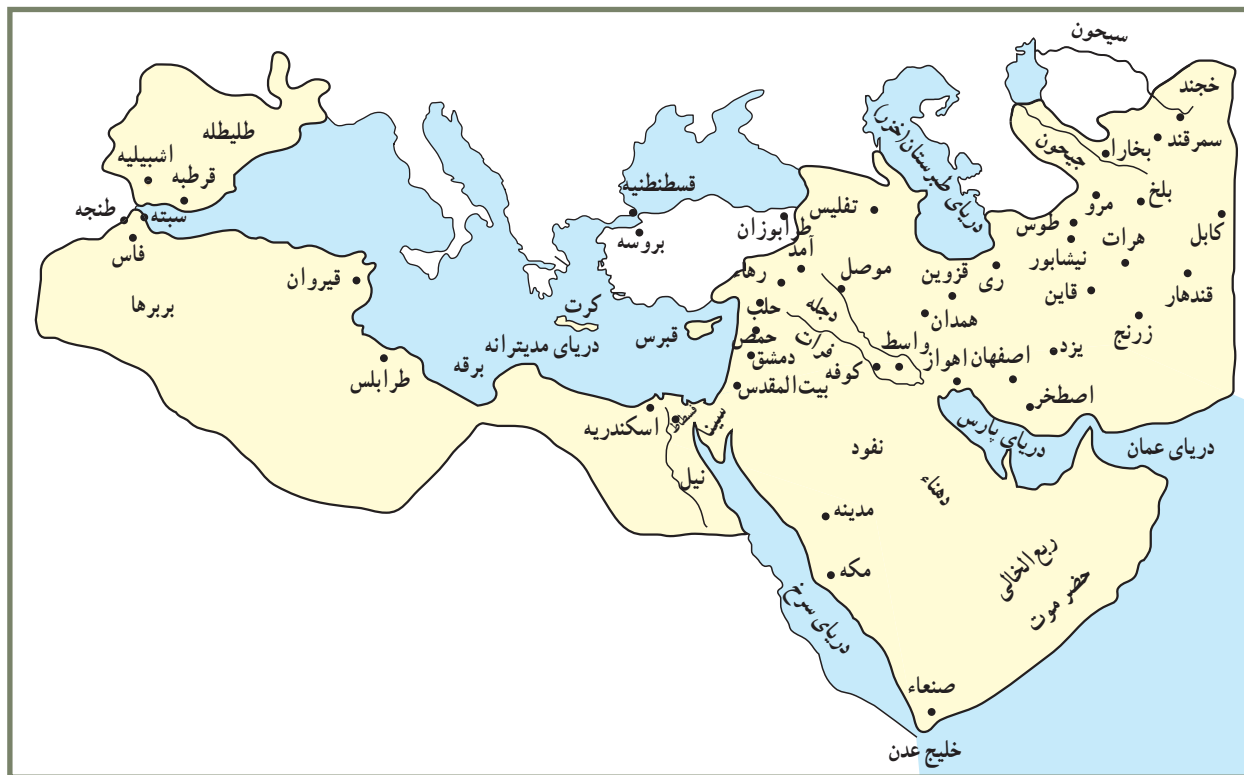
قلمرو مسلمانان در دوره بنی‌امیه

در جبهه غربی، ادامه فتوحات شمال آفریقا، سرانجام به فتح اندلس (اسپانیا) در سال ۹۲ ق انجامید.