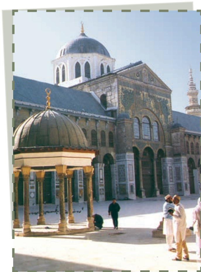
مسجد اموی - دمشق