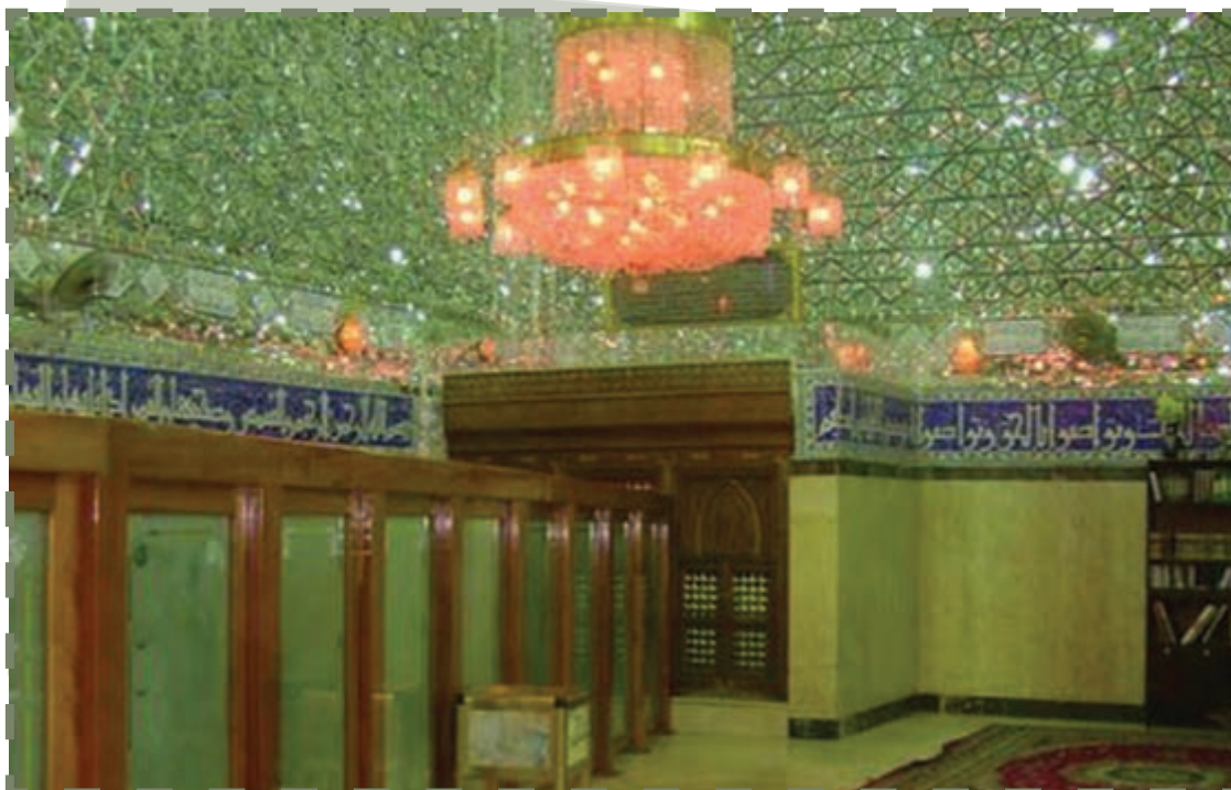
آرامگاه مختار در کنار مسجد کوفه