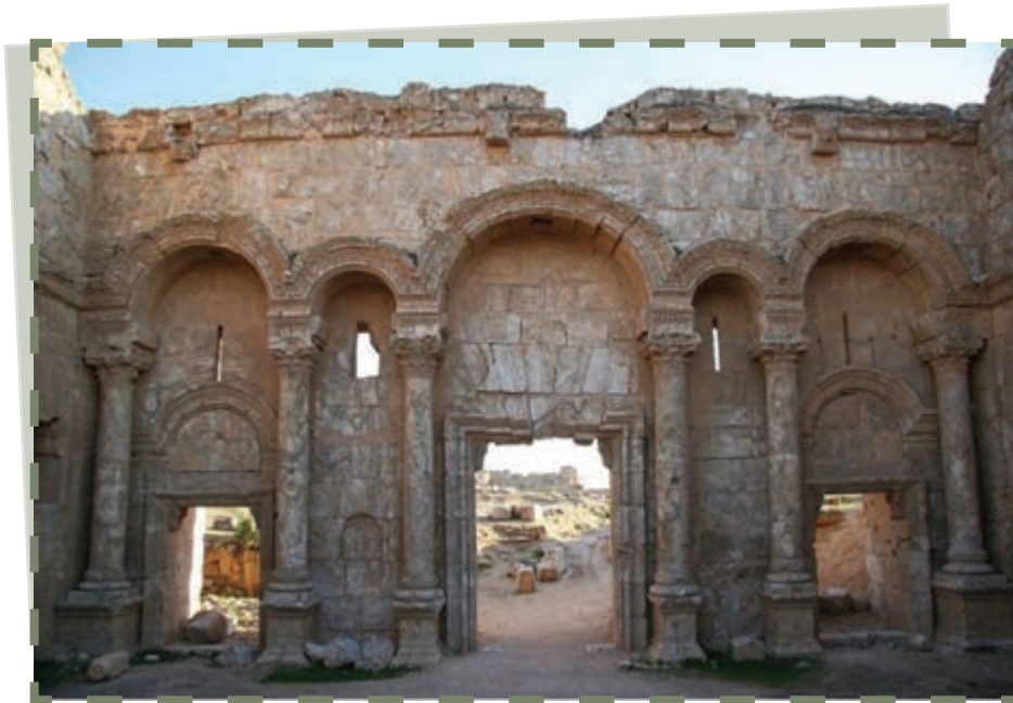
دروازه کاخ هشام بن عبدالملک در شهر رقه بر ساحل فرات

سه جنایت بزرگ را مرتکب شد. حاکمان شاخه مروانی بنی امیه نیز همان رویه سیاسی آمیخته با ستم را ادامه دادند و هر فریاد اعتراضی را به بدترین و بی رحمانه ترین شکل سرکوب کردند.