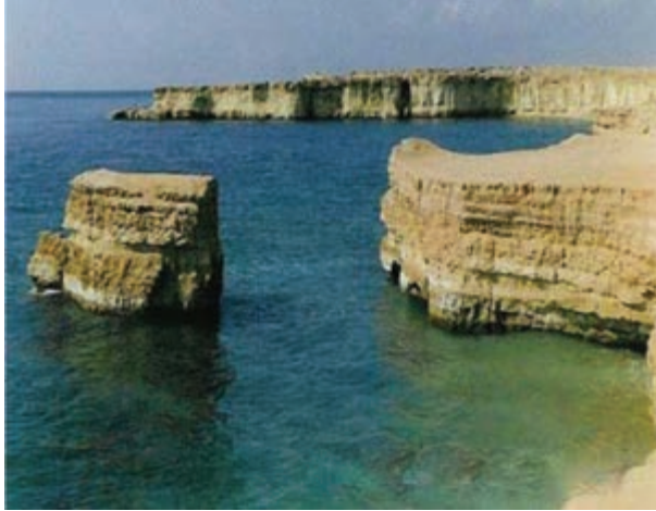
شکل ۳-۱- سواحل جنوبی ایران

کره خاکی تنها مکان مناسب برای سکونتگاه بشر بر روی سیاره زمین می باشد. خارجی ترین بخش زمین معمولاً از خاک تشکیل شده است. خاک محصول هوازدگی و فرسایش سنگ هاست و محل رویش گیاهان می باشد (شکل ۴-۱). پس غذای انسان و تعداد زیادی از موجودات زنده وابسته به خاک است.