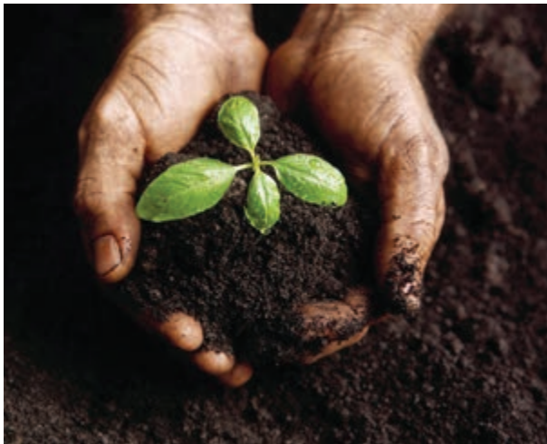
شکل ۴-۱- خاک محل رویش گیاه

کره خاکی تنها مکان مناسب برای سکونتگاه بشر بر روی سیاره زمین می باشد. خارجی ترین بخش زمین معمولاً از خاک تشکیل شده است. خاک محصول هوازدگی و فرسایش سنگ هاست و محل رویش گیاهان می باشد (شکل ۴-۱). پس غذای انسان و تعداد زیادی از موجودات زنده وابسته به خاک است.