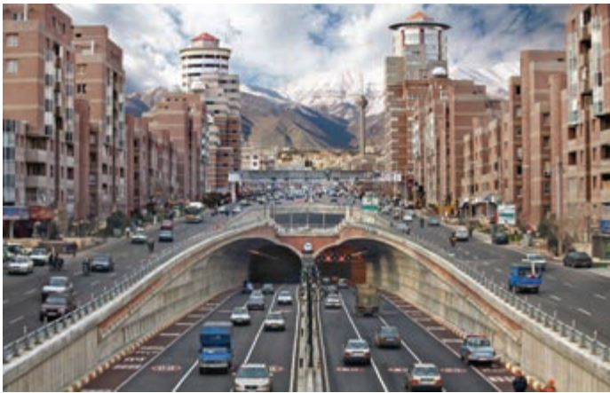
شکل ۹-۱- ورودی تونل توحید - تهران

امروزه جهت احداث انواع پروژه‌های عمرانی مانند سدها، نیروگاه‌ها، بزرگراه‌ها، بیمارستان‌ها، مکان‌یابی شهرک‌ها، مجتمع‌های تجاری و مسکونی، آسمانخراش‌ها و ... همه نیازمند شناخت جنس و ساختار تشکیل دهنده زمین پی آن است. پس برای در امان ماندن از پدیده‌های طبیعی مانند زمین‌لرزه، رانش زمین، سقوط سنگ و غیره باید خصوصیات زمین را بطور جدی بررسی کرد. امروزه اهمیت این موضوع تا آن حد است که حضور کارشناس زمین‌شناس در شهرداری‌ها و محیط زیست قطعی و اجتناب‌ناپذیر می‌باشد (شکل ۹-۱).