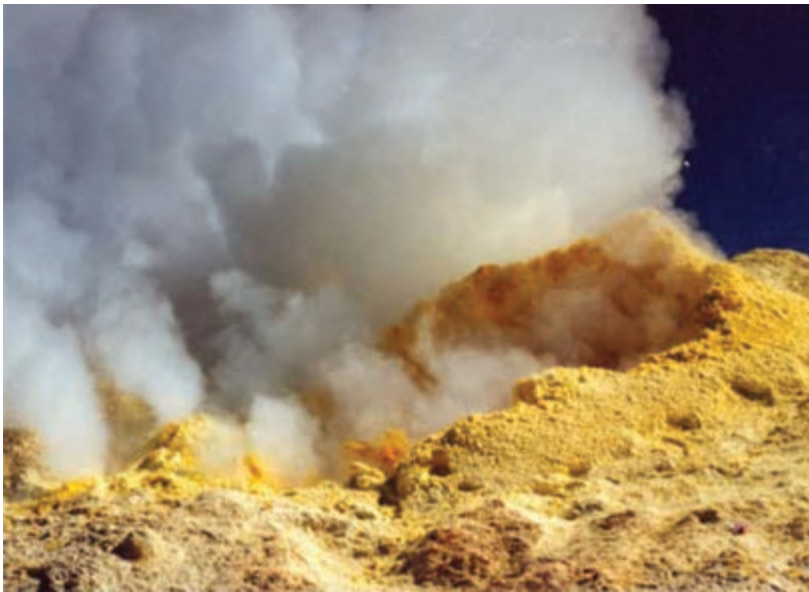
شکل ۱۱-۱ دهانه اصلی آتشفشان تفتان

شاید اینک پذیرفته باشید که برای زندگی بر روی کره زمین لازم است تا حدی با خصوصیات کره زمین در قالب درس زمین‌شناسی آشنا شوید.