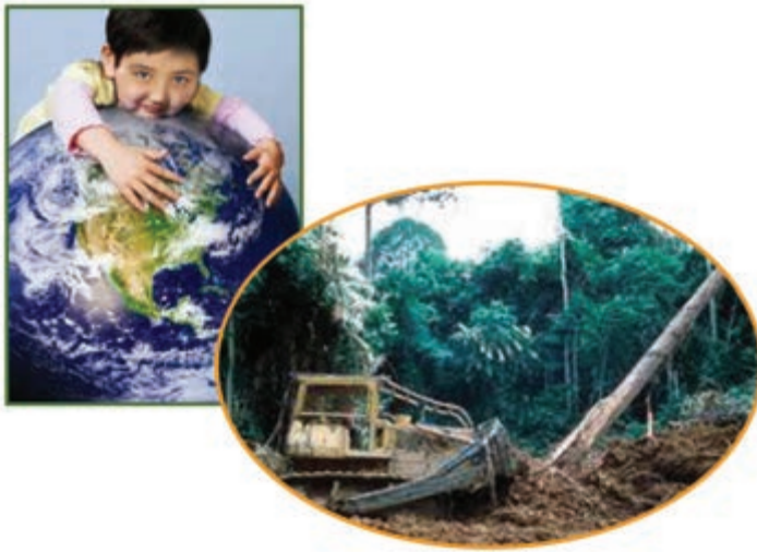
شکل ۱-۱- تخریب و حفاظت از محیط زیست

آیا بشر مجاز است، به هر میزان که می‌خواهد گازهای آلاینده تولید نماید؟ چرا باید دمای زمین به صورت غیرعادی افزایش یابد؟ آیا حق استفاده بی‌رویه از سفره‌های آب زیرزمینی را دارد؟ حجم زباله‌های دفن شده در خاک باید چه مقدار باشد؟ همه و همه نیاز به بازنگری مجدد رفتار بشر در مواجهه با کره زمین دارد. در همین رابطه سازمان علمی - فرهنگی یونسکو، سال ۲۰۰۸ میلادی را سال سیاره زمین نامگذاری کرد، هدف از این اقدام، توجه انسان‌ها به کره زمین به عنوان تنها مکان برای زندگی است که استفاده نادرست از آن موجب نابودی زمین خواهد شد.