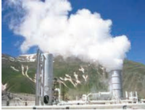
شکل ۷-۱- نیروگاه زمین گرمایی مشکین شهر - اردبیل

استفاده از مواد معدنی تنها محدود به همین موارد نمی گردد. اگر به اطرافمان خوب نگاه کنیم، مثلاً مدادی که با آن می نویسیم، عینکی که به کمک آن می بینیم، وسایلی که با آن زندگی می کنیم، داروهایی که برای التیام دردهایمان از آن استفاده می کنیم و حتی خمیردندانی که هر روز از آن استفاده می کنیم، همه و همه در گروه موادی است که از زمین استخراج می شود.