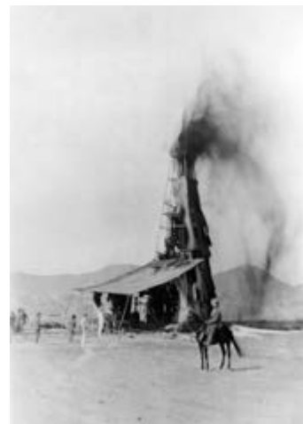
شکل ۸-۱- الف - فوران نفت از اولین چاه نفت خاورمیانه در سال ۱۹۰۸م - مسجد سلیمان