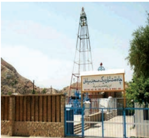
شکل ۸-۱- ب - موزه نفت در محل اولین چاه نفت خاورمیانه -

هیچ با خود اندیشیده اید، که اگر این معادن شناخته نشده بودند آیا زندگی بر روی کره زمین به این سادگی مقدور بود؟ خوشبختانه کشور ایران از جمله کشورهای معدنی جهان است که دارای معادن متعدد آهن، مس، سرب و روی، طلا و ... است. همچنین بیش از صدسال قبل تاکنون با کشف نفت در حوالی مسجدسلیمان اقتصاد کشورمان متوجه این نعمت خدادادی شده است (شکل ۸-۱- الف و ب). این قابلیت ها سبب گردیده تا ایران در بین کشورهای جهان، کشوری قدرتمند و تأثیرگذار باشد.