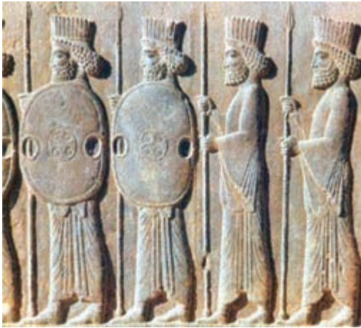
شکل ۱-۵- ادوات نظامی هخامنشیان

انواع ذخایر معدنی فلزی و غیرفلزی از دیگر ویژگی‌های بخش بیرونی پوسته زمین است که آگاهی نسبی از نحوه تشکیل آنها نیاز به کسب تخصص در رشته زمین‌شناسی دارد. توجه به ذخایر معدنی در ایران به هزاران سال قبل بازمی‌گردد. به عنوان مثال ایرانیان در زمان هخامنشیان با دسترسی به ذخایر سنگ آهن، از آن در ساخت وسایل و ابزار جنگی بهره جسته و بدین طریق از سرزمین پهناور ایران در مقابل هجوم بیگانگان محافظت کردند (شکل ۱-۵).