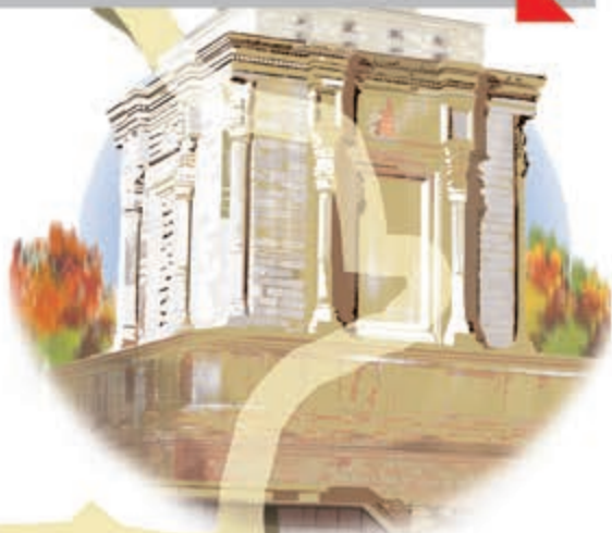
اینجا، آرامگاه سعدی شیرازی است.