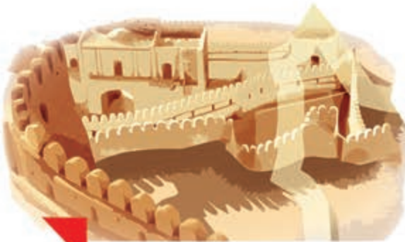
اینجا، آرگِ بَمِ کرمان است.