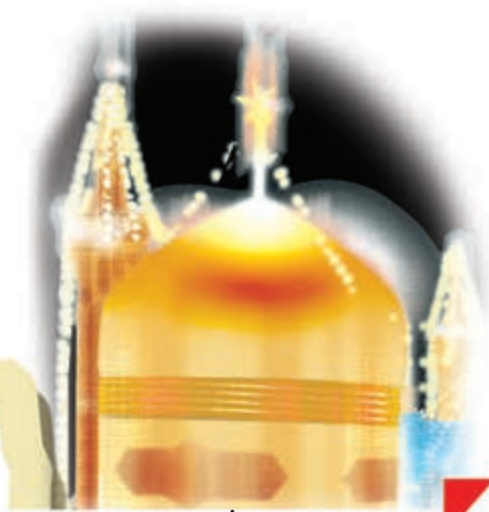
اینجا، حَرَمِ امام هشتم، حضرت رضا (ع) در شهر مشهد است.