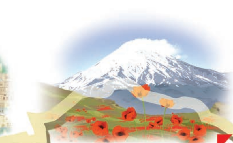
این، قلّهِ زیبای دماوند است.