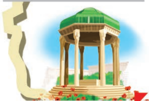
اینجا آرامگاه حافظ شیرازی است.