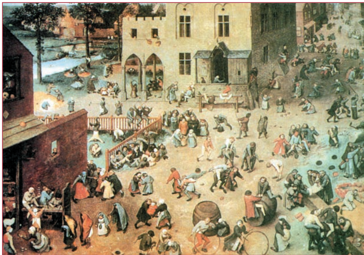
نمونه‌هایی از بازی‌های دوره رنسانس

ضعیف شدن فتودالیسم: فتودال‌ها اگرچه از این وضع ناراضی بودند اما کم‌کم توان مقابله با آن را از دست دادند. اتکای اصلی آنان به نیروی نظامی جنگجوی خود یعنی شوالیه‌ها بود که شوالیه‌ها هم، به دلیل شکست در جنگ‌های صلیبی، اعتبار خود را از دست داده بودند. بقایای نیروهای فتودال‌ها نیز صرف جنگ با فتودال‌های رقیب می‌شد. در نتیجه فتودالیسم در اروپا تضعیف شد. پادشاهان از فتودال‌ها می‌خواستند مالیات بپردازند و این مالیات را هم به صورت پول پرداخت کنند. لازمه به دست آوردن پول مراجعه به بازرگانان و بانکداران شهرها بود. این وضع سرانجام به برتری اقتصاد شهرنشینی بر اقتصاد فتودالی منجر شد و اشراف شهرنشین را از مقام و موقعیت ویژه‌ای برخوردار ساخت. در این دوره فتودال‌ها