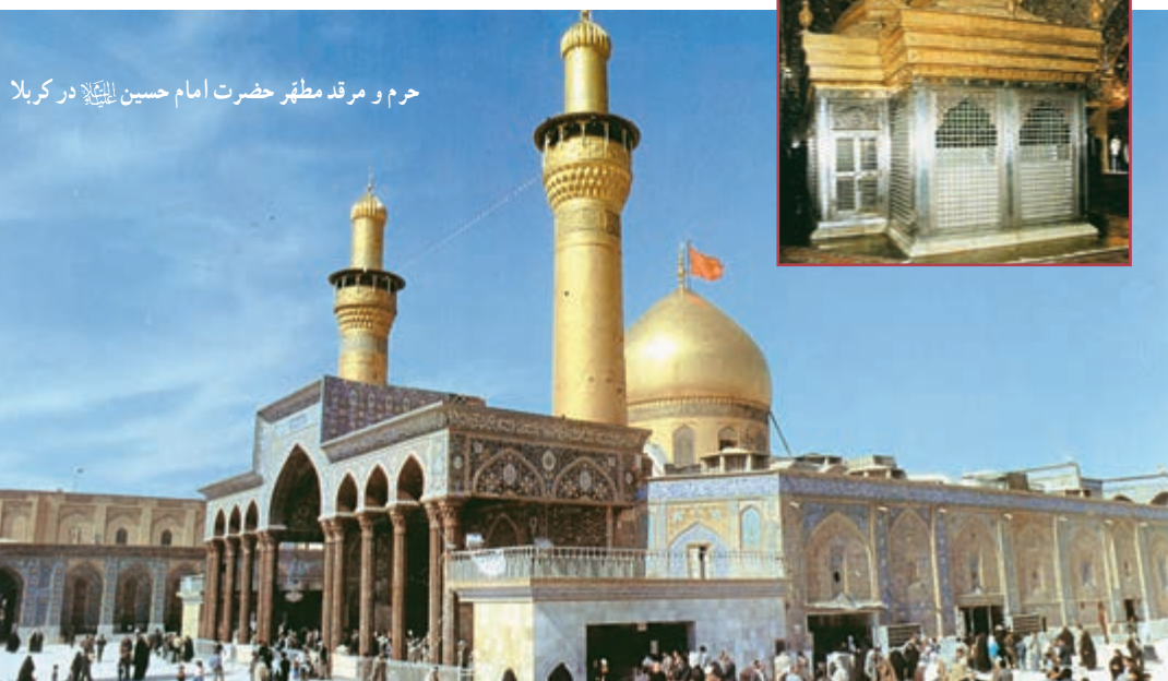
حرم و مرقد مطهر حضرت امام حسین علیه السلام در کربلا

امام در مسیر خود به کوفه در حالی خبر پیمان شکنی کوفیان و شهادت مسلم بن عقیل را دریافت کرد که مأموران ابن زیاد به فرماندهی حزن یزید ریاحی راه را بر او بسته بودند. امام و اندک یارانش در صحرای کربلا، بر سر دوراهی بیعت و اطاعت توأم با ذلت و خواری و یا استقبال از مرگ شرافتمندانه و شهادت در راه خدا قرار گرفتند. او راه دوم را برگزید و در خطبه‌ای فرمود: «من مرگ در راه عقیده و ایمان را سعادت می‌دانم و زندگی در سایه حکومت