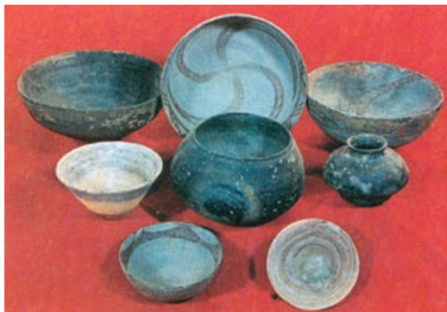
اشیای به دست آمده از یک قبر در شهر سوخته (۲ تا ۳ هزار سال پیش از میلاد)