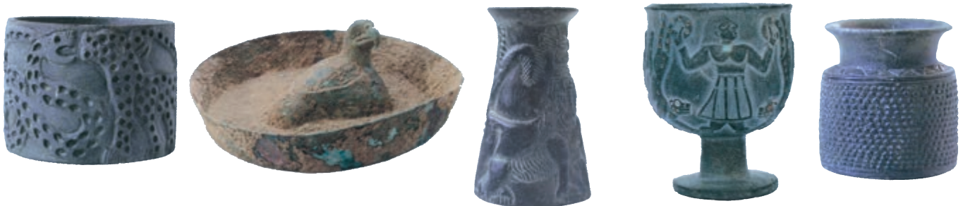
نمونه‌هایی از آثار یافت شده در ۳۰ کیلومتری جیرفت

مردمان تمدن جیرفت و نواحی دور و نزدیک آن، که در مسیر هلیل رود می‌زیسته‌اند، چه کسانی بوده‌اند؟ حاکم