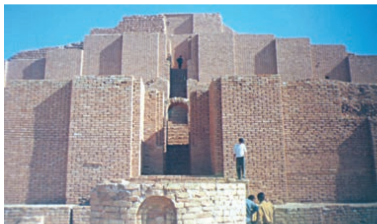
زیگورات چغازنبیل. در تصویر بالا نمای بازسازی شده آن را می‌بینید.

شاتن‌ها مراسم دینی را برگزار می‌کردند و هنگام عبادت و نیایش در صف مقدم جای داشتند. ایلامی‌ها برای خدایان خود، مانند تمدن‌های میان دو رود، معبد‌های چند طبقه می‌ساختند که یک نمونه آن، زیگورات چغازنبیل است. هنگام برگزاری مراسم دینی، نذرهایی پیشکش خدایان می‌شد.