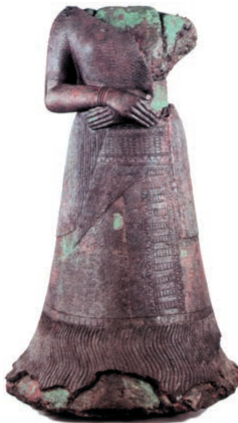
پیکره ملکه ناپیر — اسو همسر اونتش گل قرن سیزدهم ق.م — بلندی ۱/۲۹ سانتی متر — عرض ۷۳ سانتی متر — جنس مفرغ در موزه لوور پاریس نگهداری می شود.

در همان زمان که تمدن های سومر و ایلام دوران رونق و شکوفایی خود را می گذراندند، در مشرق ایران شهرهای آباد و باشکوهی وجود داشت که از حیث پیشرفت های علمی و صنعتی چیزی از شهرهای سومری و ایلامی کم نداشتند. کناره های هلیل رود از جمله مراکز تمدنی شرق ایران بوده که آثار و بقایای شهرهای آن در تپه های واقع در ۳۰ کیلومتری جیرفت، یافت شده است. بقایای ساختمان های مسکونی، مقبره ها و ظروف و ابزارهای سفالی و سنگی از جمله آثار کشف شده از این شهرهاست. از میان این آثار، ظروف و ابزارهای سنگی از جنس سنگ صابون که تصویر نمونه هایی از آنها را می بینید، زیباتر و چشمگیرترند. نقوش تزیین شده بر روی این آثار هنری از حیث دقت و زیبایی بسیار قابل توجه اند؛ به طوری که موجب شگفتی صاحب نظران و متخصصان هنر شده است. این نقوش شامل موضوعات مختلف می باشد، نظیر: عقاب، مار، پلنگ، شیر، بز کوهی، گاو، کاخ ها، باغ ها و موجوداتی که نیمی حیوان و نیمی انسان اند. همان گونه که در تصاویر می بینید، نبرد پلنگ با مار، مار با عقاب و اشتغال برخی حیوانات به گیاه خواری از جمله این نقوش است که با هنرمندی تمام ساخته شده اند. برخی از این صحنه ها برگرفته از مضامین