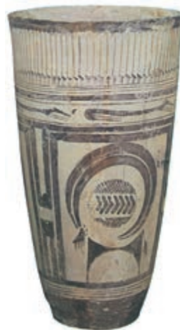
ظرف سفالی از گل پخته مربوط به هزاره چهارم پیش از میلاد. این ظرف که ارتفاع ۲۸/۵ سانتی متر و قطر دهانه آن ۱۶ سانتی متر است و در موزه لوور پاریس نگهداری می شود، مربوط به دوران اوج هنر سفال سازی در ایلام است. درباره تصاویر روی این ظرف و معنای استفاده از آنها مطلبی تهیه کنید.