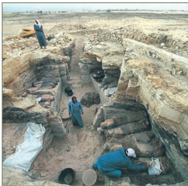
بخش بسیاری از آگاهی‌های تاریخی - به ویژه دربارهٔ گذشته‌های دور - از طریق حفاری‌های باستان‌شناسی به‌دست آمده است.

قدیمی و طبقه‌بندی آنها و پژوهش دربارهٔ آنها می‌پردازد و با حفاری و کشف آثار مربوط به انسان‌های پیشین، نظیر خرابه‌های مسکونی، ظرف‌ها، سکه‌ها، لوحه‌ها، مجسمه‌ها و... از دل زمین و یا بررسی آثار باقی‌مانده مانند تخت جمشید، طاق‌بستان، مسجد جامع اصفهان و صدها اثر دیگر، گزارش‌هایی دربارهٔ آنها تهیه می‌کند. باستان‌شناسان تاکنون موفق شده‌اند نکات بسیاری دربارهٔ زندگی انسان در روی زمین و تمدن‌های بسیار قدیمی کشف و شناسایی کنند. علاوه بر این، در گذشته در دربار شاهان، وقایع نگارانی بوده‌اند که وظیفه‌شان ثبت وقایع و اخبار بوده است. آنها ماجراهای مربوط به جنگ، ازدواج، شکار، میهمانی، ساختن بناها و... را می‌نوشتند.