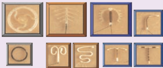
انواع آی - یو - دی