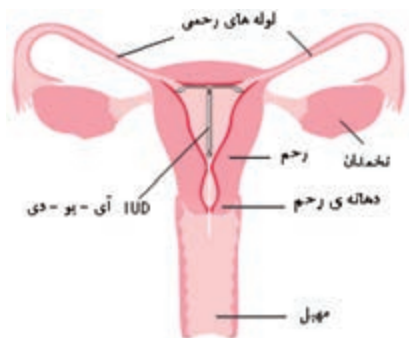
آی - یو - دی در رحم

از خود هورمون ترشح می‌کند و حدود ۹۹٪ در پیشگیری از بارداری مؤثر است.