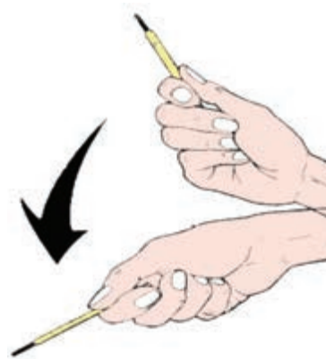
نحوه‌ی استفاده از دماسنج