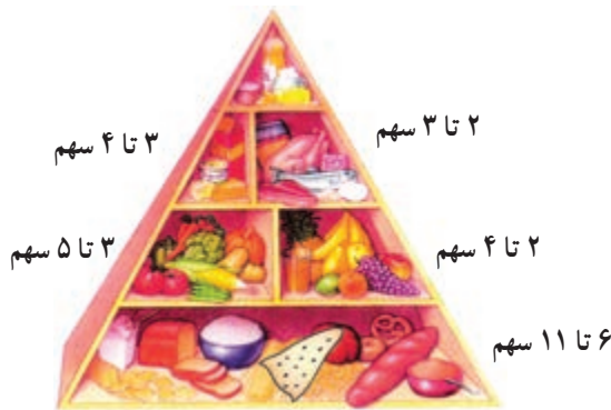
هرم غذایی نوجوان

نمونه‌ی رژیم غذایی برای افراد در دوره‌ی بلوغ