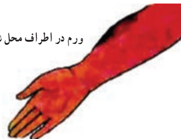
ورم در اطراف محل شکستگی