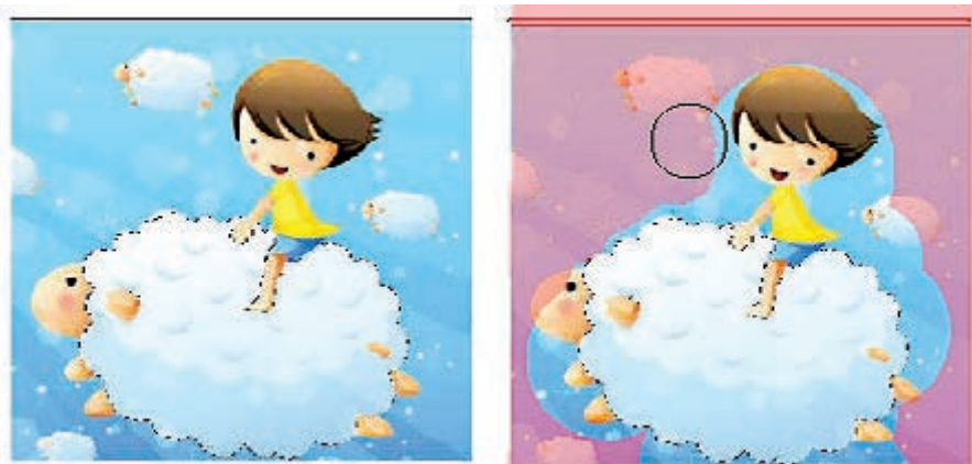
شکل ۴-۲۳ افزایش و کاهش ناحیه انتخاب با استفاده از Quick Mask

۵. تغییرات مورد نظرتان را بر روی تصویر بدهید. تغییرات تنها در ناحیه انتخاب شده اعمال می‌شود. ۶. گزینه Select | Deselect را برای خارج کردن ناحیه انتخاب شده از حالت انتخاب، کلیک کنید یا این که ناحیه انتخاب شده را ذخیره کنید.