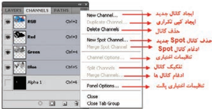
شکل ۳-۲۳ دستورهای منوی کانال

می‌توانید در یک تصویر با مد CMYK کانال‌های رنگی تصویر را از هم جدا کنید و سپس کانال‌ها را جدا از هم ذخیره کنید یا کانال‌های جدا شده را با هم ادغام کنید. در شکل ۳-۲۳ تصویری دیده می‌شود که کانال‌های رنگی آن از هم جدا شده‌اند. (شکل ۳-۲۳)