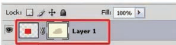
شکل ۶-۲۳- جابه‌جای ماسک لایه

برای این منظور در پالت لایه‌ها بر روی علامت زنجیر کنار ماسک لایه کلیک می‌کنیم تا غیرفعال شود سپس با ابزار Move و با درگ کردن آن را جابه‌جا می‌نماییم در این حالت ماسک نیز با حرکت ماوس جابه‌جا خواهد شد اما تصویر بدون حرکت باقی می‌ماند.