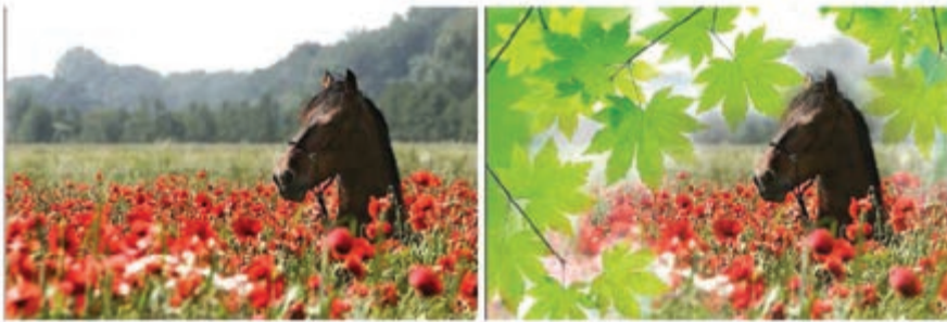
شکل ۵-۲۳ ترکیب دو تصویر با استفاده از Mask