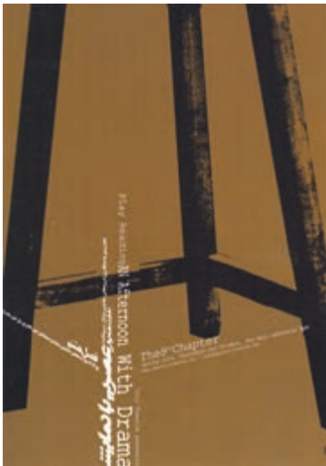
نمونه‌ی استفاده از ترکیب‌بندی مثلثی در یک پوستر (راس مثلث خارج از کادر واقع شده است.)

آثاری که دارای ترکیب‌بندی مثلثی هستند، عموماً از استحکامی استثنایی برخوردارند. هنرمندان رشته‌های مختلف هنری در بسیاری از موارد از استحکام و ساختار منسجم مثلث، برای ترکیب‌بندی سود برده و کیفیت آن‌را با نیاز تصویر مورد نظر خود منطبق کرده‌اند.