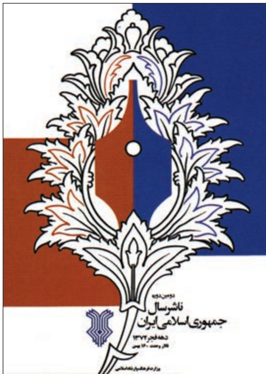
تعادل متقارن در اثر آقای مصطفی اسداللهی