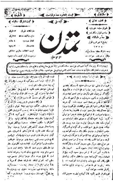
روزنامه تعداد از نشریات دوره انقلاب مشروطه

۳- شتاب‌زدگی: یکی از مشکلات مهم در مورد مندرجات نشریات این است که چون با سرعت و عجله تهیه و چاپ می‌شوند، امکان بروز اشتباه در آنها زیاد است. به دلیل اهمیت مسأله زمان در تولید نشریات و به‌ویژه روزنامه‌ها، دست‌اندرکاران آنها به ناچار فرصت کافی برای تحقیق و بررسی پیرامون درستی یا نادرستی همه اخبار و جزئیات آنها را ندارند. عجله و محدودیت وقت همچنین موجب می‌شود که اشتباهات چاپی در نشریات راه یابد. بنابراین در بسیاری مواقع اخبار موجود در نشریات با وجود تازه و دست‌اول بودن، کامل نیستند.