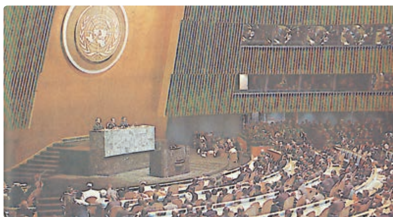
سازمان ملل متحد