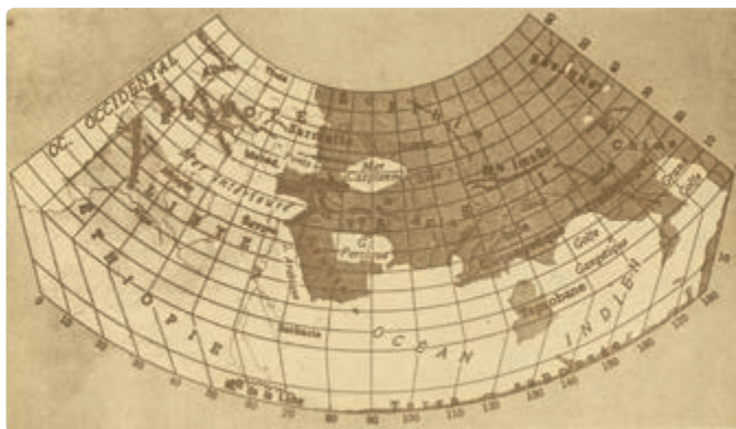
نام خلیج فارس در نقشه جهان بطلمیوس