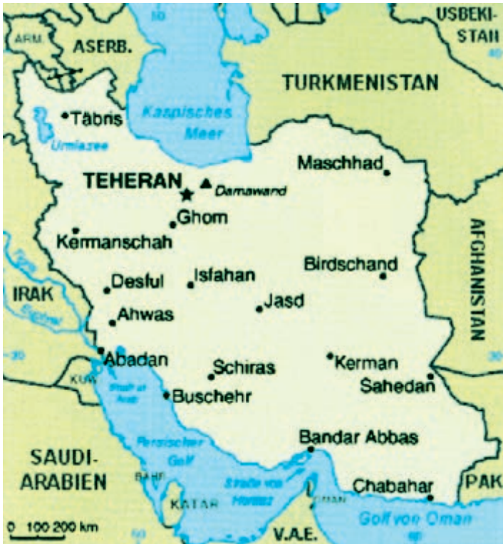
Die islamische Republik, Iran